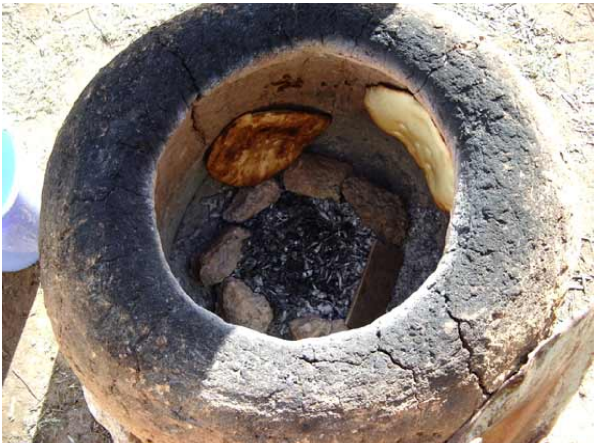
Fig. 3 - Un esempio di forno tabouna.