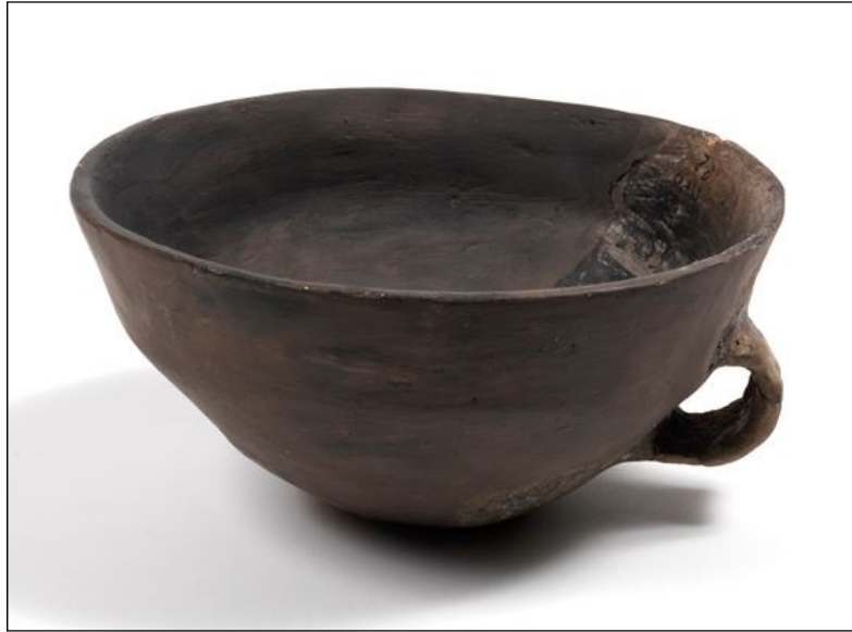
Fig. 3 - Tazza carenata monoansata dal Nuraghe Pizzinnu, Posada (secoli XIV-XII a.C.).