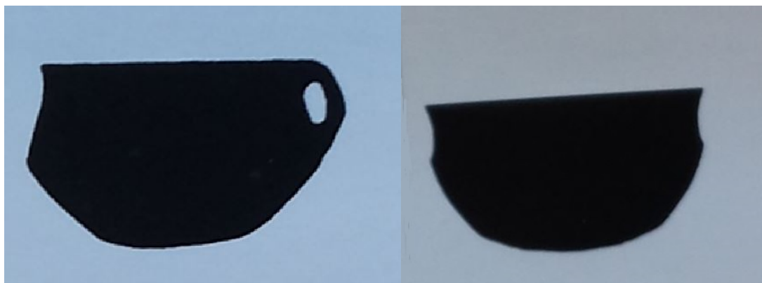
Fig. 1 - Esempi generici di tazze carenate (da Corda, Frau 2001).

Le tazze carenate sono dei recipienti in terracotta di uso quotidiano, normalmente forniti di manico, utilizzati per bere. Manufatti appartenenti a questa tipologia (fig. 1) sono stati rinvenuti in tutta l'area del monumento e si differenziano per la posizione della carena (a spigolo vivo o appena accennata e visibile sono all'esterno) e l'altezza e la forma del collo (quasi verticale, inclinato all'interno o rovesciato all'esterno; fig. 2). Le tazze risultano modellate a mano, ma con una rifinitura dei particolari eseguita con molta cura. Quando presenti, le anse sono sempre a nastro (fig. 3); alcuni esemplari sono dotati di piccole prese con o senza foro, applicate sulla carena. Una tazza si distingue dalle altre per avere quattro prese diametralmente opposte impostate sul filo della carena e per la presenza di buvette nella parte inferiore della superficie esterna (fig. 4).