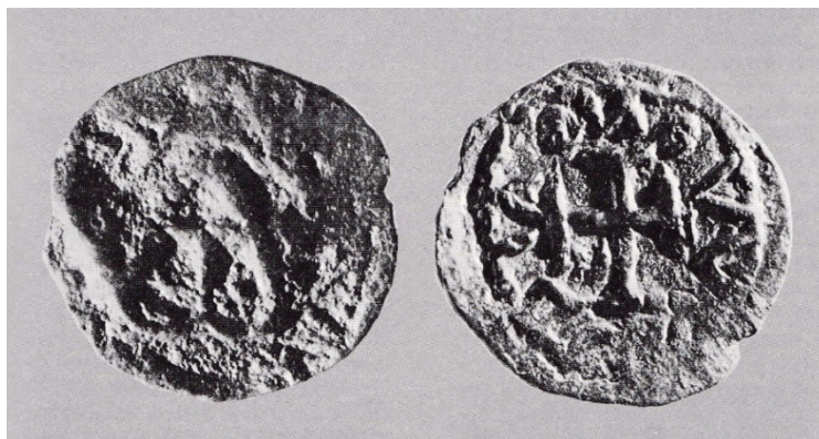
Fig. 4 - Tremisse di Leone III, rinvenuto nella necropoli di Part'e Sole (da D'ORIANO et alii 1989, fig. 45).