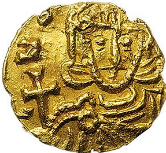
Fig. 2 - Tremisse di Leone III, Siracusa.

Fra i reperti rinvenuti nelle tombe della necropoli di Part'e Sole vi è una moneta di Età Bizantina, un tremisse, attribuibile all'imperatore Leone III 2 (figg. 2-3), il cui rinvenimento è particolarmente importante perché, sotto il regno di questo sovrano, terminano le emissioni sardo-bizantine, inaugurate con Costantino IV e riconducibili ad una zecca ubicata con tutta probabilità a Cagliari. Queste monete sono di solito contrassegnate dalla lettera S (per Sardinia ) nel recto ; questo simbolo, però, non sembra essere presente nell'esemplare di Posada, il quale si presenta in cattivo stato di conservazione (fig. 4).