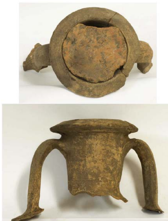
Fig. 3 - Anfora greco-italica antica con tappo in argilla (da SANCIO 2012, fig. 5).