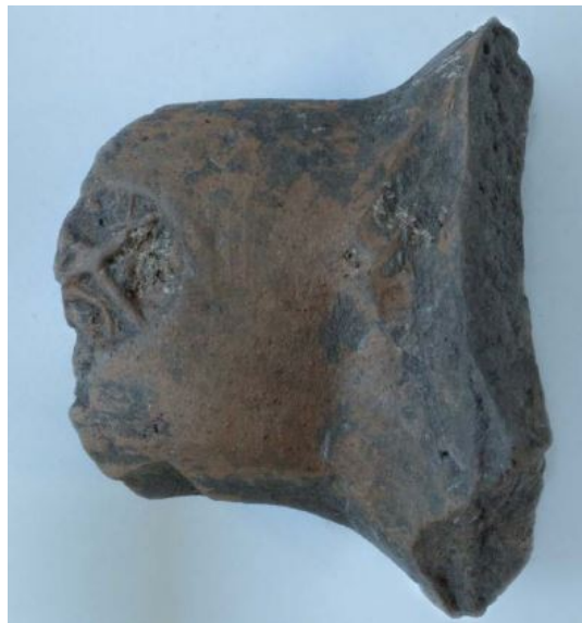
Fig. 3 - Ansa con bollo da Posada (da SANCIO 2012, p. 178, fig. 9)