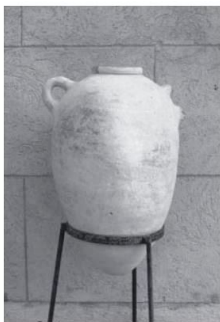
Fig. 3 - Anfora della tipologia T-3.1.1.2. di Ramón, Mozia (da TOTI 2003, tav. CCIV, fig. 2).