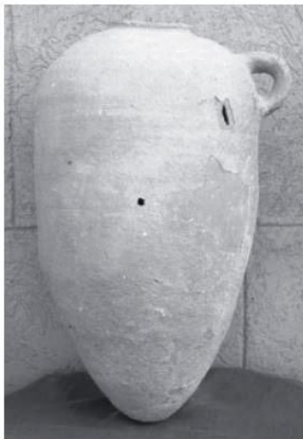
Fig. 2 - Anfora della tipologia T-3.1.1.2. di Ramón, Mozia (da TOTI 2003, tav. CCIV, fig. 1).