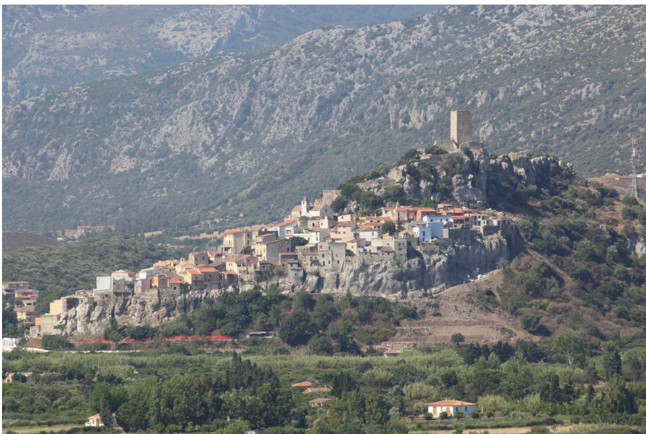
Fig. 1 - La rocca di Posada vista da Nord-Est.

Durante l'Età Nuragica la rupe di Posada (fig. 1) non era disabitata: in base ad alcuni studi condotti negli ultimi anni, si ipotizza che l'area dove oggi sorge il Castello della Fava fosse occupata da un nuraghe a corridoio, a Sud-Est del quale si sviluppava un villaggio nuragico.