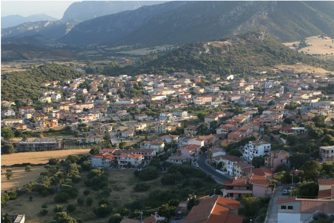
Fig. 2 - Sviluppo moderno dell'abitato di Posada; sullo sfondo, a sinistra il Monte Furchas, a destra il Monte Idda.