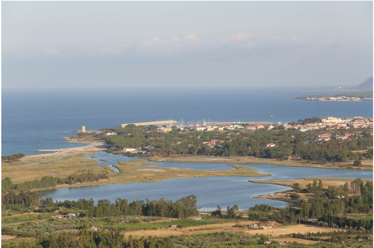
Fig. 1 - Località di San Giovanni di Posada vista dal Castello della Fava.