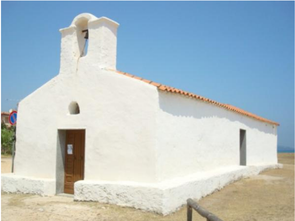
Fig. 3 - Chiesa di San Giovanni, identificabile con la Ecclesia Sancti Johannis de Portunono delle fonti antiche.