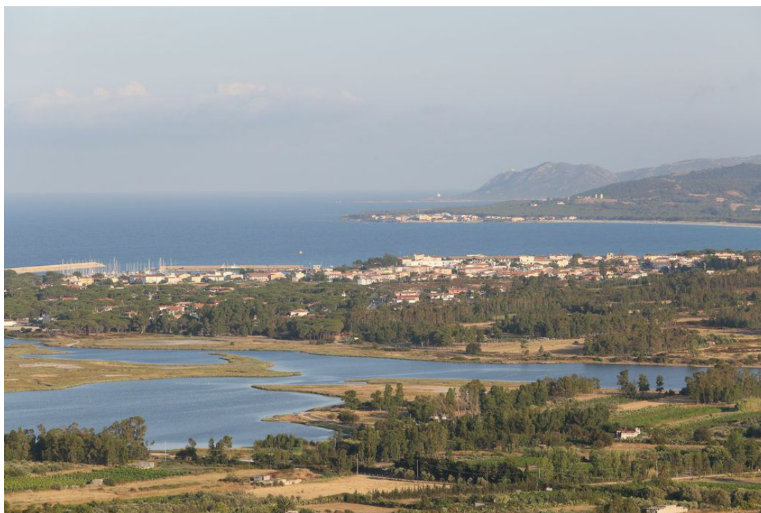
Fig. 2 - Panoramica della costa a Sud-Est di Posada; in secondo piano si vede l'abitato di San Giovanni, sullo sfondo Santa Lucia di Siniscola.