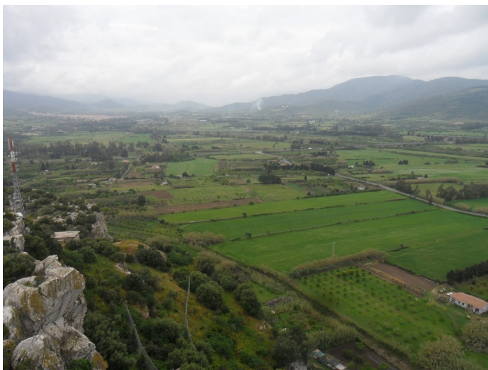
Fig. 3 - Territorio a Nord-Ovest del Castello della Fava, dove probabilmente sorgeva la villa di Arischion.