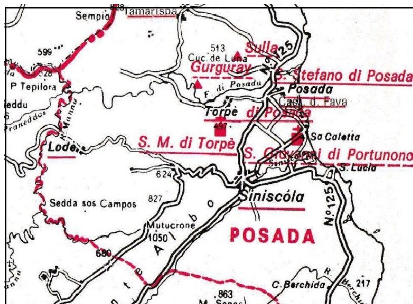
Fig. 1 - Toponimi della curatoria di Posada registrati dal Liber fondachi (da PANEDDA 1978, p. 555).

Le fonti del XIV secolo collocano Sulla a Nord di Posada, nei pressi dell'attuale abitato di Sas Murtas , dove sono testimoniati anche affioramenti di materiale archeologico. La villa di Arischion era strettamente legata a quella di Sulla , in posizione limitrofa rispetto a quest'ultima (figg. 2-3). Molto probabilmente essa sorgeva nei pressi dell'attuale località di San Paolo, poiché a questo santo era dedicata la chiesa parrocchiale di Arischion , di cui non esiste più traccia. In questa stessa zona, inoltre, si segnala la dispersione di materiale archeologico, che potrebbe indiziare la presenza di un insediamento.