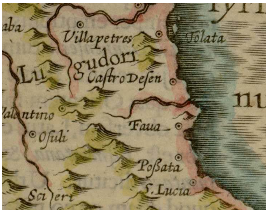
Fig. 1 - Particolare della mappa Corsica et Sardinia , dell'inizio del XVII secolo, in cui si nota l'indicazione dei toponimi Fava e Possata (da MERCATORE, Atlas Minor , p. 623).

Nella documentazione risalente al XIV secolo il borgo di Posada risulta essere un'entità distinta dal Castello della Fava (fig. 1). Esso potrebbe essere identificato nel rione di Santa Caterina (fig. 2), collocato ad occidente rispetto al castello. In quest'area si ha notizia del rinvenimento occasionale di materiale archeologico, tuttavia ipotesi maggiormente sicure potranno essere formulate solo in seguito ad un'accurata indagine scientifica. Da questa sede l'abitato posadino fu trasferito alle pendici del castello, probabilmente tra la seconda metà del XV e l'inizio del XVI secolo, per sfuggire alle incursioni dei pirati lungo la costa (figg. 3-4). Nell'antico borgo di Posada erano presenti diverse chiese parrocchiali, documentate dalle fonti antiche. L'esistenza di questi edifici religiosi proverebbe l'antica suddivisione in rioni (separati tra di loro, secondo lo schema di un abitato a grappolo) del vecchio borgo di Posada.