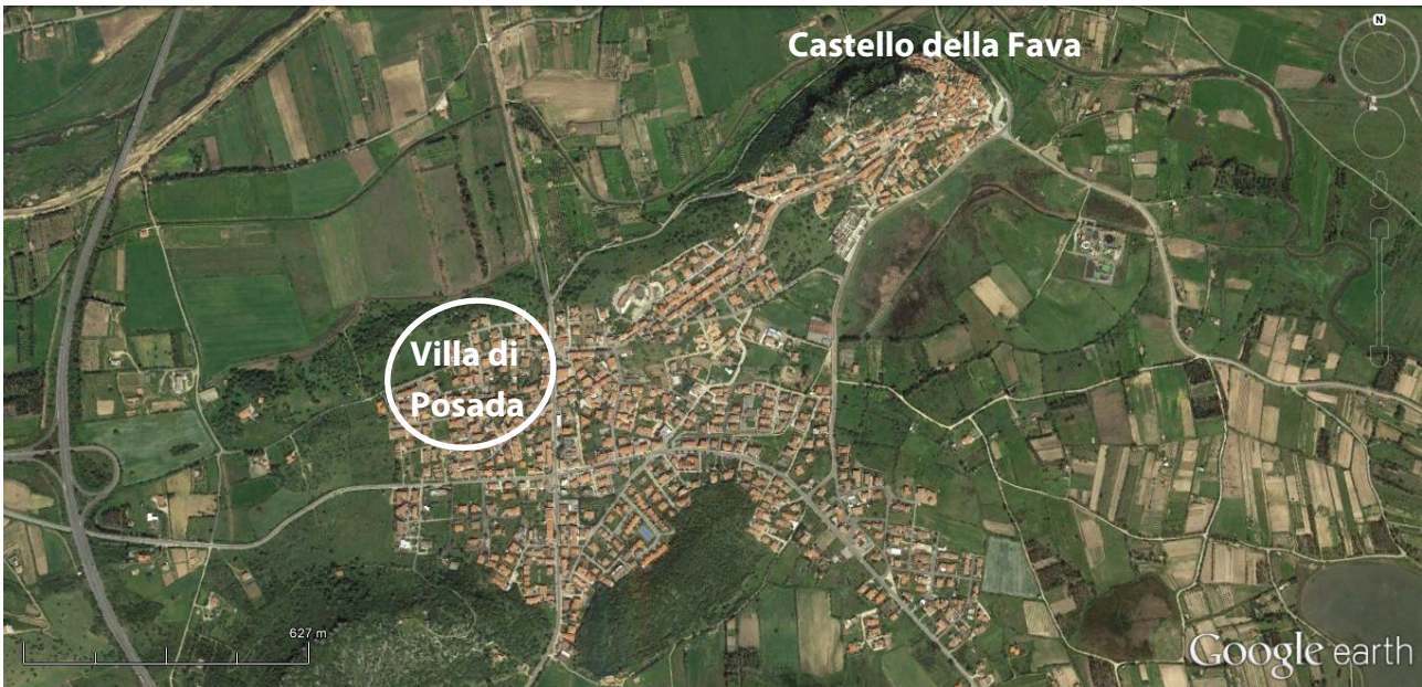
Fig. 3 - Probabile localizzazione dell'antica villa di Posada (da Google Earth, elaborazione di E. Dirminti).