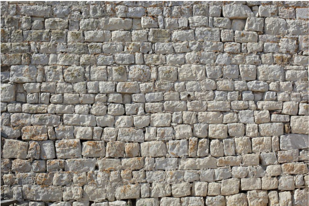
Fig. 2 - Particolare della struttura muraria della torre, a file di blocchi squadrati in pietra locale.

La struttura muraria della torre è caratterizzata da corsi paralleli di blocchi squadrati in pietra calcarea locale di dimensioni simili tra di loro (fig. 2); gli angoli sono rinforzati da conci più grandi, con la faccia esterna in alcuni casi lavorata a bugnato (fig. 3). La torre si sviluppa su tre piani, ognuno dei quali ha un'area leggermente più piccola di quello sottostante. Questa lieve rastrematura si nota nei paramenti murari esterni, dove, in corrispondenza del cambio di piano è visibile una sorta di risega (fig. 4). All'esterno, inoltre, si notano anche dei fori per l'alloggiamento delle travi dell'impalcatura, che attorniava la torre quando questa era in costruzione: alcuni di questi fori sono stati tamponati con laterizi.