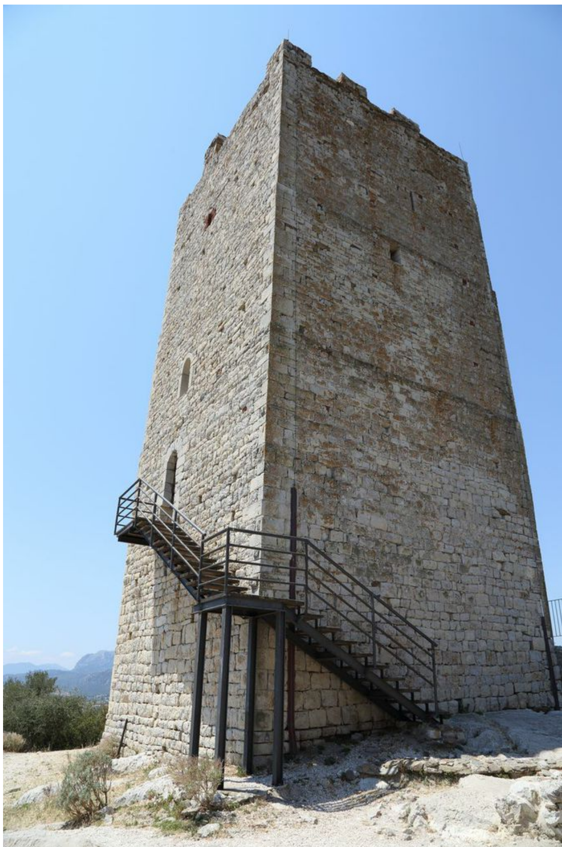
Fig. 6 - Torre vista dall'angolo di Nord-Est, con le varie aperture sul lato settentrionale e orientale.