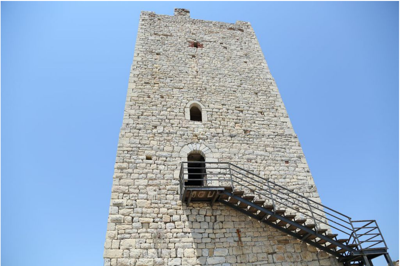
Fig. 5 - Facciata principale della torre; si notano le aperture allineate.

Internamente la torre è suddivisa in tre piani, cui si accede tramite ripide scale in legno. Sulle pareti si aprono varie tipologie di aperture: feritoie sui lati non prospicienti il mare e postierle funzionali al controllo dell'area circostante da parte della guarnigione che qui risiedeva. Sul lato della torre che guarda la costa, in perfetta corrispondenza assiale, sono visibili una finestra con sommità a tutto sesto e una stretta feritoia, profilata da laterizi e probabilmente aperta in un momento successivo alla costruzione della torre (figg. 5-6-7).