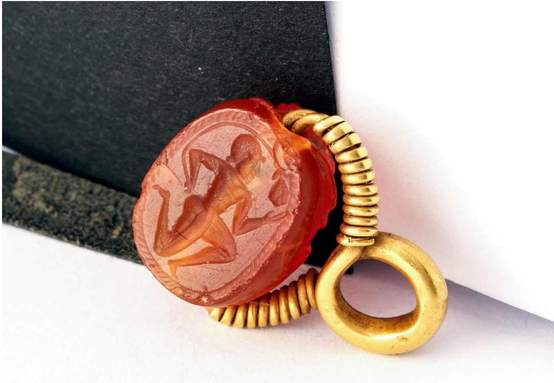
Fig. 4 - Ovale di base dello scarabeo con incisione raffigurante un personaggio maschile. Museo Archeologico Comunale "F. Barreca"