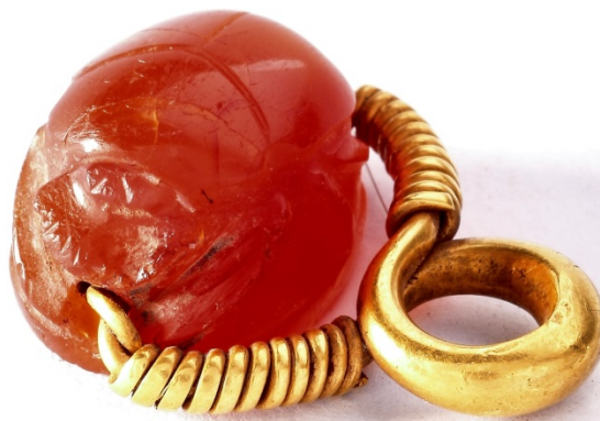
Fig. 3 - Scarabeo in corniola. Museo Archeologico Comunale "F. Barreca"

L'iconografia è, come si è detto, di stile grecizzante, ma gli scarabei punici presentano anche lo stile egittizzante, orientalizzante ed etrusco, oltre a quello misto, che mescola elementi figurativi di diverse culture.