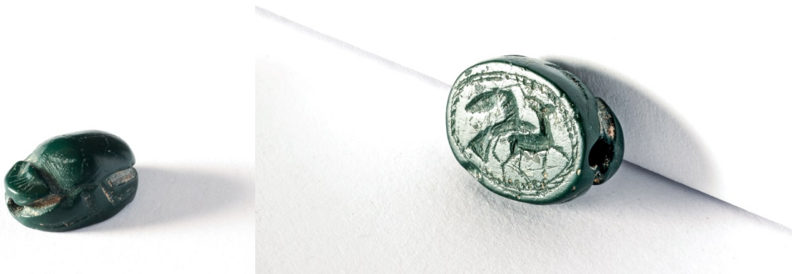
Fig. 6 - Dorso e ovale di base di scarabeo in diaspro verde con iconografia di cervide ghermito da un'aquila, Museo Archeologico Comunale "F. Barreca".

La corniola è la seconda pietra più diffusa nella glittica punica e in quella sarda in particolare, dopo il diaspro verde, al quale bisogna riconoscere la preminenza assoluta di utilizzo per questa classe di materiali (fig. 6). Altre pietre dure utilizzate sono l'agata, il cristallo di rocca, il calcedonio. Ma diversi esemplari, soprattutto appartenenti al periodo fenicio (VII-VI sec. a.C.) sono in pasta o in steatite.