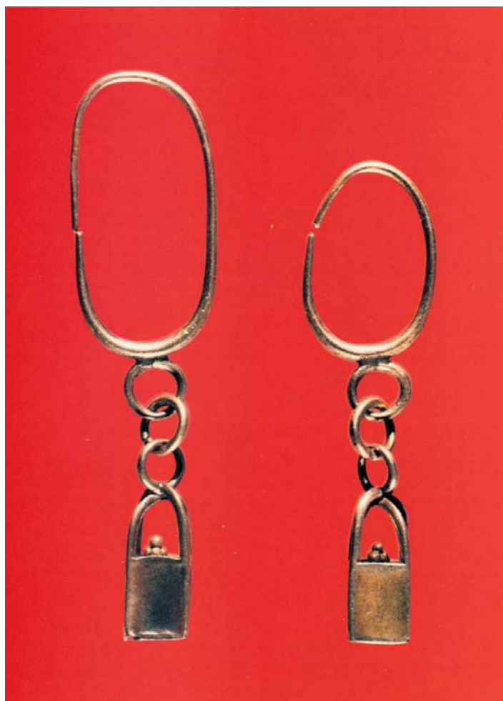
Fig. 3 - Orecchini a pendente in forma di cestello, da Tharros. Museo Archeologico Nazionale di Cagliari (da ACQUARO 1984, p. 20, fig. 7).