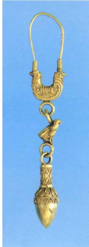
Fig. 5 - Orecchino in oro a filigrana e granulazione da Tharros. Museo Archeologico Nazionale di Cagliari (da QUATTROCCHI PISANO 1974, tav. I, fig. 1).

Lo sviluppo dell'artigianato orafo, con le possibilità offerte dal commercio dei metalli lungo le rotte del Mediterraneo, è legato ad una tradizione artistica assai ricca ed affermata da secoli presso la madrepatria Fenicia 1 . In Sardegna la documentazione di Tharros appare finora quella più ampia e più rilevante per qualità e quantità nell'ambito dei gioielli come degli altri athyrmata 2 . Difficile dire se l'orecchino di Sulkysia stato forgiato dalle officine sulcitane o se provenga da quelle ben note di Tharros, se non anche dalla Fenicia. Il dubbio in merito è generato dall'evidenza di una sostanziale omogeneità e conservatorismo di questo genere di produzione che rende talora problematico distinguere tra gli esemplari prodotti in Oriente e quelli occidentali. Inoltre spesso i gioielli venivano conservati per più generazioni e questa caratteristica peculiare limita la possibilità di una loro precisa definizione cronologica, sicché, anche se rinvenuti in contesti archeologici