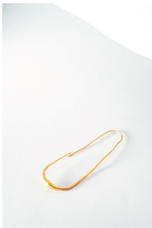
Fig. 1 - Orecchino a sanguisuga dalla tomba 9AR della necropoli di Sulky . Museo Archeologico Comunale "F. Barreca".

L'orecchino (lunghezza cm 7,3) ha il corpo costituito da una lamina tubolare in oro di forma ellittica, che si assottiglia alle estremità: si tratta di un oggetto molto semplice che, rispetto ad altri orecchini a sanguisuga che presentano un semplice rigonfiamento nella parte centrale del corpo, è caratterizzato dall'unione di due piccoli coni per la base (figg. 1-2).