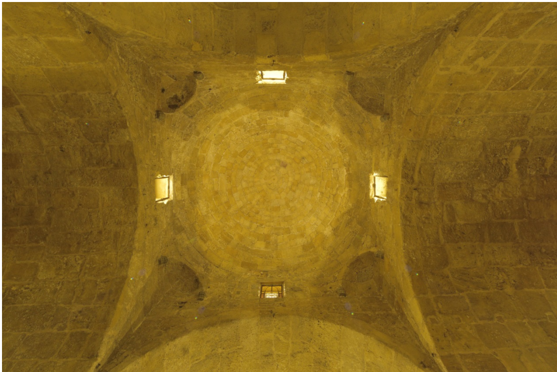
Fig. 6 - Sant'Antioco, cupola della basilica.

Il nucleo più rilevante dell'edificio è costituito dal corpo centrale cupolato: la cupola è infatti sostenuta da un tamburo ottagonale ed è raccordata al piano quadrato d'imposta mediante trombe angolari i cui archetti poggiano su peducci scolpiti a forma di guscio di tartaruga (le due coppie a Ovest) e di zampa leonina (le due coppie a Est) 10 (figg. 6-8).