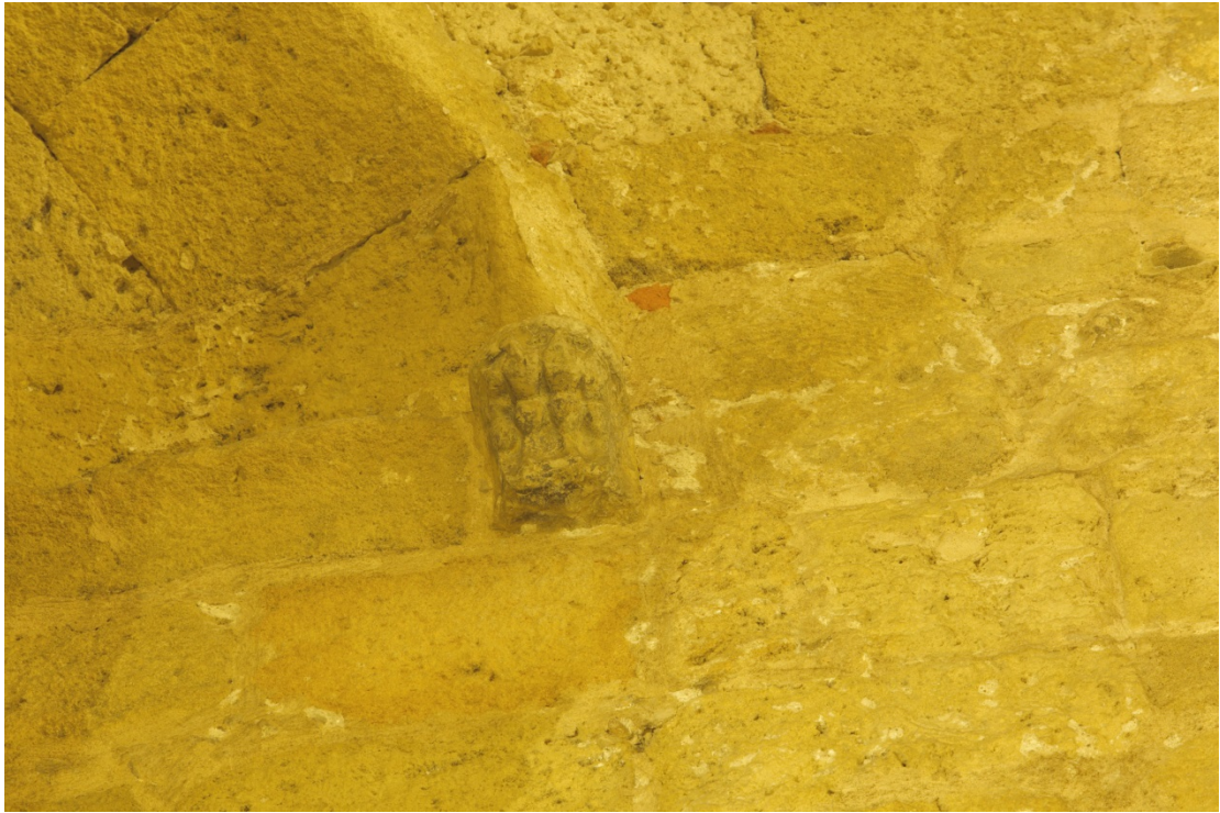
Fig. 7 - Sant'Antioco, peduccio della cupola a forma di piede di leone.