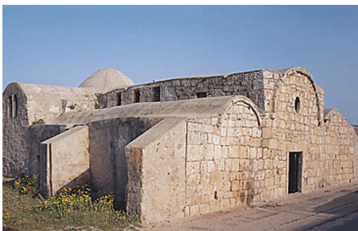
Fig. 3 - Chiesa di San Giovanni di Sinis ( http://www.sardegnaicultura.it/j/v/277?s=7&v=9&c=2488&notizia=18065&pic=7 ).

L'edificio originario è oggi totalmente inglobato entro corpi di fabbrica vari per età, conformazione architettonica e destinazione funzionale.