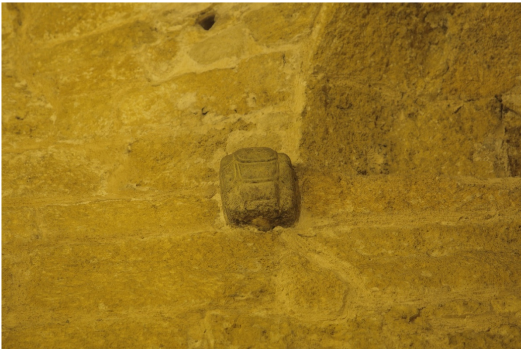
Fig. 8 - Sant'Antioco, peduccio della cupola a forma di guscio di tartaruga.