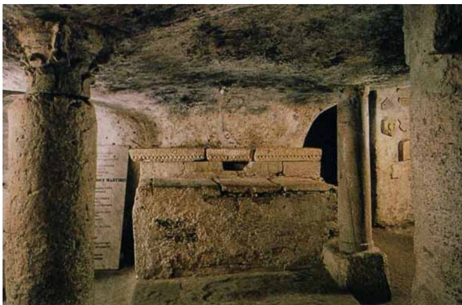
Fig. 1 - Altare-sarcofago di Sant'Antioco.

La basilica di Sant'Antioco ha una lunga storia ed è menzionata nella documentazione archivistica fin dall'età medievale. Nel 1089 il monasterium sancti Anthioci venne donato dal giudice cagliaritano Costantino II ai monaci Vittorini di Marsiglia, assieme alla chiesa riconsacrata dal vescovo sulcitano Gregorio nel 1102. L'isola di Sant'Antioco rimase comunque pressoché spopolata fino al XVIII secolo a causa delle incursioni dei Saraceni, anche se sopravvisse come centro devozionale. Un momento molto importante segnò la storia dell'isola e del suo santuario nel 1615, quando l'arcivescovo di Cagliari Francisco De Esquivel ordinò una ricognizione nelle catacombe, per confutare il preteso rinvenimento delle reliquie di Sant'Antioco a Porto Torres e dimostrare la tradizione, che sulla scorta dell' iscrizione del vescovo Pietro le ubicava nel sarcofago-altare entro cui si verificò l' inventio (fig. 1). Queste e altre notizie si rintracciano nelle opere manoscritte e a stampa dal XVII secolo ai giorni nostri che purtroppo non descrivono l'edificio o gli edifici di culto che riguardavano il santo martire 1 .