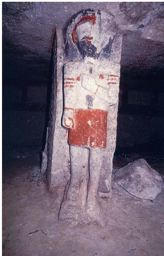
Fig. 9 - Personaggio egittizzante dipinto scolpito sul pilastro all'interno della camera funeraria n. 7 di Sulky (da Bernardini 2010, tav. I, 2)

ugaritiche, fu costretto ad affrontare lo scontro contro il terribile Mot , la "morte", e diviene il protagonista di una vicenda di scomparsa negli inferi e di ritorno alla vita, processo attraverso il quale ottiene il rango di Baal-Rpu cioè " Baal salvatore-guaritore ", capo dei Rephaim/Rapiuma 10 . Con questi presupposti si potrebbe leggere la figura del personaggio egittizzante scolpito sul pilastro della tomba a camera ipogeica n. 7 di Sulky come quella di una divinità protettrice, oppure come un avo divinizzato, probabilmente colui che avrebbe dovuto accompagnare il defunto nel suo viaggio verso l'oltretomba 11 (fig. 9).