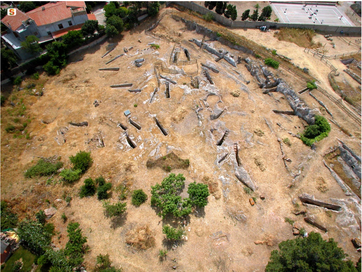
Fig. 1 - Parte della necropoli di Is Pirixeddus vista dall'alto (da http://www.sardegnaigitallibrary.it/mmt/480/29043.jpg ).

I Fenici credevano nella sopravvivenza dell'anima dopo la morte. Contrariamente a quanto facevano gli Egiziani, tuttavia, che imbalsamavano i propri defunti, essi inumavano o cremavano le salme. Il rito funebre della cremazione era tipico delle prime comunità fenicie della Sardegna (VIII-VI sec. a.C.), per poi diffondersi di nuovo in epoca più tarda (IV-III sec. a.C.), per effetto della influenza culturale greco-ellenistica, senza mai soppiantare comunque il rito dell'inumazione 1 (fig. 1).