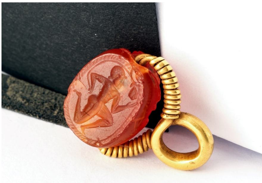
Fig. 6 - Scarabeo in corniola da Sulky . Museo Archeologico Comunale "F. Barreca".