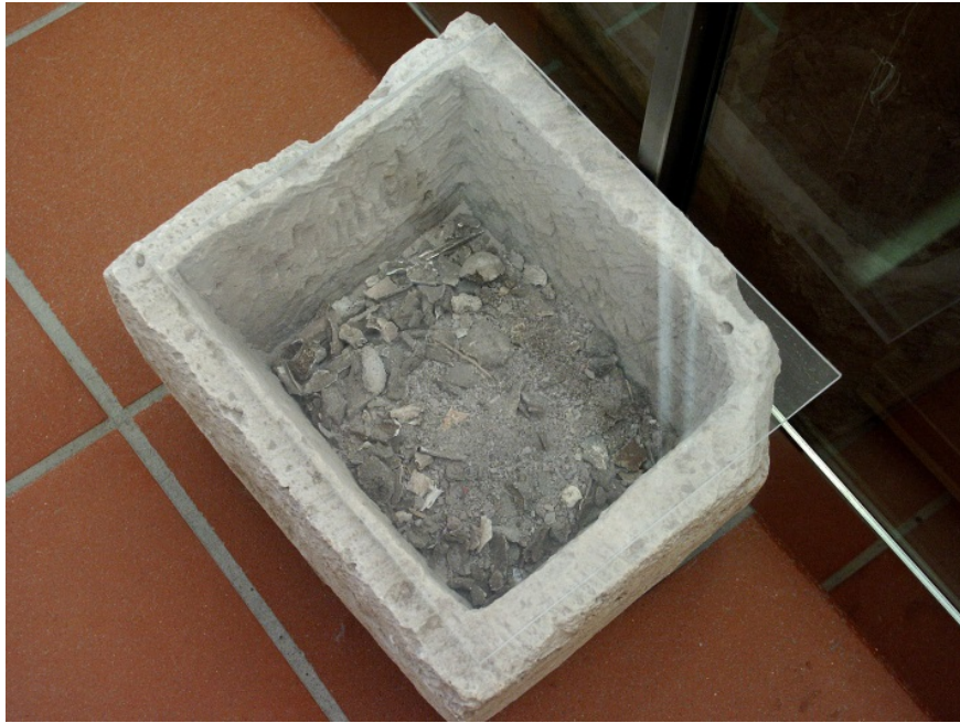
Fig. 3 - Cassetta di pietra utilizzata come contenitore di ceneri e ossa combuste, disposte ancora al suo interno. Museo Archeologico Comunale "F. Barreca".