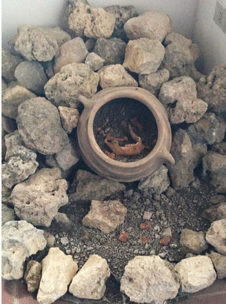
Fig. 2 - Ricostruzione di una sepoltura a enchytrismòs per infanti.

la parte tagliata era poi riaccostata e l'anfora deposta nella terra, all'interno di una fossa 2 (fig. 2).