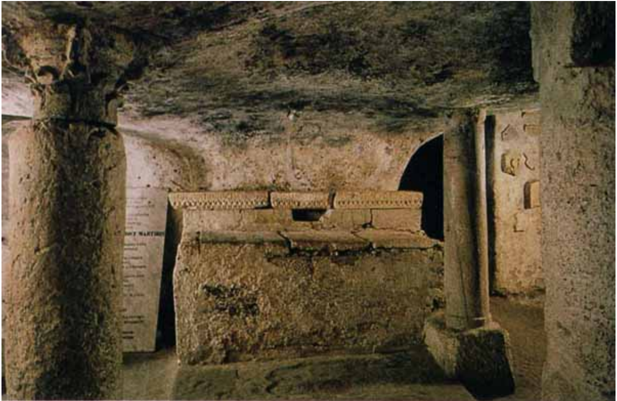
Fig. 4 - Altare-sarcofago di Sant'Antioco, all'interno delle catacombe omonime (in Bartoloni 1989, fig. 45).

Infatti, la costruzione del martyrium soprastante il cimitero, avvenuta in un momento forse prossimo al V sec. d. C. 4 introduce un tentativo di monumentalizzazione del suburbio, secondo una prassi diffusa nell'antichità cristiana 5 . L'edificio oggi esistente, dedicato al santo, non è quello del V sec. a.C. ma una costruzione la cui origine non risale oltre l'età bizantina (VI-X sec. d.C.) e che nei secoli sarà fatto oggetto di ampliamenti e trasformazioni (fig. 5).