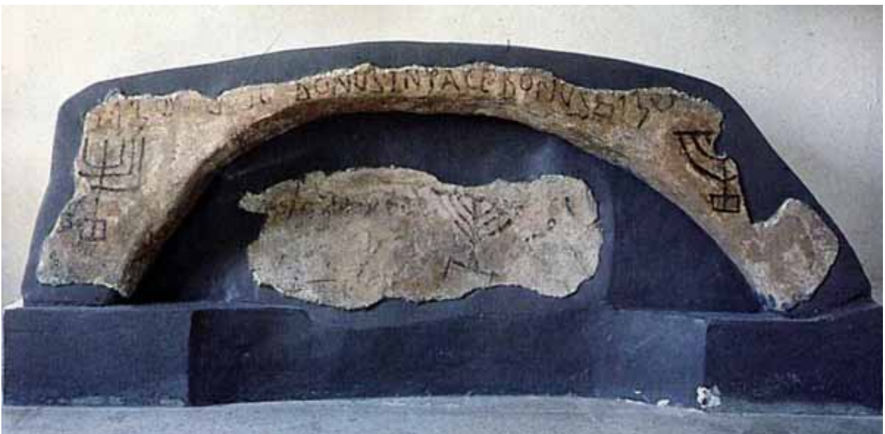
Fig. 1 - Decorazione di un arcosolio ebraico (da Bartoloni 1989, fig. 44).

Con la caduta dell'Impero Romano d'Occidente, collocata convenzionalmente nel 476 d.C., Sulky , come il resto della Sardegna, passò sotto il dominio vandalico. I Vandali erano una popolazione di origine germanica stabilitasi nel Nord Africa durante il IV sec. d.C.; la loro permanenza a Sant'Antioco avrebbe proseguito per circa ottant'anni ed è testimoniata tra l'altro da una tomba nella quale un uomo fu seppellito insieme al proprio cavallo 1 . La presenza dei Vandali fu probabilmente all'origine di un grave collasso economico seguito all'interruzione dei traffici mercantili con Roma e con la penisola 2 . Non risulta invece essersi arrestato il progredire del Cristianesimo e, proprio durante il V sec. d. C. a Sulky , esistono testimonianze della convivenza tra una comunità cristiana ed una giudaica, quest'ultima attestata almeno fin dal II sec. d.C. Furono queste le comunità cui si deve lo sfruttamento degli ipogei punici destinati così a sepolture a carattere familiare, nello stesso periodo e nel medesimo settore del suburbio cittadino (fig. 1-2).