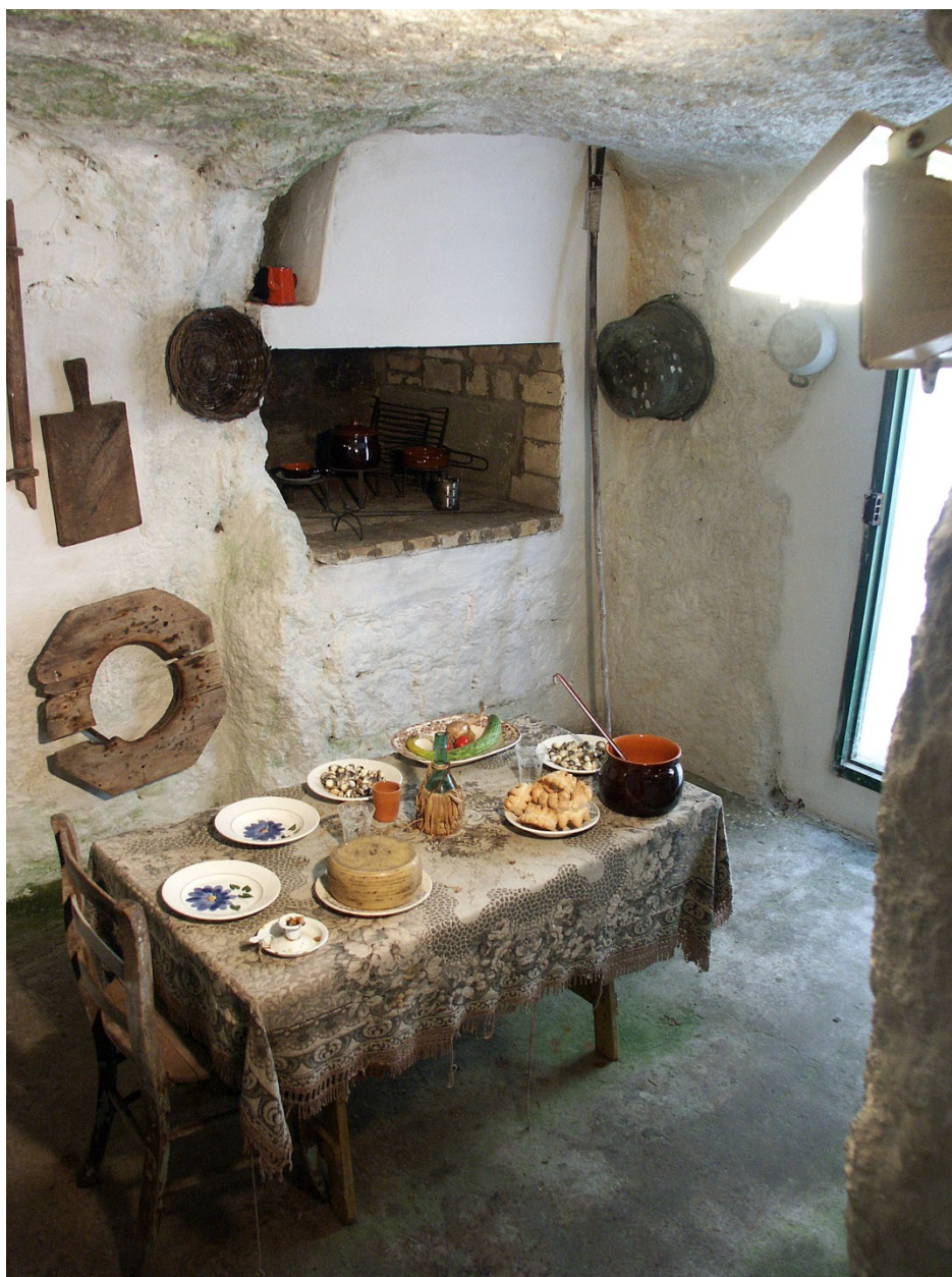
Fig. 8 - Ricostruzione in situ di uno degli ipogei punici sulcitani riutilizzati come abitazione a partire dal XVIII secolo.