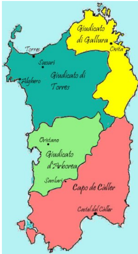
Fig. 7 - La suddivisione in giudicati della Sardegna, intorno al X secolo (da http://sito24.com/templates/template.php?tipo=I%20Giudicati%20Sardi&nome=storica&siteid=24676 ).

Sant'Antioco rientrava nel Giudicato di Cagliari. Nell'anno 1089 proprio il Giudice di Cagliari, Costantino, concesse ai monaci Vittorini il santuario di Sulci con l'intero territorio circostante. I monaci operarono dei restauri presso l'edificio di culto semidistrutto dalle incursioni; i lavori terminarono il 13 luglio 1102 e la chiesa venne nuovamente consacrata e riaperta 17 . Solo nel XVIII secolo, in epoca sabauda, iniziò un processo di ripopolamento del territorio che diede vita all'odierno abitato di Sant'Antioco: lo sviluppo edilizio si sovrappose alle rovine dell'antica Sulky . La parte più povera della popolazione occupò parte della necropoli punica sfruttandone gli ipogei come dimora e riadattandoli alle esigenze abitative più elementari (fig. 8).