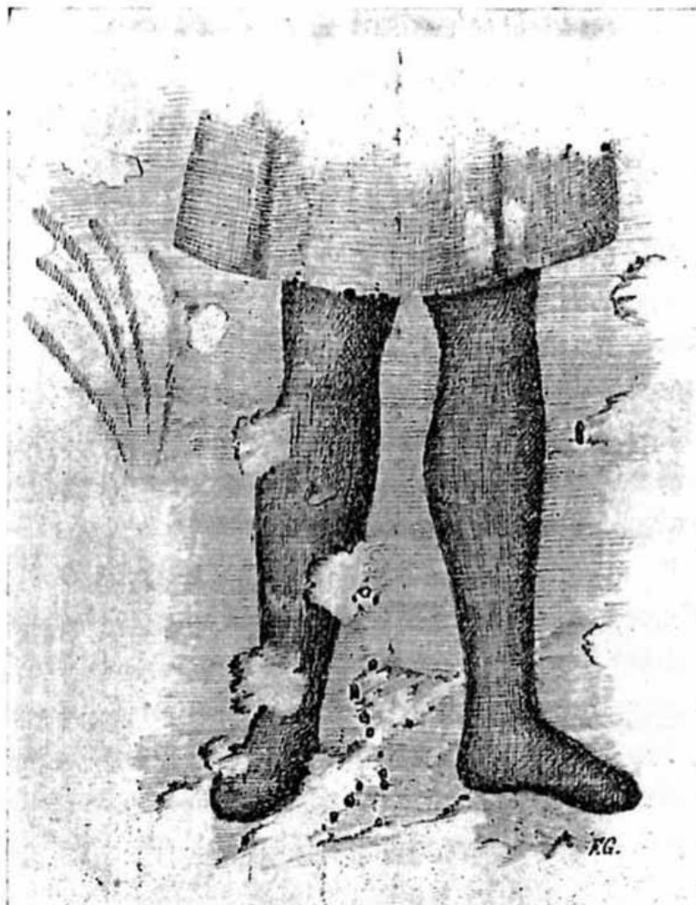
Fig. 2 - Ciò che resta della raffigurazione del Buon Pastore nella lunetta dell'arcosolio C, in fondo al corridoio B (in Taramelli 1921, p. 149, fig. 5).

I fossori occuparono alcuni ipogei punici ponendoli in comunicazione tra loro mediante l'apertura di varchi ottenuti perforando le pareti non troppo spesse, riorganizzando dunque lo spazio secondo un uso funerario che prevedeva l'iniziale apertura di sepolture nelle pareti e poi sul pavimento, dando origine così ai cimiteri noti come Catacomba di S. Antioco e Catacomba di Santa Rosa, quest'ultima ubicata proprio al di sotto dell'odierna basilica, mentre quella di S. Antioco si trova in una posizione laterale rispetto ad essa, a SE dell'edificio 3 (fig. 3).