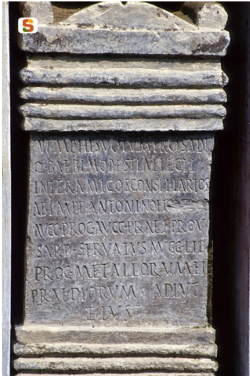
Fig. 1 - Iscrizione del Ninfeo.

Il cippo (fig. 1) è stato rinvenuto ancora nella sua collocazione originaria (figg. 2-4), entro una nicchia del Ninfeo a lato della grande natatio (fig. 5).