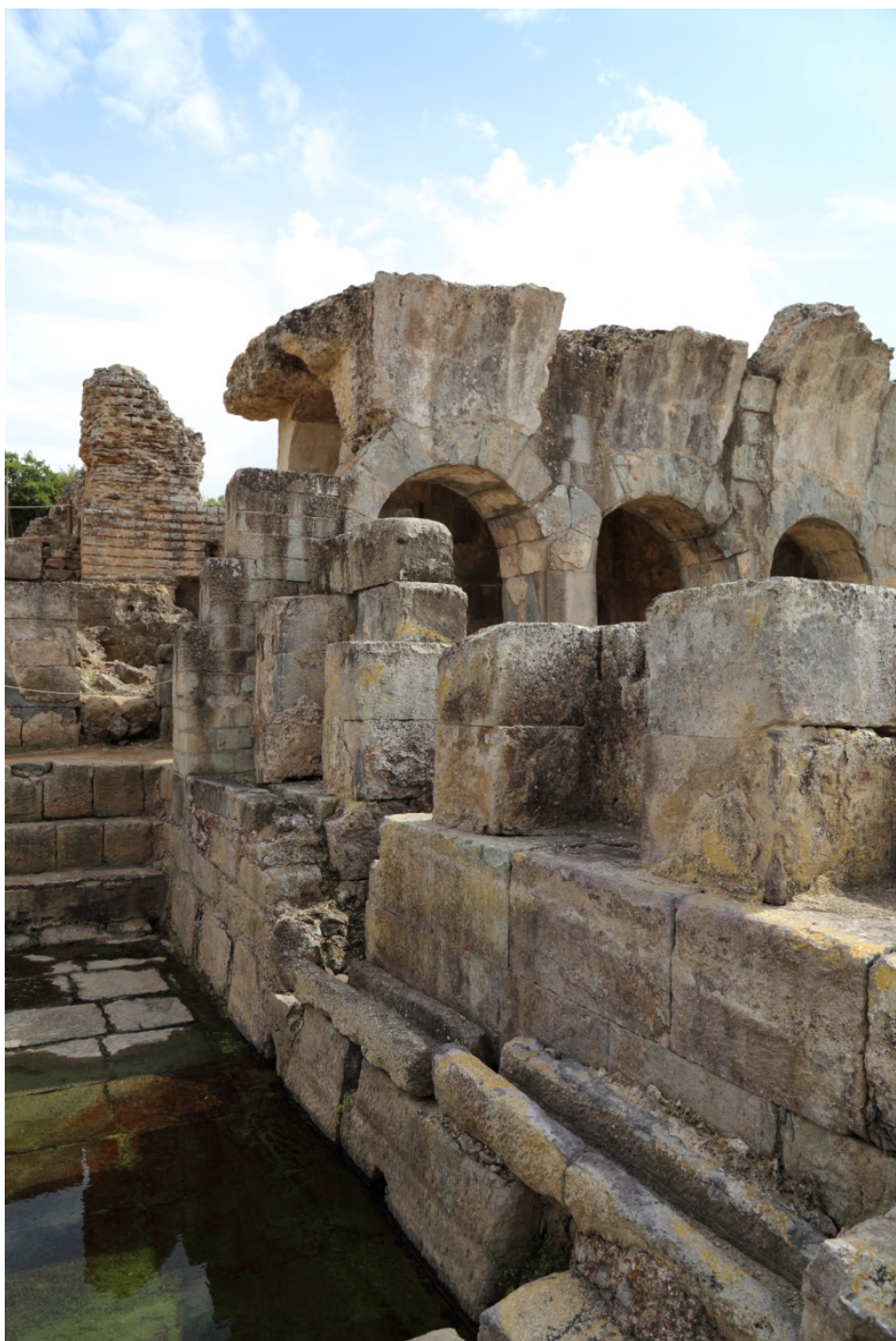
Fig. 5 - Il Ninfeo a lato della natatio

È scolpito in un blocco di trachite locale ed è sormontato da un piccolo timpano triangolare con acroteri, posto su una ampia cornice modanata, che si ripete alla base.