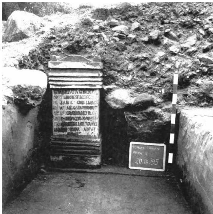
Fig. 3 - L'iscrizione del Ninfeo al momento del ritrovamento (da BACCO, SERRA 1998, tav. XIX).