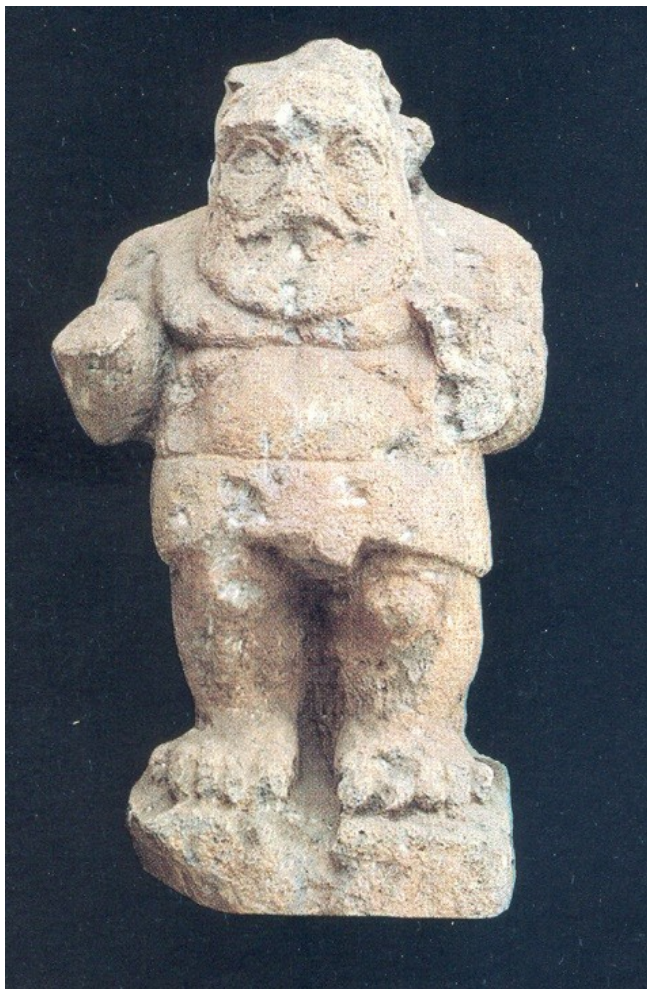
Fig. 3 - Statua di Bes da Cagliari. III-I sec. a.C. (da BARRECA 1986, p. 137)

mammelle pronunciate. Il culto di Bes è un culto popolare, ed è assai diffuso nella Sardegna tardo-punica e romana, come ci mostrano le statue di Bes rinvenute a Cagliari (fig. 3) e Bithia (Torre di Chia-Domus de Maria) (fig. 4).