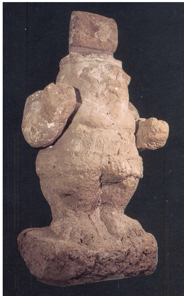
Fig. 4 - Statua di Bes da Bithia. Età Romana (da BARRECA 1986, p. 137)