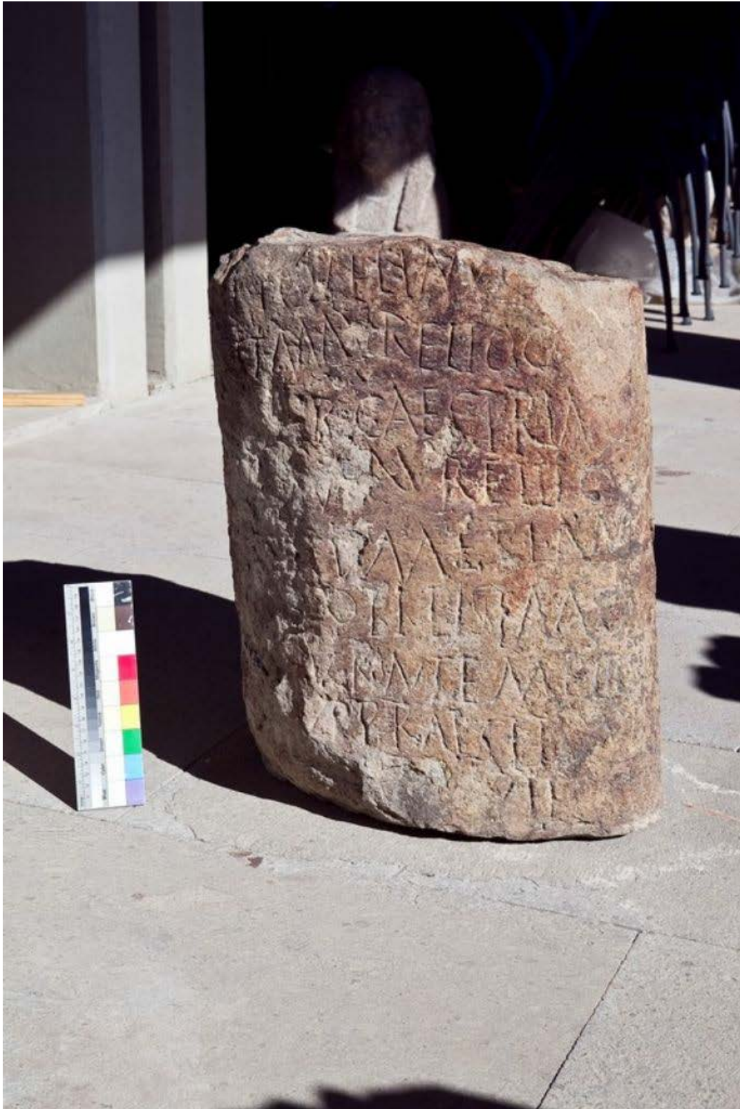
Fig. 2 - Miliario posto dal praeses Marco Elio Vitale nel 282-283 d.C..