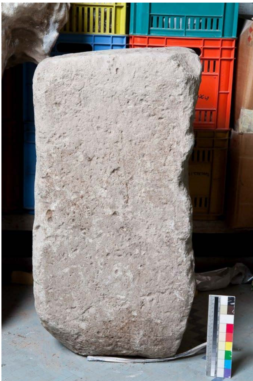
Fig. 3 - Cippo funerario di Germana , dedicatole dal marito, datato al II-III sec. d. C. (foto N. Monari, Archivio RAS).

L'iscrizione è mutila, perché il cippo fu scalpellato per essere riutilizzato verosimilmente come materiale da costruzione. Reca la dedica alla moglie Germana morta a 48 anni, da parte del marito: