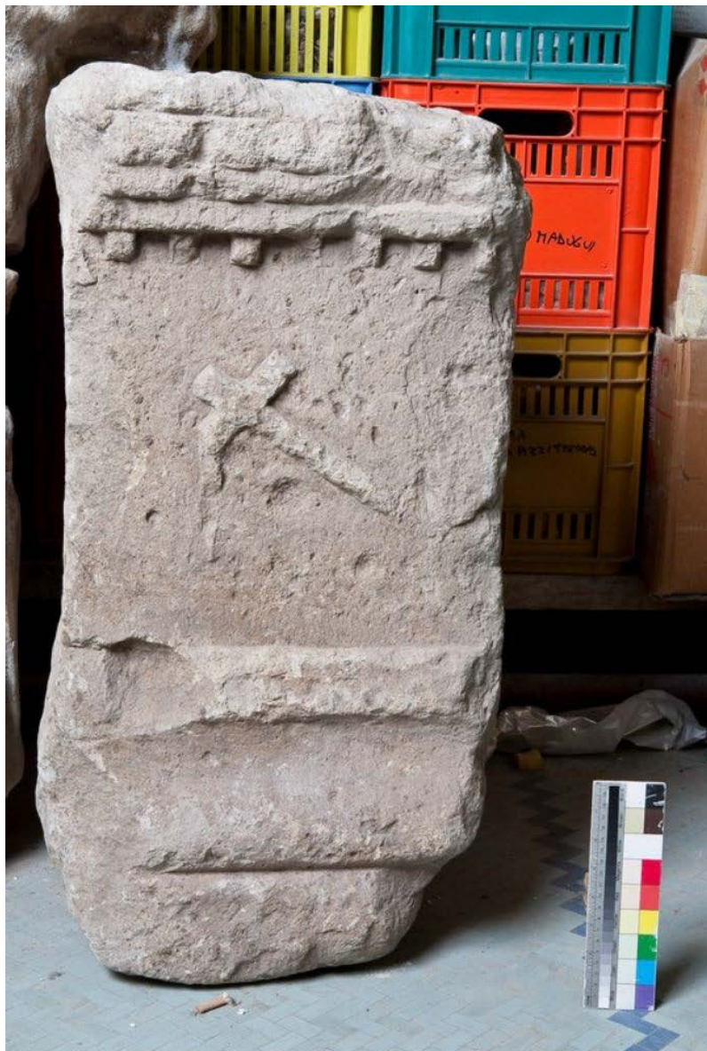
Fig. 1 - Cippo funerario di Germana , dedicato dal marito, datato al II-III sec. d. C. (foto N. Monari, Archivio RAS).

Il cippo funerario fu rinvenuto agli inizi del secolo scorso nei pressi di Fordongianus. Di forma parallelepipedica, conserva il coronamento costituito da una triplice modanatura sottolineata da una fila di dentelli. Su di un lato è rimasto ben conservato e scolpito a rilievo il simbolo dell'ascia (figg. 1-3).