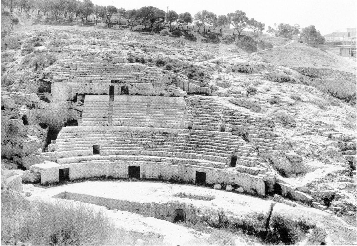
Fig. 3 - L'anfiteatro romano di Cagliari, scavato nella roccia.

In Sardegna sono conosciuti pochi anfiteatri: Cagliari, Nora, Sant'Antioco, Tharros e Fordongianus. I resti più imponenti sono senza dubbio quelli dell'anfiteatro cagliaritano, di grandi dimensioni e ricavato nella roccia del colle di Buoncammino (figg. 3-4).