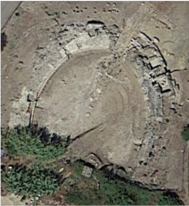
Fig. 1 - Immagine dell'anfiteatro di Fordongianus in corso di scavo.

L'anfiteatro di Forum Traiani è collocato nella piccola valle denominata "Apprezzau", in posizione periferica spostata poco a più a Sud rispetto alla città romana (figg. 1-2).