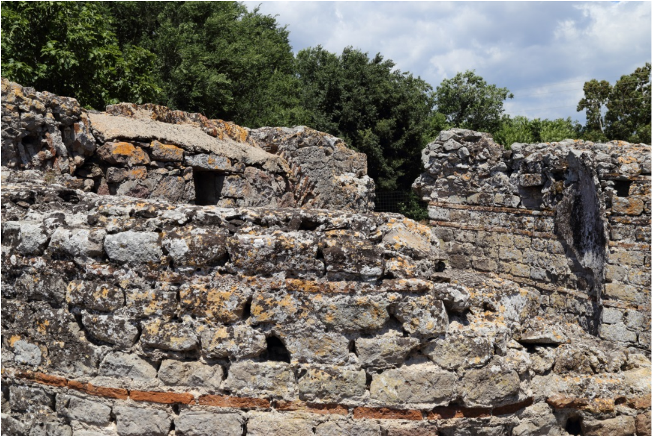
Fig. 4 - Dettaglio della tecnica costruttiva in opus vittatum mixtum

Prima del ritrovamento del Ninfeo a fianco della natatio questa struttura era stata ipotizzata come ninfeo, ma tale interpretazione adesso è da rifiutare; la sua funzione rimane da chiarire. In assenza di dati di scavo e considerati i numerosi interventi di ristrutturazione cui è stato sottoposto sino ad età moderna, l'unico elemento che consente di proporre una datazione è la tecnica edilizia adottata che lo affianca cronologicamente alle Terme II.