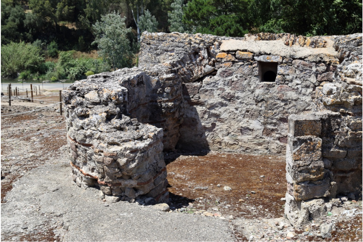
Fig. 3 - Veduta dell'edificio da Sud, con in evidenza il vano absidato