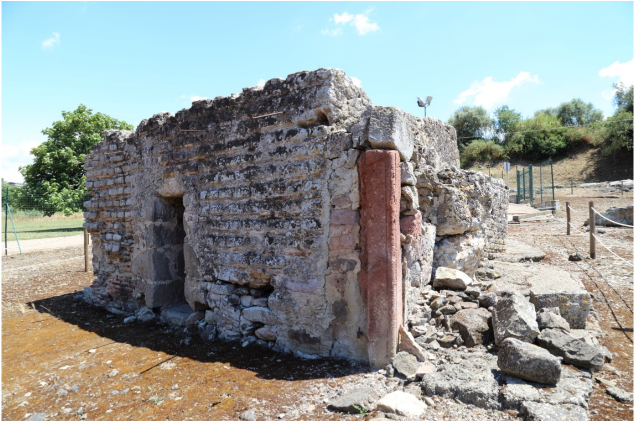
Fig. 2 - Edificio considerato un ninfeo, sottoposto a ristrutturazioni sino ad epoca moderna

L'ambiente è di forma rettangolare con piccola abside (fig. 3) sul lato Sud, ed è dotato di una vaschetta.