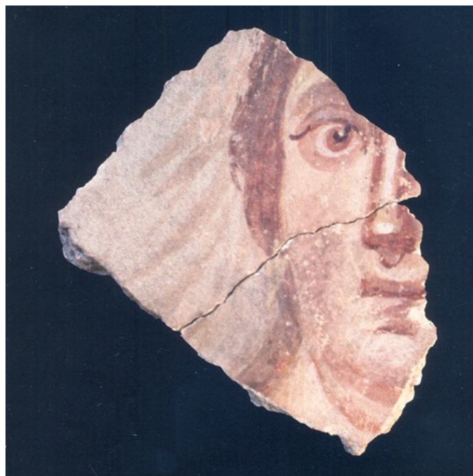
Fig. 3 - Cagliari, Villa di Tigellio: volto femminile (da ANGIOLILLO 1987, fig. 120).