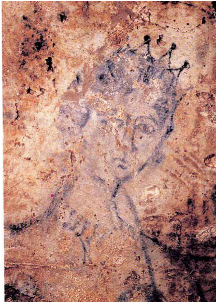
Fig. 4 – Ipogeo di San Salvatore di Cabras (OR). Volto di Venere (da DONATI-ZUCCA 1992, p. 29)

In ambito culturale si hanno maggiori testimonianze, con la rappresentazione di una serie di soggetti sacri nell'ipogeo di San Salvatore di Cabras (fig. 4).