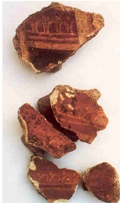
Fig. 2 - Nora. Resti di decorazione pittorica di una casa di III sec. d.C. (da GHEDINI, SALVADORI 1996, tav. I)