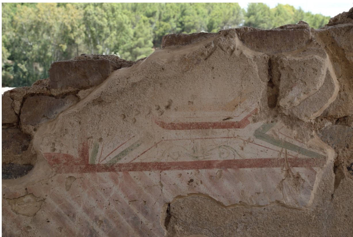
Fig. 5 - Edificio a L. Parete affrescata. La parte inferiore è decorata con fasce rosse oblique. Al di sopra fasce rosse inquadrano un pannello più piccolo con decorazione adesso scomparsa; gli spazi di risulta sono decorati con motivi vegetali.