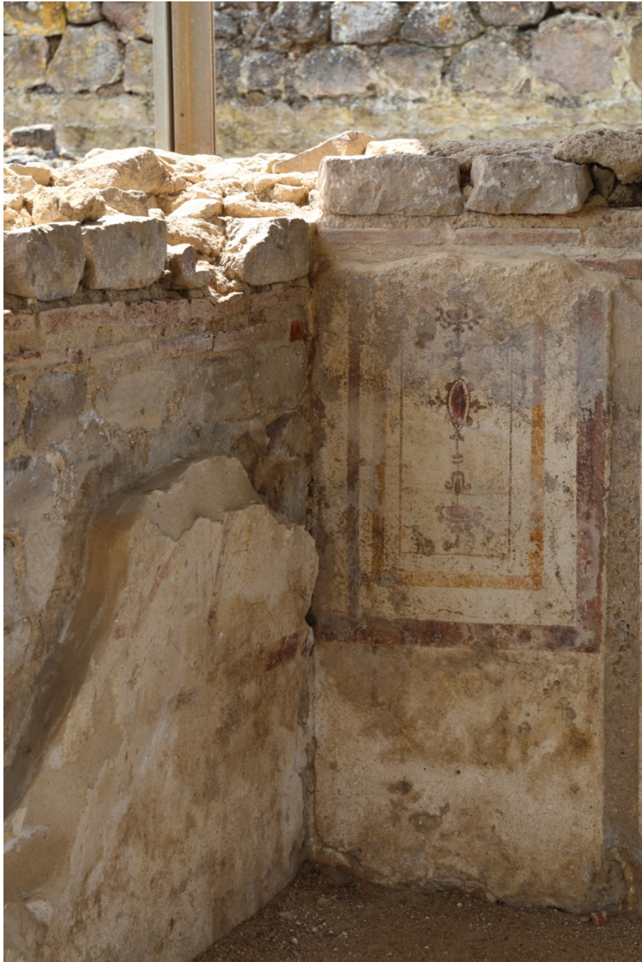
Fig. 3 - Edificio a L. Dettaglio del pannello di angolo: fasce rosse e gialle inquadrano un candelabro stilizzato; II-III sec. d.C..