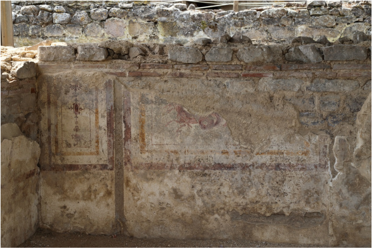
Fig. 2 - Edificio a L. Parete affrescata a pannelli: a sinistra stretto pannello con decorazione stilizzata; a destra pannello con raffigurazione di un animale marino fantastico, databile al II-III sec. d.C. (foto di Unicity S.p.A.).

In un ambiente sopra un'alta fascia lasciata bianca o decorata a strie rosse, verosimile imitazione di marmo, si trovano zone bianche riquadrate in rosso, ocra e/o verde che comprendono candelabri stilizzati (fig. 3) ed animali fantastici (fig. 4). Tali motivi sono diffusi nell'ambito della pittura romana, dapprima con forme più naturalistiche (fig. 6), poi sempre più stilizzate.