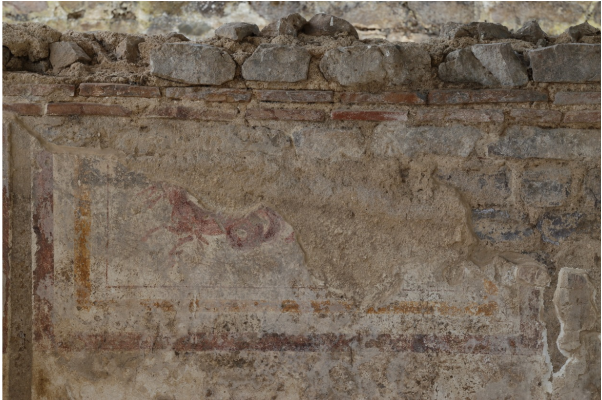
Fig. 4 - Edificio a L. Dettaglio del pannello con scena figurata. Fasce di color rosso e giallo inquadrano la figura di un animale marino fantastico, riconoscibile come un cavallo che termina con le spire di un serpente marino.