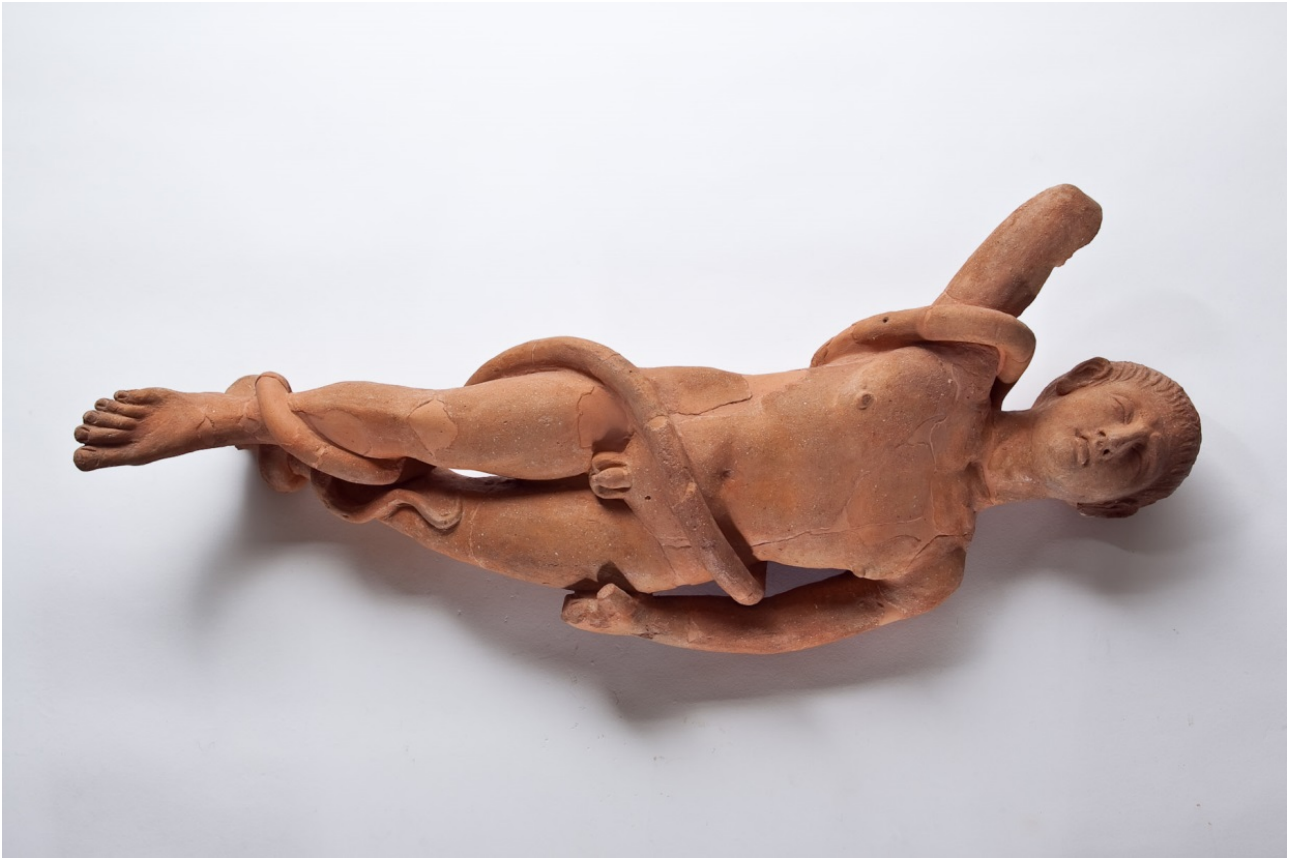
Fig. 2 - Statuetta di devoto da Nora, santuario di Esculapio. Il malato è raffigurato dormiente, avvolto nelle spire del serpente, animale sacro del dio.

Assai spesso gli ex-voto sono semplici e talora rozze statuette di terracotta, con le mani che indicano la parte del corpo per cui si invoca la guarigione (figg. 3-4).