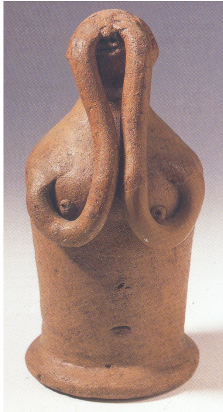
Fig. 3 - Statuetta di devoto offerente da Bithia, che indica la parte del corpo per cui invoca la guarigione (Da Bisi 1988, p. 341).