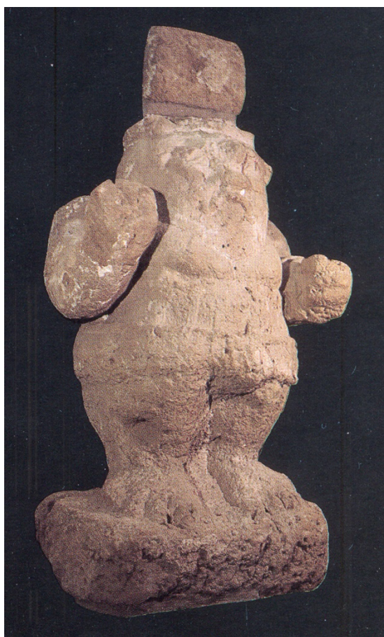
Fig. 1 - Statua di Bes da Bithia, legata ad un culto di sanatio . (da BARRECA 1986, p 137)

Il culto delle Ninfe, legato genericamente alle acque, a Fordongianus prende anche un aspetto salutare, grazie ovviamente alle proprietà curative della sorgente termale. La presenza di iscrizioni dedicate alla Ninfe e ad Esculapio, divinità della salute, corrobora l'interpretazione. Questo permette di inserire Fordongianus nel novero delle località sarde legate a culti di sanatio , cioè salutariferi, attestate già da epoca tardo-punica e repubblicana, tra il III ed il II sec. a.C.. Talora sono connesse ad ambiti termali, come a Mitza Salamu di Dolianova, talora invece sono avulse da un contesto curativo oggettivo e si configurano come semplici luoghi di culto dedicati di norma al dio Bes/Esculapio, come a Bithia (fig. 1) e Nora (fig. 2).