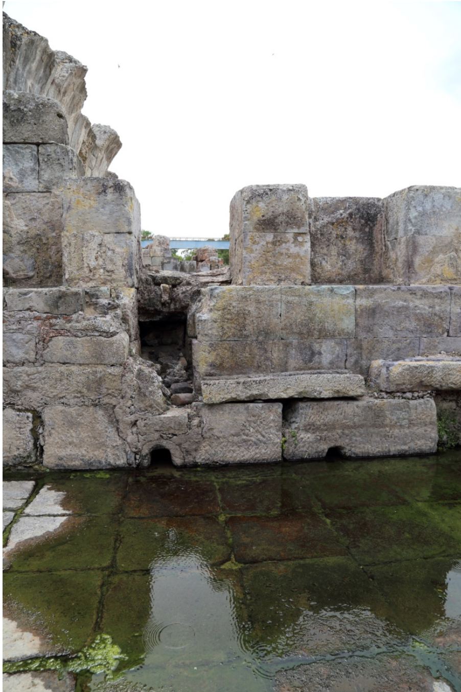
Fig. 4 - Veduta della parete occidentale del Ninfeo, con l'adduzione dell'acqua; sul fondo della parete si notano i fori per lo scolo delle acque.

Le acque affluiscono sul lato breve meridionale mediante due bocche e su quello occidentale attraverso un'apertura (fig. 4), mentre sul lato settentrionale una canaletta indirizza le acque reflue verso il fiume (fig. 5).