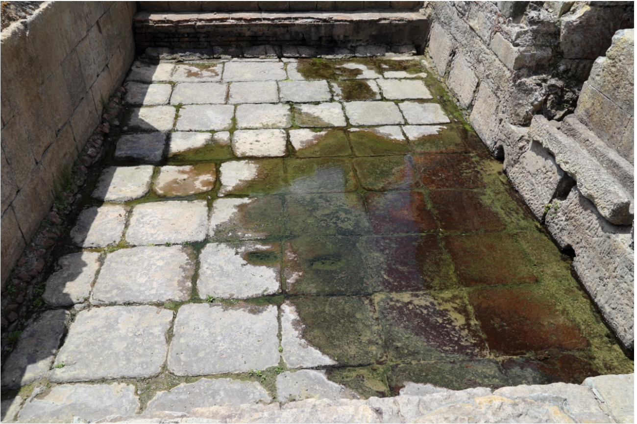
Fig. 2 - Il Ninfeo visto da Nord

Il vano si struttura con una piscina rettangolare con gradini sui due lati brevi, ornata da cinque nicchie rettangolari sul lato occidentale e sette su quello orientale. In una nicchia del lato orientale è stata rinvenuta un'iscrizione la quale consente di ipotizzare che le altre nicchie contenessero altre iscrizioni ovvero opere scultoree non pervenute fino ai nostri giorni.