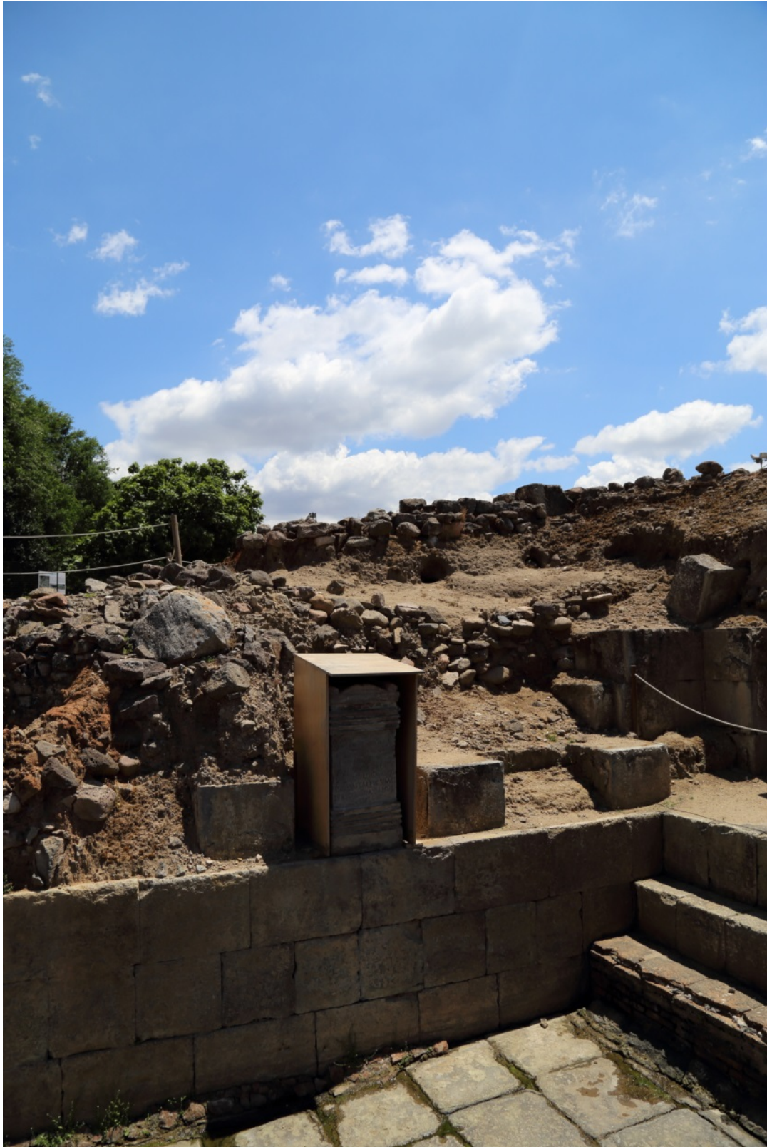
Fig. 3 - Veduta del Ninfeo con l'iscrizione ricollocata e protetta.