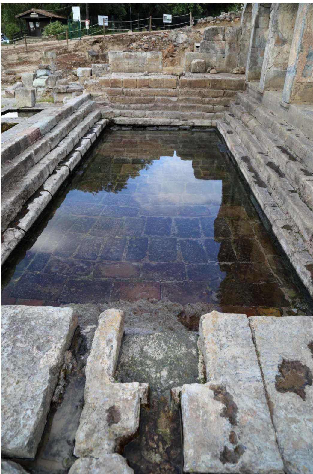
Fig. 3 - Veduta della natatio con il punto di adduzione dell'acqua.