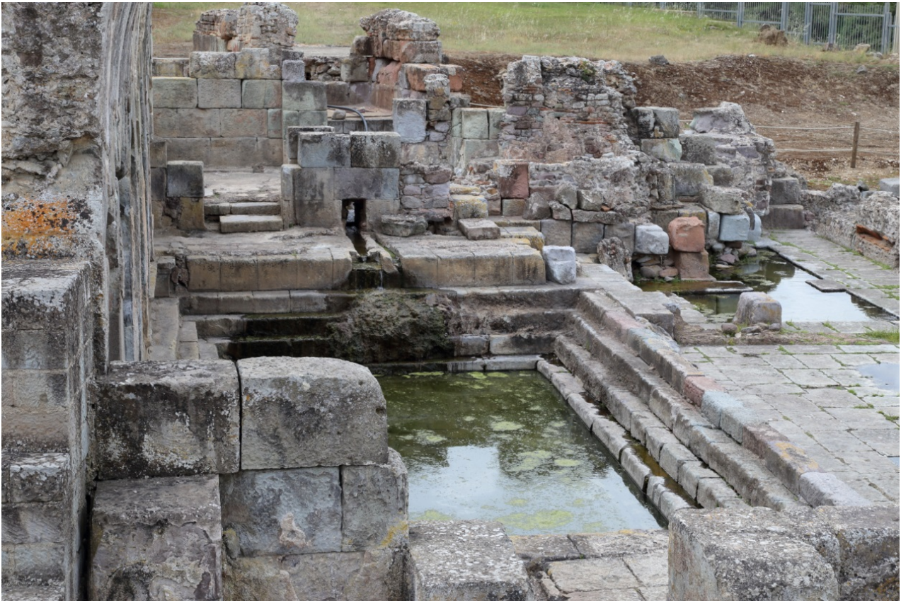
Fig. 4 - La natatio con gli ambienti di servizio sullo sfondo.

Ad occidente si trovano anche alcuni ambienti di servizio e le vasche dove avveniva la miscelazione dell'acqua (fig. 4).