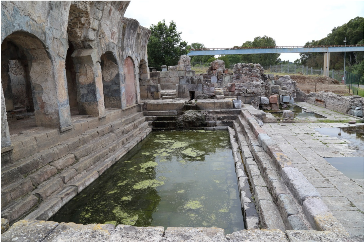
Fig. 2 - La natatio vista da Est (foto di Unicity S.p.A.).

La piscina è bordata da quattro gradini sui lati settentrionale, occidentale e meridionale, mentre il lato orientale ne presenta cinque. Nella parte alta del lato occidentale si trova l'afflusso delle acque miscelate calde e fredde, che sgorgavano un tempo da una bocca configurata a protome di animale, adesso non più presente (fig. 3).