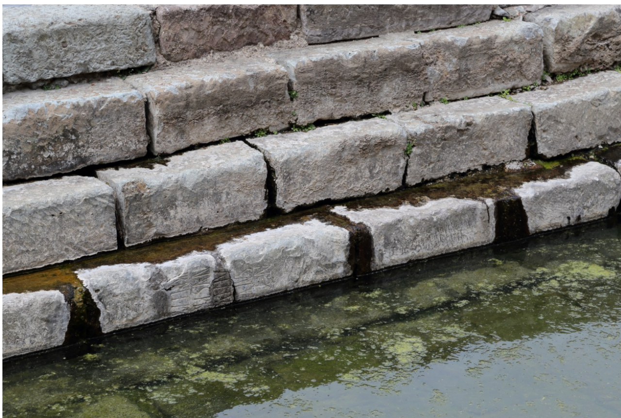
Fig. 5 - Iscrizioni riutilizzate come gradini della natatio in epoca tardo-antica.