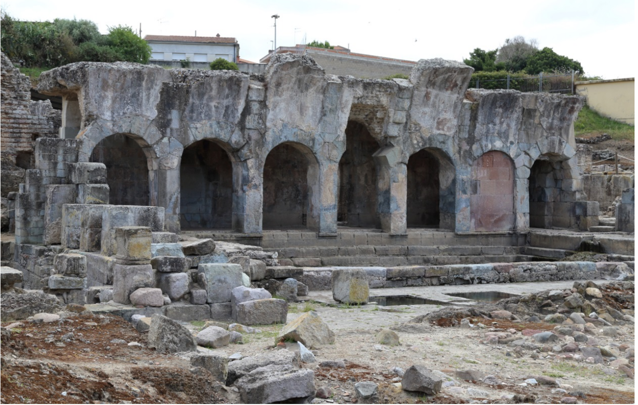
Fig. 2 - Il porticato meridionale della piscina.