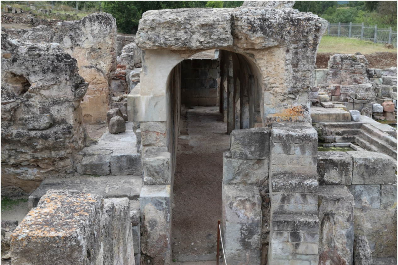
Fig. 4 - Veduta del porticato da Est.