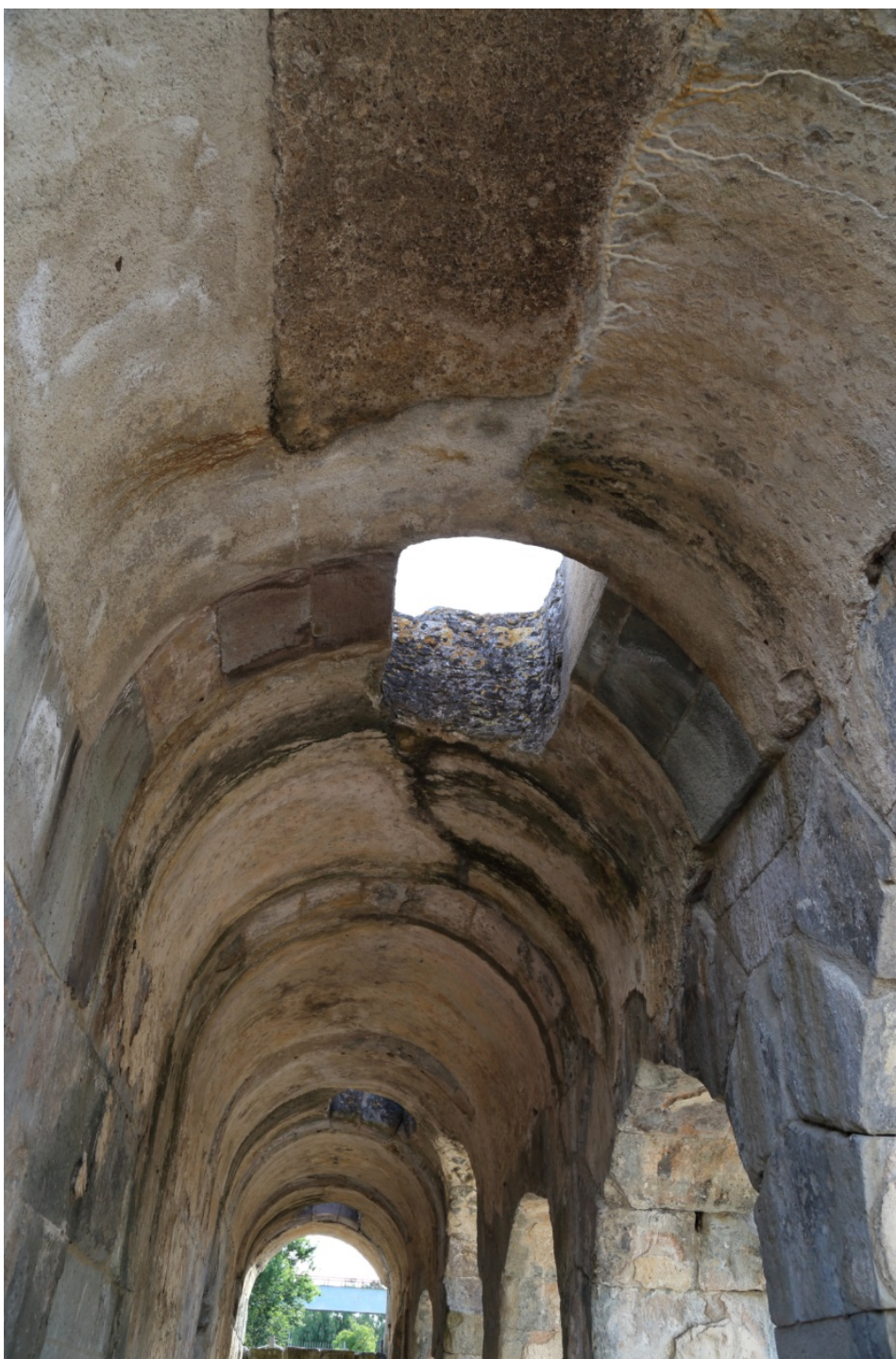
Fig. 5 - Copertura del porticato con i lucernari per l'illuminazione.