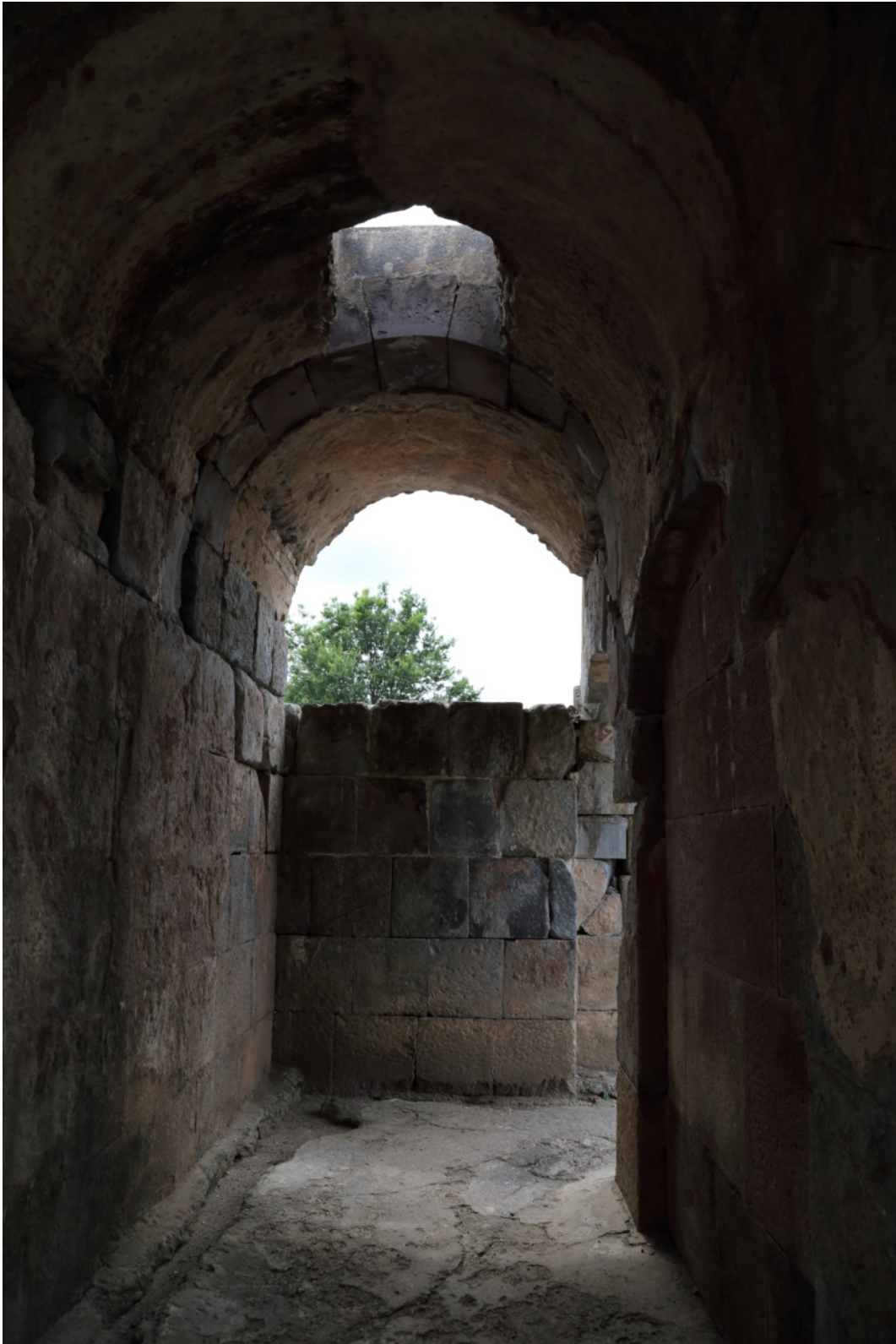
Fig. 3 - Interno del porticato meridionale.