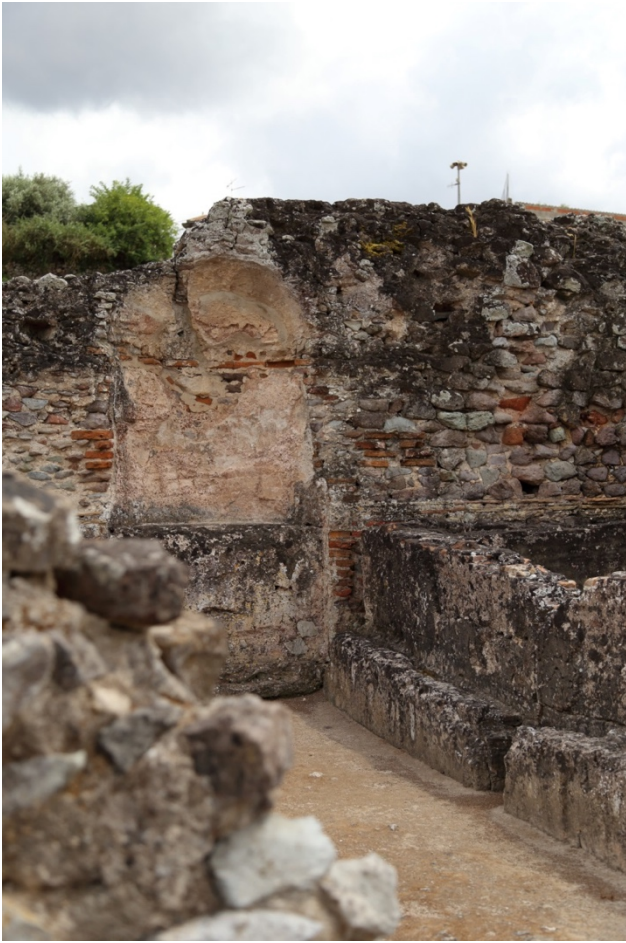
Fig. 4 - Scorcio del calidarium con la vasca e la nicchia.