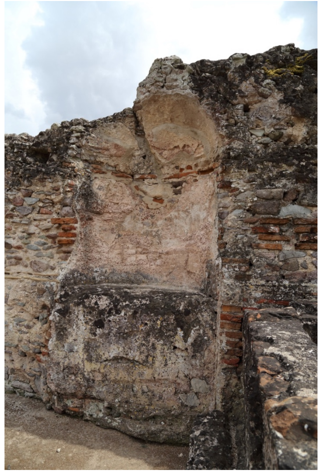
Fig. 5 - La nicchia a lato della vasca; era destinata a contenere una statua ornamentale.