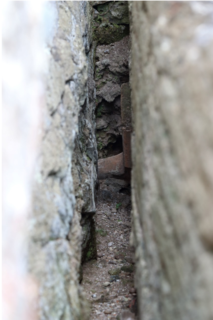
Fig. 3 - Dettaglio dell'intercapedine fra la vasca e la parete, dove correva l'aria calda.

Nella parete a fianco della vasca è ricavata una nicchia, destinata a contenere una statua ornamentale, adesso perduta (figg. 4-5).