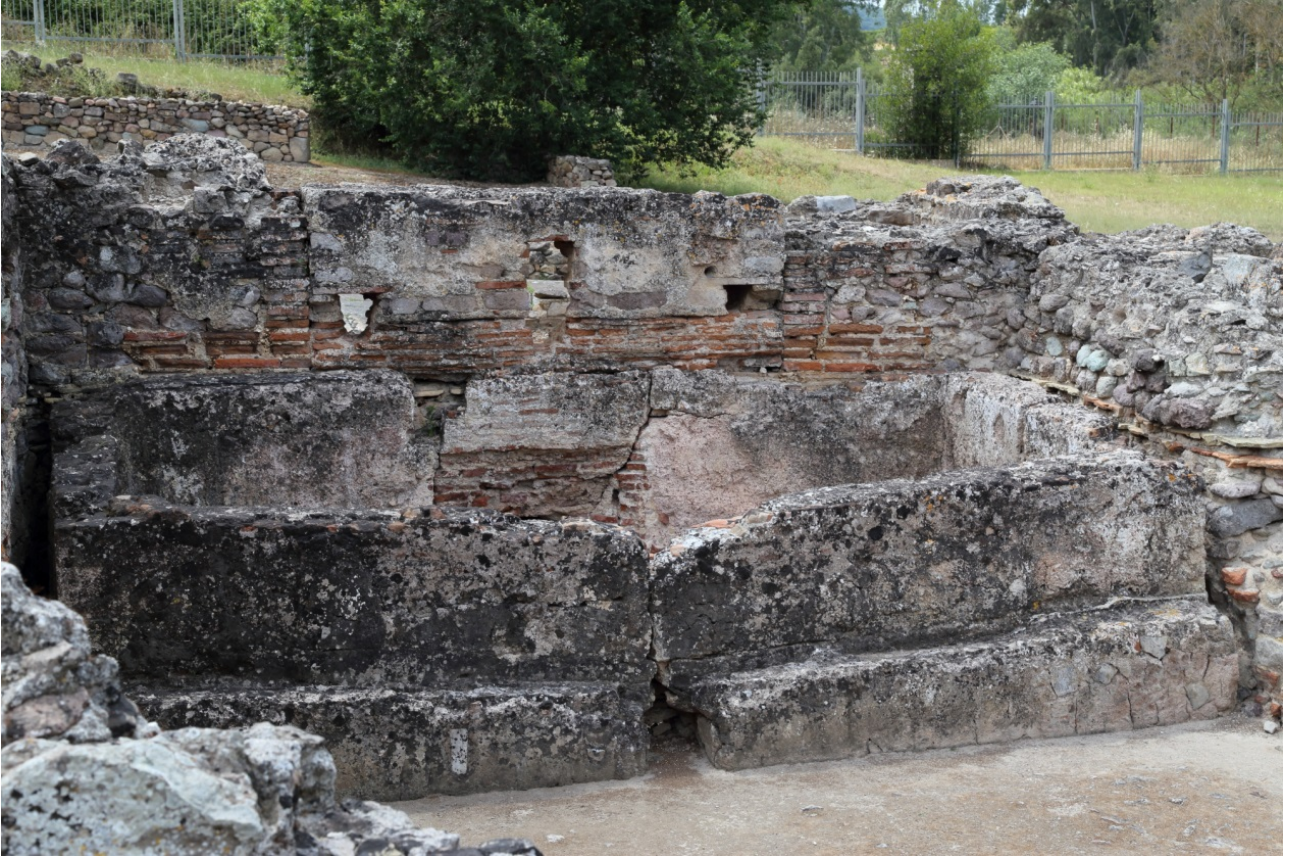
Fig. 2 - Vasca del calidarium.

Il calidarium delle Terme di Fordongianus è mal conservato, ma è identificabile per la presenza di una vasca rettangolare (fig. 2), in cui si trovava acqua tiepida per rinfrescarsi, ai lati della quale si individuano i resti delle tegole dell'intercapedine (fig. 3).