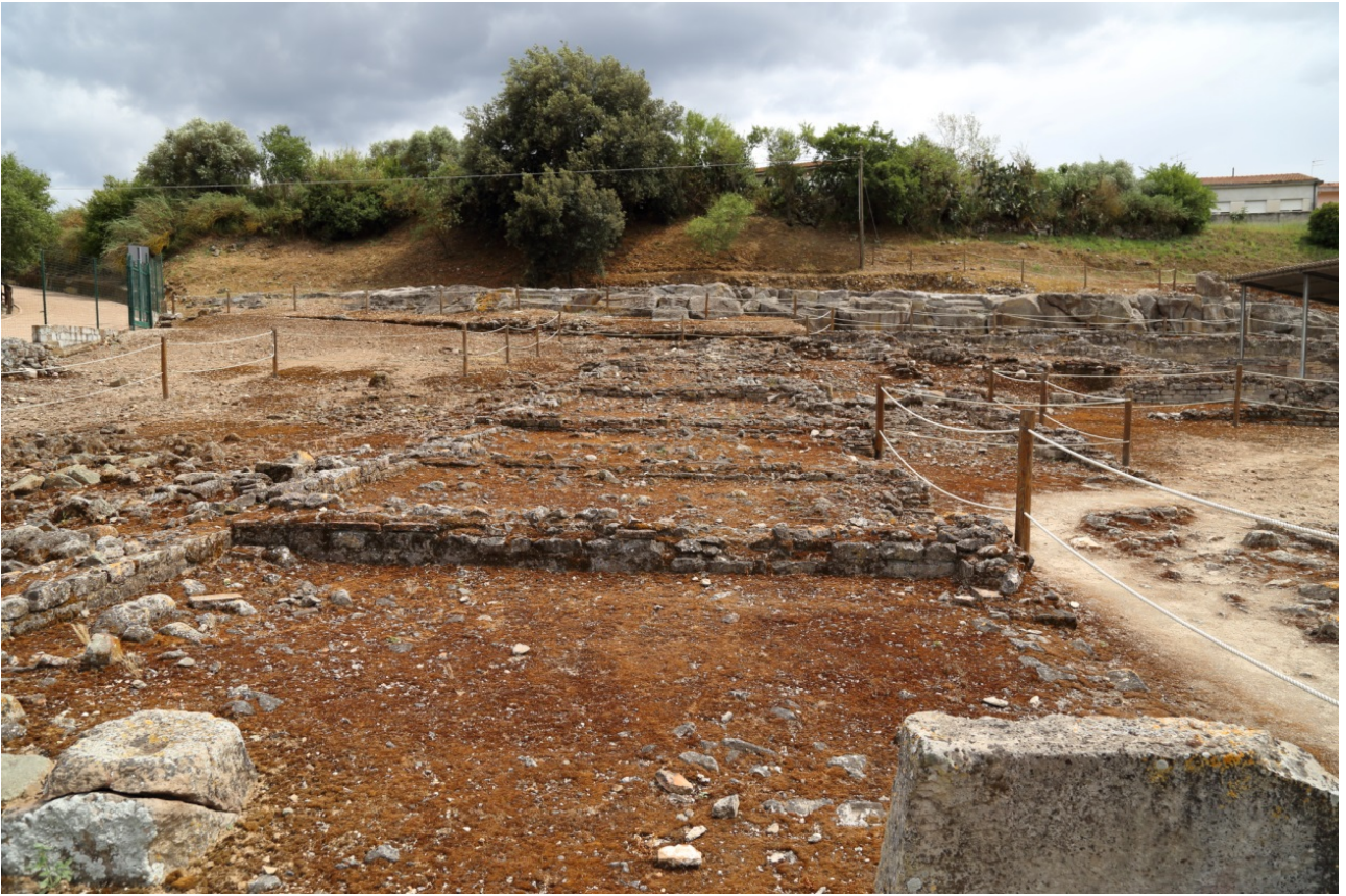
Fig. 3 - Veduta degli ambienti adiacenti la palestra