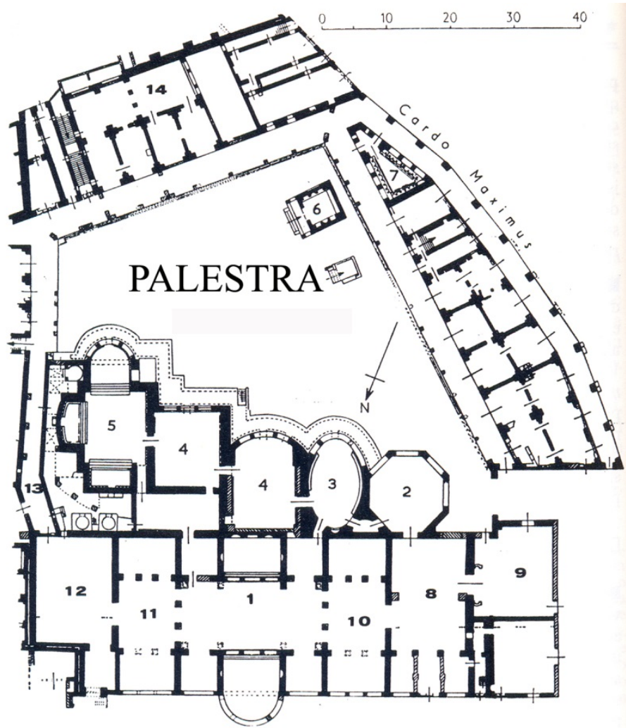
Fig. 5 - Ostia, Terme del Foro (II sec. d.C.), con evidenziata la posizione della palestra (da PAVOLINI 1983).