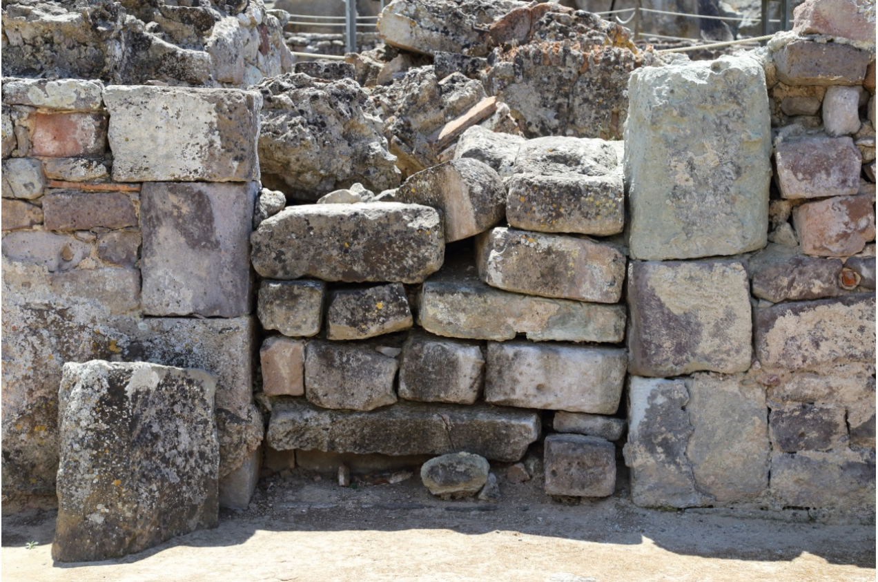
Fig. 2 - Ingresso alle terme dal cortile

Questo ambiente, la cui ampiezza ed il modesto spessore delle fondazioni fanno ritenere a cielo aperto, viene riconosciuto come un cortile di accesso alle Terme, considerato che vi si apre un grande ingresso al frigidarium (fig. 2), e, nel contempo, riveste la funzione di punto di passaggio ad un altro spazio aperto posto ad oriente (fig. 1, in azzurro).