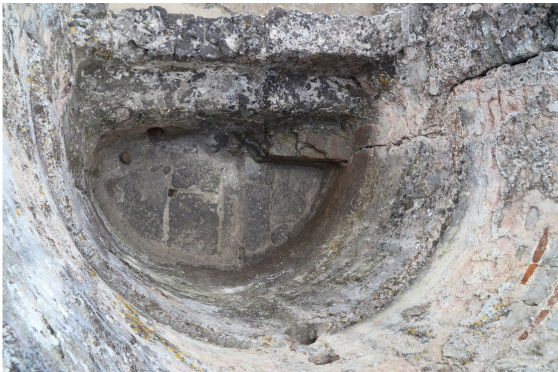
Fig. 4 - Dettaglio della vasca con i gradini di accesso.