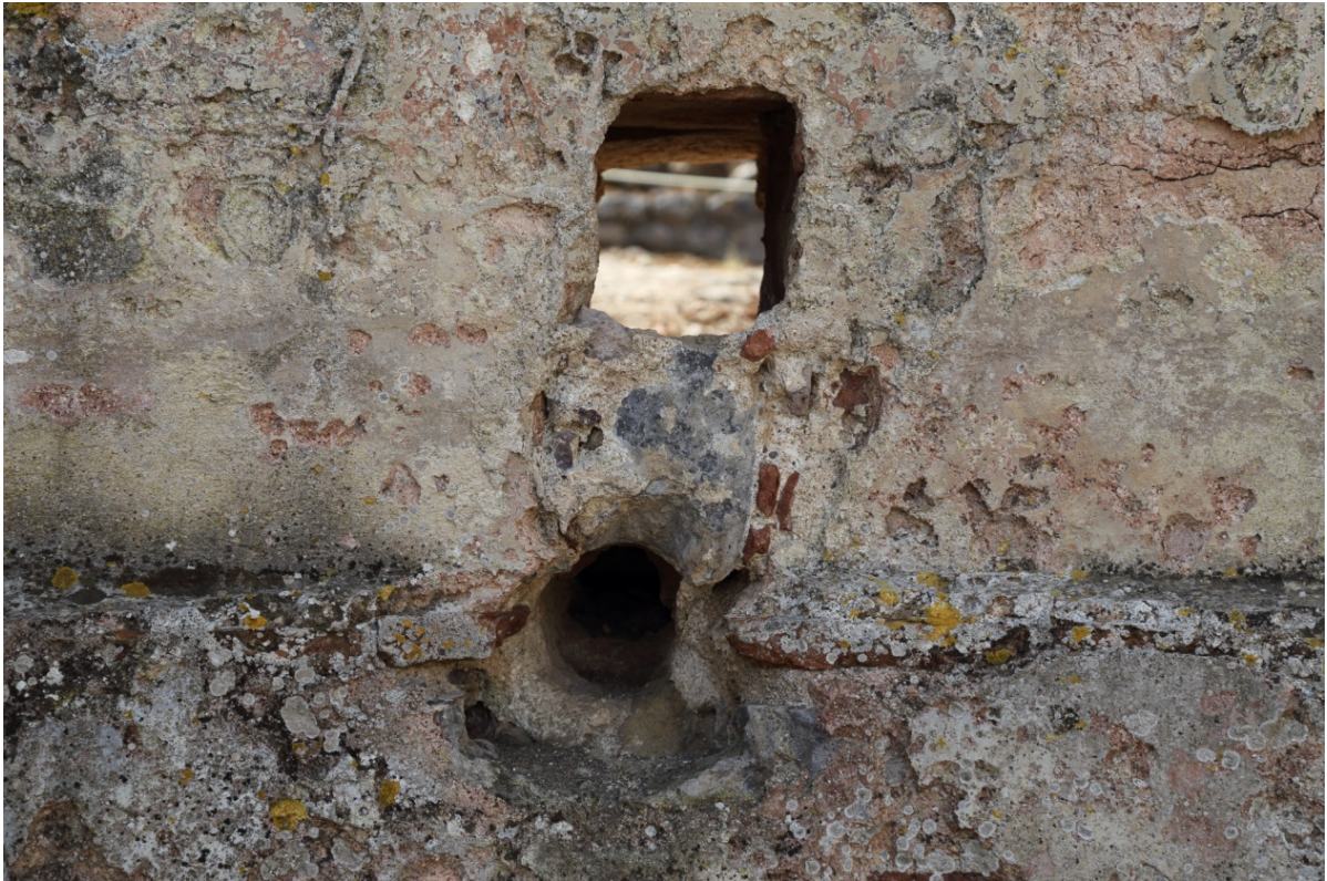
Fig. 5 - Dettaglio dei fori nella muratura dove passavano le canalizzazioni per l'acqua.