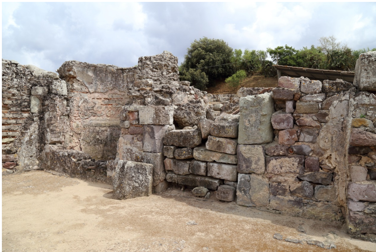
Fig. 2 - Ingresso al frigidarium.

Il frigidarium delle terme di Fordongianus, situato nella zona indicata come Terme II (fig. 1, ambiente I), realizzato nella seconda fase dell'edificio, costituisce anche il vano di ingresso, come indica la grande porta che fu occlusa in epoca tardoantica (fig. 2). L'ambiente è appunto contraddistinto da due vasche, l'una rettangolare, l'altra semicircolare (figg. 2-4), entrambe di non grandi dimensioni.