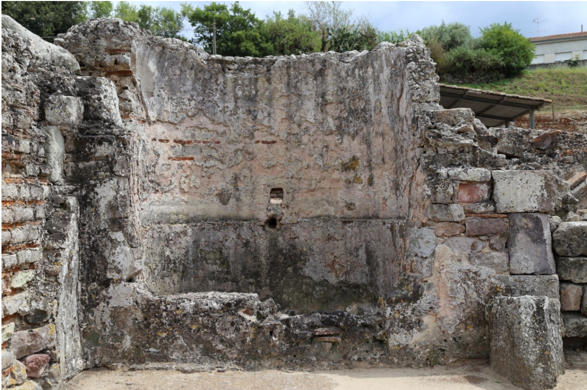
Fig. 3 - Vasca semicircolare per immersione (foto di Unicity S.p.A.).