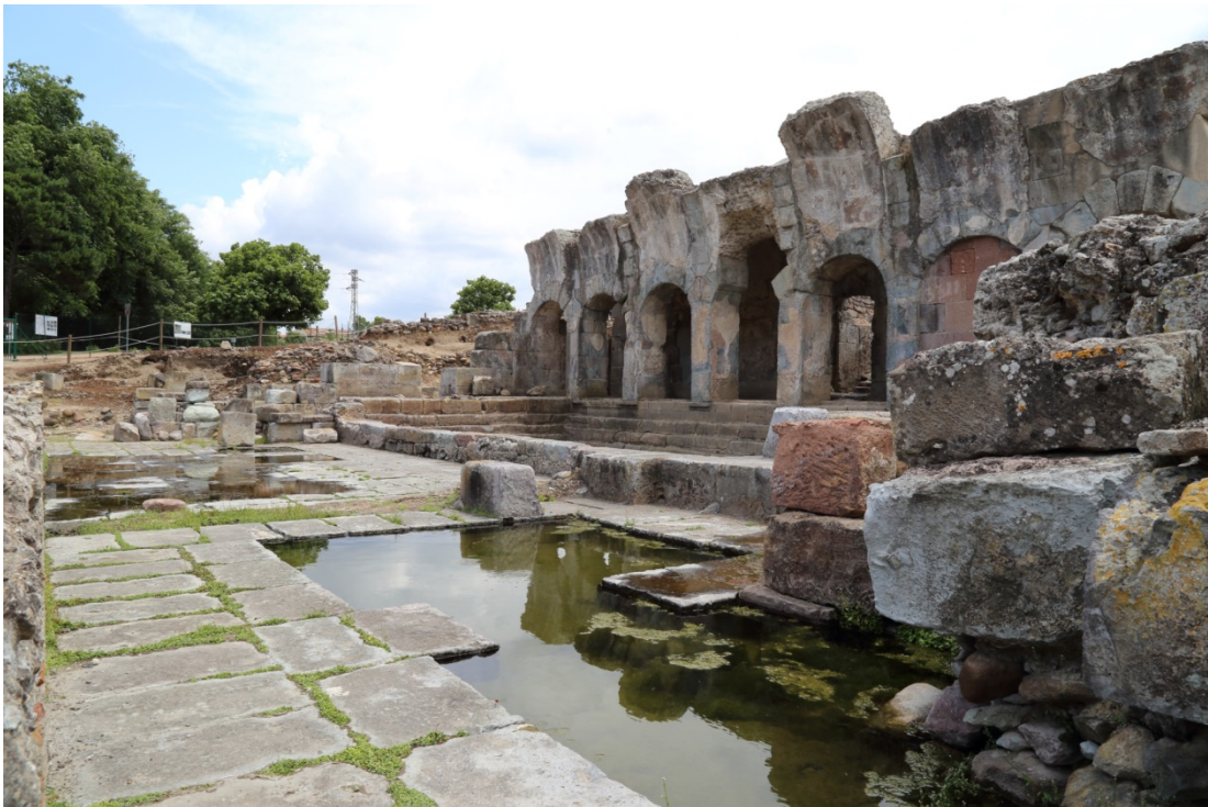
Fig. 4 - La natatio vista dagli ambienti di servizio settentrionali.