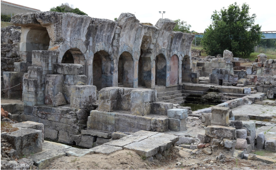
Fig. 3 - Il nucleo delle Terme I: la natatio e in primo piano il Ninfeo