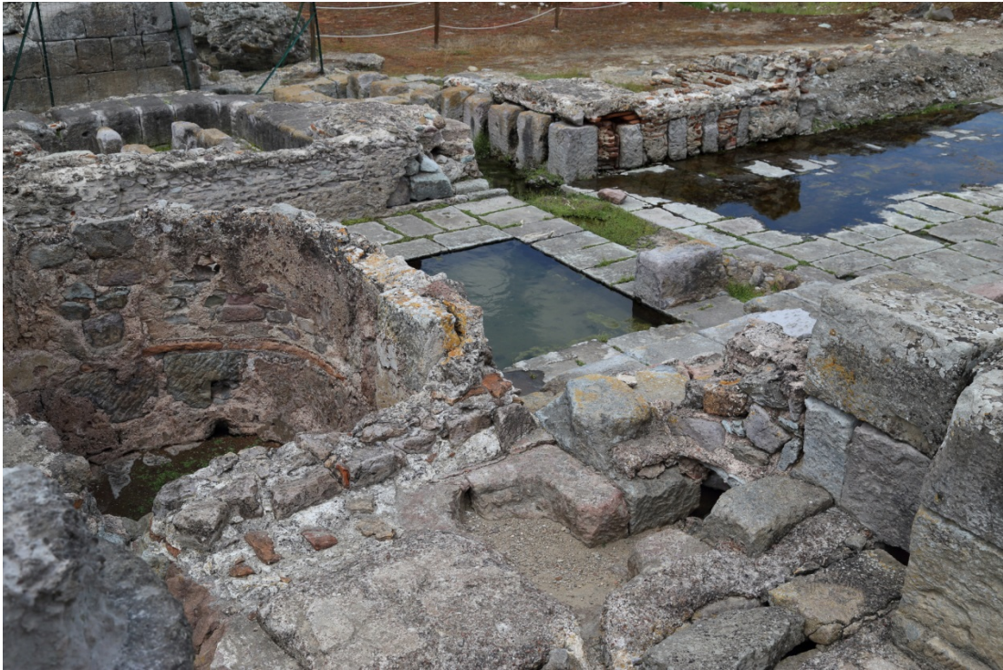
Fig. 5 - Gli ambienti di servizio delle Terme I

Sui lati settentrionale e meridionale la piscina aveva due corridoi porticati, mentre sul lato occidentale si trovavano cisterne ed ambienti di servizio (fig. 5).