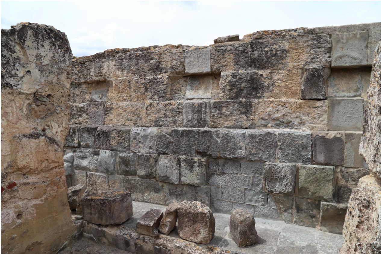
Fig. 2 - La possente struttura in opus quadratum delle Terme I

Le terme traggono la loro prima origine dalla presenza di una falda acquifera naturalmente calda e ricca di proprietà curative, che giustificano le numerose dediche alle Ninfe ed al dio Esculapio. Il cuore dell'edificio è la grande piscina ( natatio , figg. 3-4) in cui l'acqua termale a 54 °C veniva stemperata con acqua fredda.