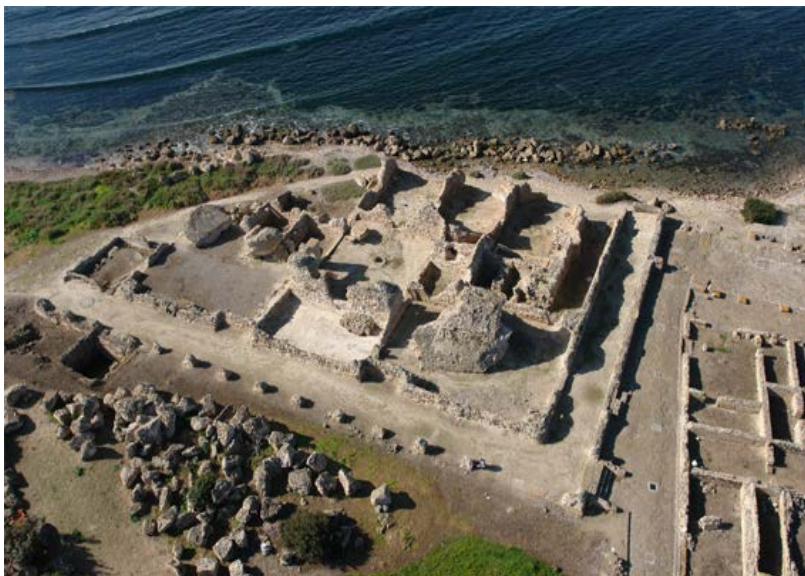
Fig. 3 - Nora, Terme a Mare.