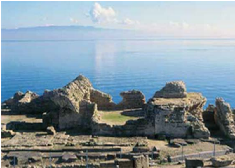
Fig. 4 - Tharros, Terme di Convento Vecchio (da ACQUARO-FINZI 2004, p. 55).