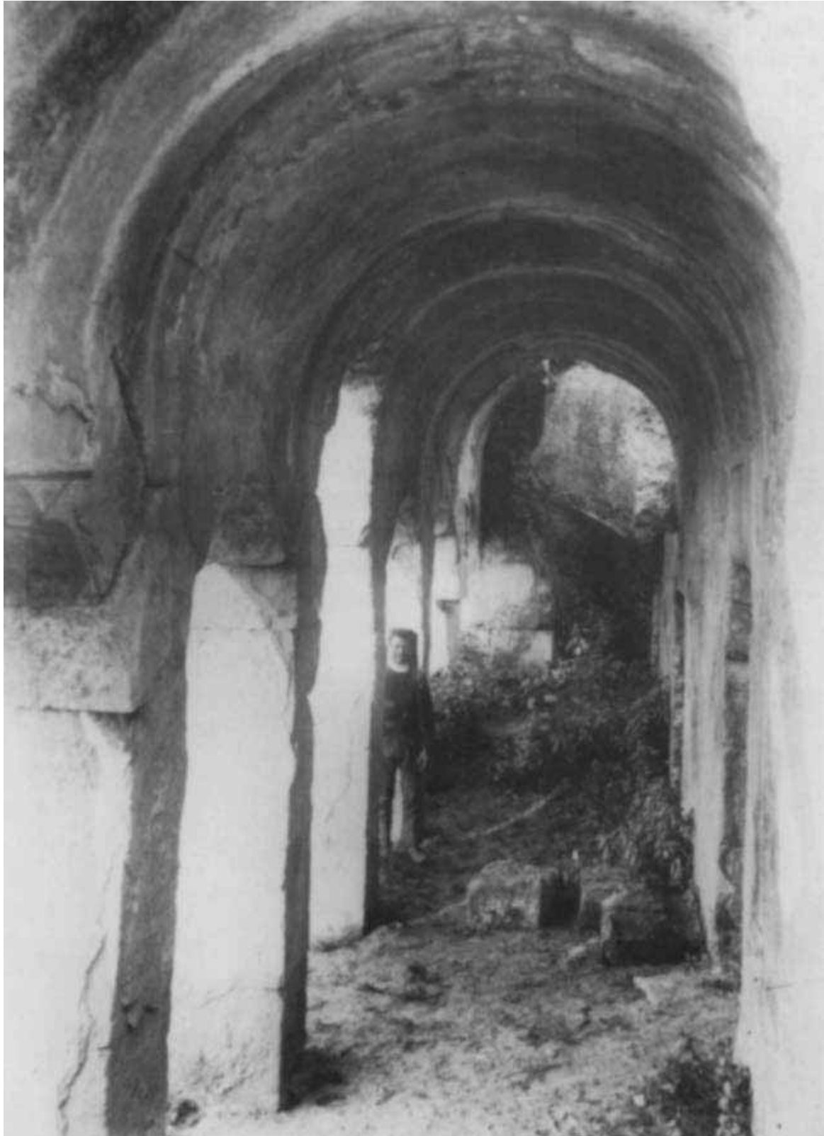
Fig. 4 - Interno del porticato messo in luce negli scavi del 1899 (da TARAMELLI 1903).