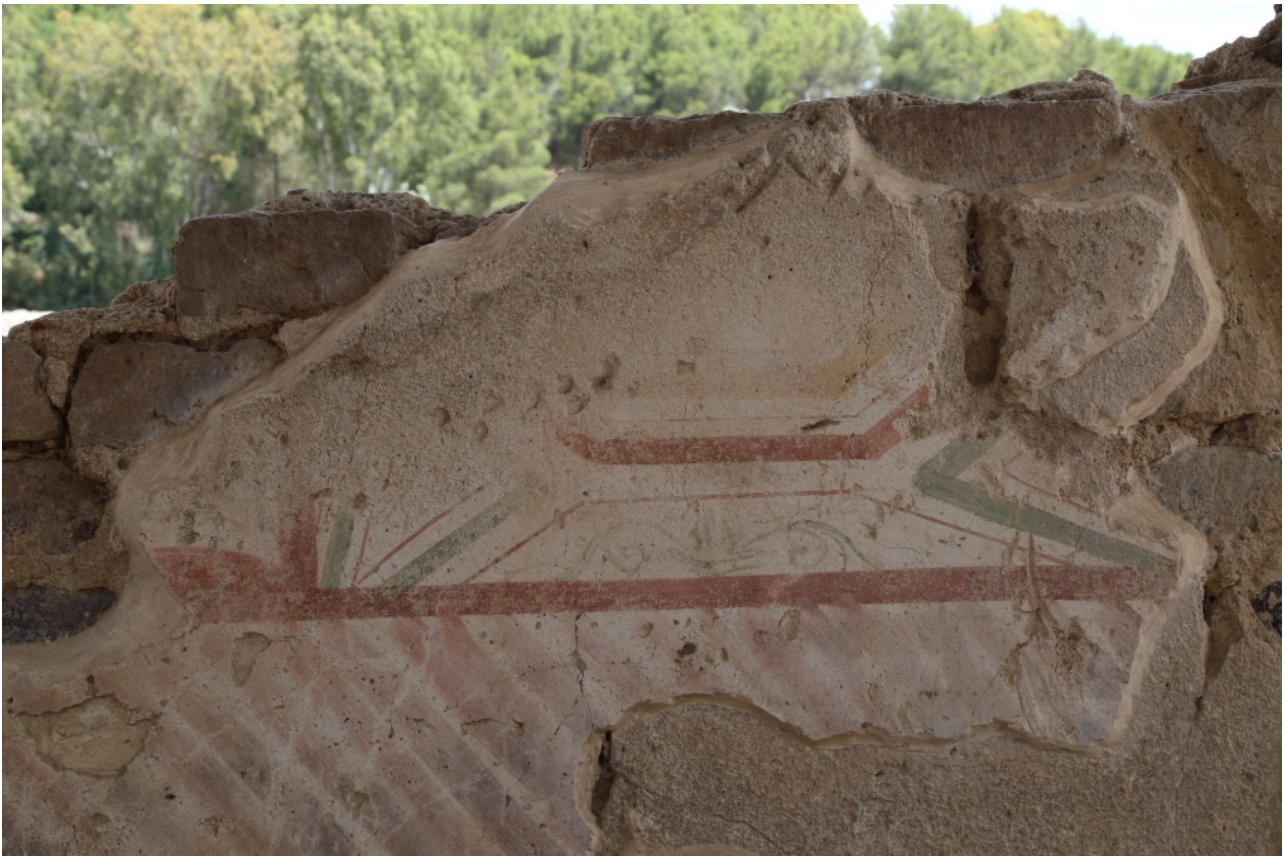
Fig. 6 - Parete decorata di un vano scavato nel 1980.