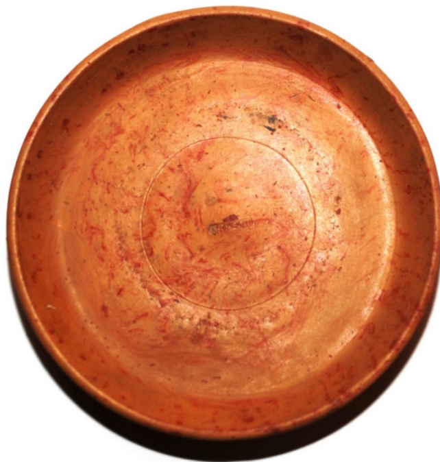
Fig. 4 - Piatto in sigillata sud-gallica marmorizzata (Oristano, Antiquarium Arboreense )