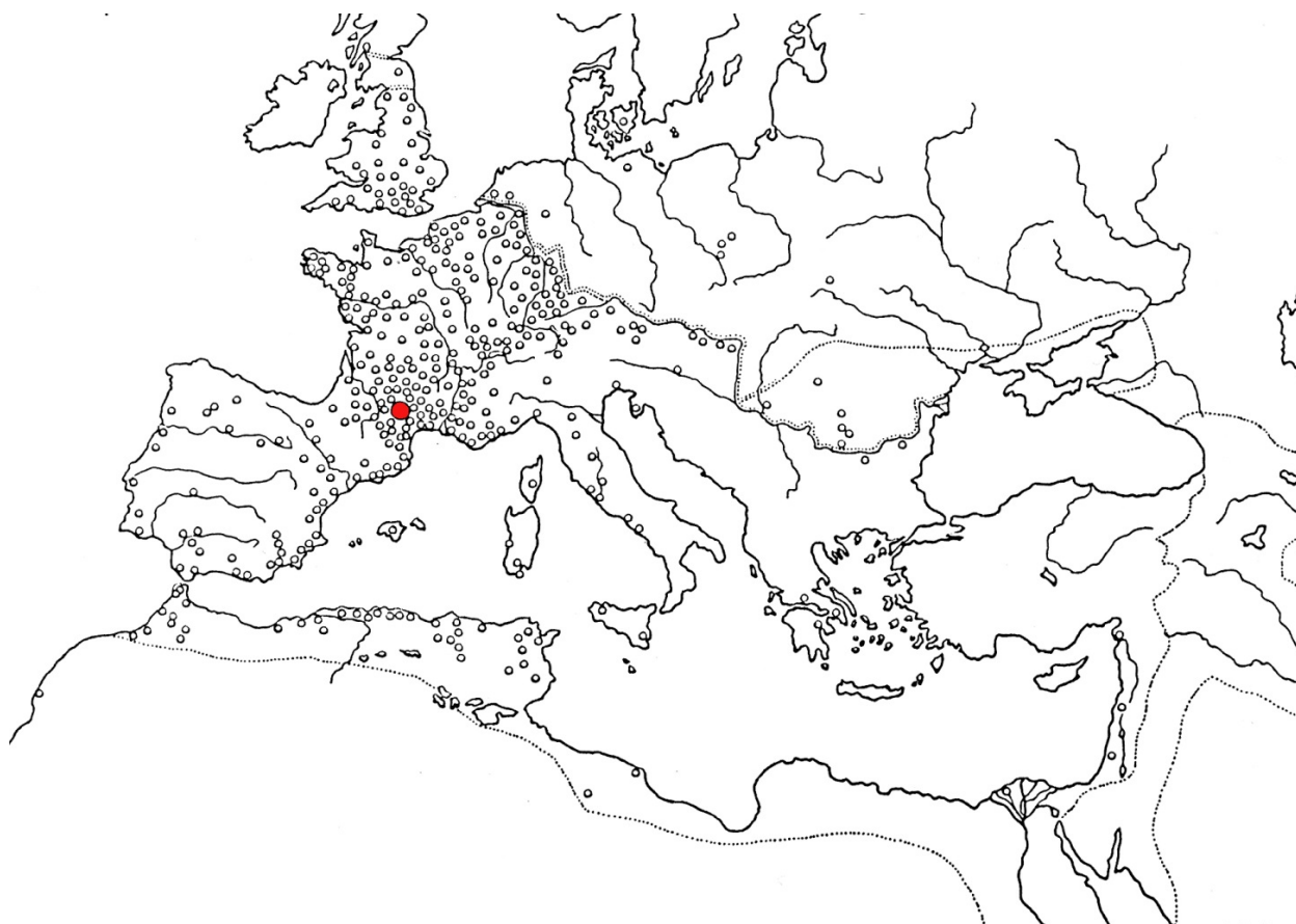
Fig. 1 - La diffusione dei prodotti delle officine di La Graufesenque (indicata in rosso) (da BEMONT, JACOB 1986, p. 102)

Queste manifatture operavano in particolar modo per il mercato dell'Europa continentale, e solo i prodotti del gruppo di La Graufesenque, nei pressi dell'attuale cittadina di Milau ebbero una significativa diffusione anche a livello Mediterraneo (fig. 1).