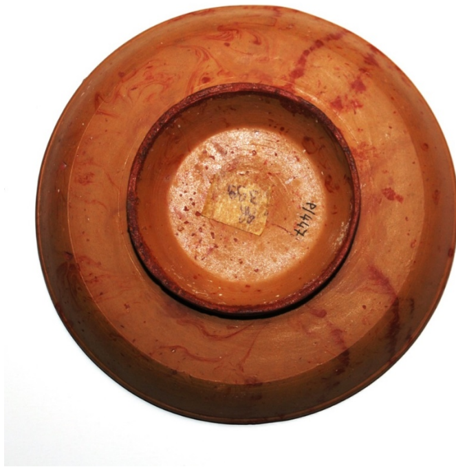
Fig. 3 - Piatto in sigillata sud-gallica marmorizzata (Oristano, Antiquarium Arboreense )