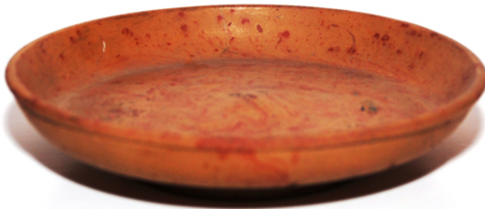
Fig. 2 - Piatto in sigillata sud-gallica marmorizzata (Oristano, Antiquarium Arborensis )

Il piatto, che proviene verosimilmente da una tomba considerato l'eccellente stato di conservazione (figg. 2-4) è un ottimo esempio di vaso marmorizzato. La forma è semplice e funzionale, con un basso piede, una breve parete obliqua, e la vasca piatta che si rialza internamente al centro, dove è applicato il bollo del fabbricante, illeggibile.