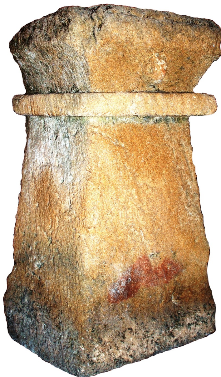
Fig. 3 - Cippo in arenaria dal tofet di Tharros (Oristano, Antiquarium Arborense )

I cippi di grandi dimensioni sono una caratteristica del tofet di Tharros, sia semplici come questo esemplare, che arricchiti di altri elementi nella parte più alta. In Sardegna Tharros è l'unica località che li ha restituiti, e trova confronti all'esterno con Mozia e Cartagine (fig. 4).