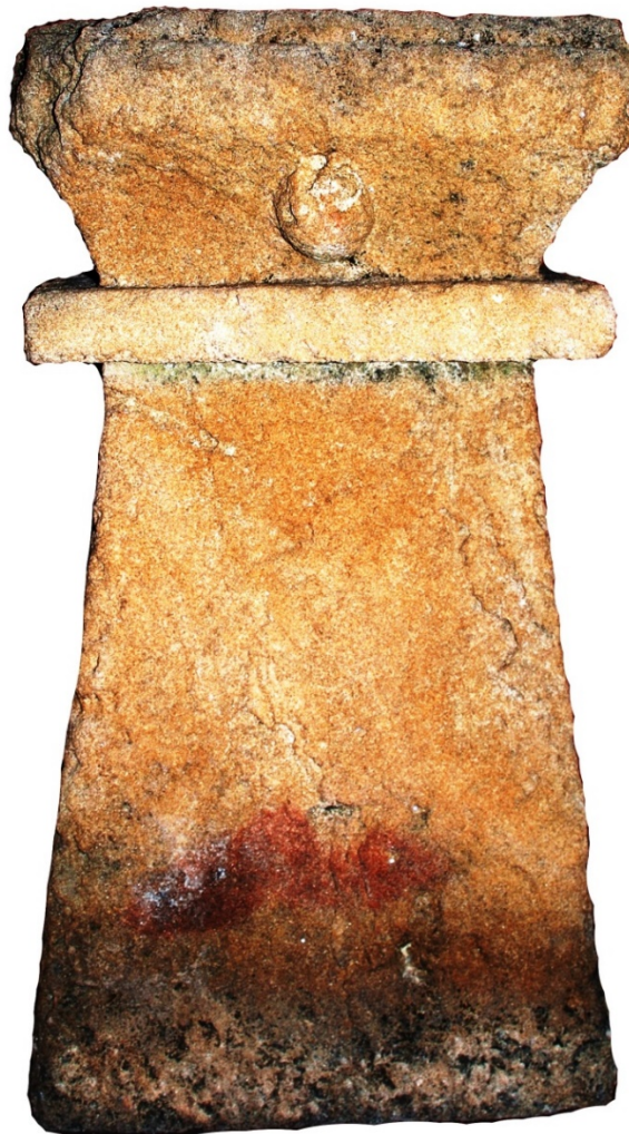
Fig. 1 - Cippo in arenaria dal tofet di Tharros (Oristano, Antiquarium Arboreense )

La scultura raffigura un cippo quadrangolare con la parte inferiore rastremata verso l'alto, che va ad incontrare una cornice marcatamente sporgente e ben definita, che definisce il coronamento superiore (figg. 1-3) . Questo ha un andamento inverso, formando una sorta di gola egizia, sulla quale viene rappresentato a rilievo il globo solare. Sulla parte inferiore il cippo presenta tracce di pittura rossa.