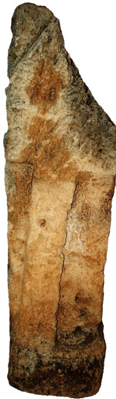
Fig. 3 – Stele punica con betilo del V-IV sec. a.C. (Oristano, Antiquarium Arboreense )