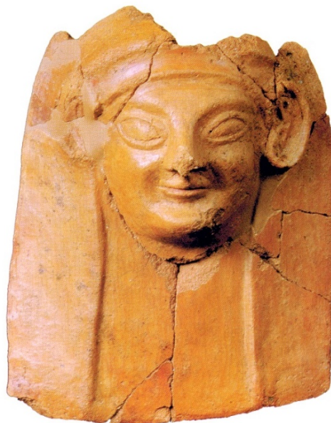
Fig. 4 - Maschera femminile proveniente dalla tomba 12 AR di Sulci, della fine del VI-inizi V sec. a.C. (da TRONCHETTI 1997a, p. 114)

Lo scavo di una tomba a camera di Sulci (Sant'Antioco) datata tra la fine del VI e gli inizi del V sec. a.C. ha permesso di individuare la posizione di queste maschere nelle sepolture, deposte sopra la bara lignea che conteneva il defunto (fig. 4).