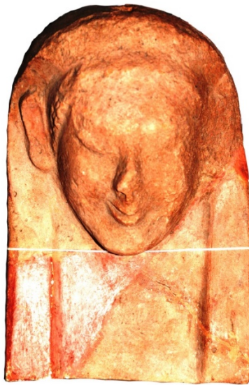
Fig. 3 - Maschera femminile da Tharros, con lineamenti e dettagli schematizzati (Oristano, Antiquarium Arborense)

Lo scavo di una tomba a camera di Sulci (Sant'Antioco) datata tra la fine del VI e gli inizi del V sec. a.C. ha permesso di individuare la posizione di queste maschere nelle sepolture, deposte sopra la bara lignea che conteneva il defunto (fig. 4).