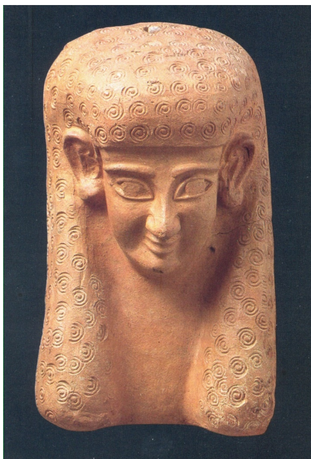
Fig. 1 - Maschera femminile in terracotta definita "Tanit Gouin"

La cosiddetta Tanit Gouin, dal nome del collezionista che la possedeva, proviene verosimilmente dalla necropoli meridionale di Tharros, ed è uno degli esemplari meglio conservati (fig. 1).