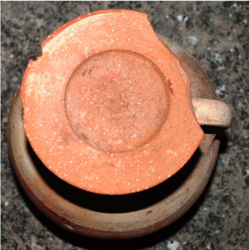
Fig. 5 - Il piattino ombelicato che copriva la bocca dell'urna (Oristano, Antiquarium Arborense )

La brocca, utilizzata come urna, veniva coperta, di solito con un piattino ombelicato (fig. 5)