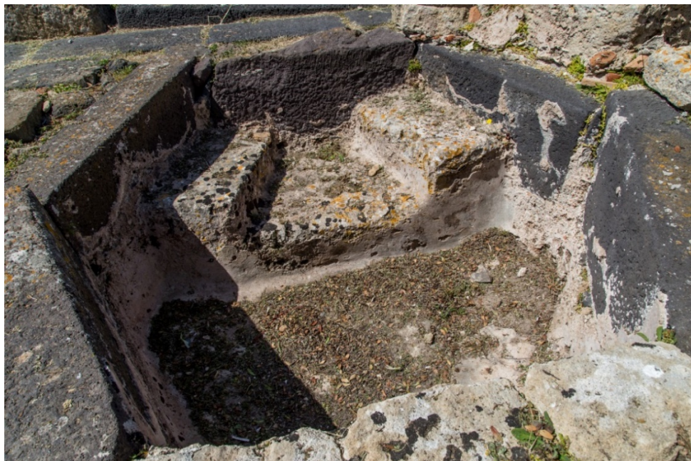
Fig. 5 - Dettaglio della seduta della vasca battesimale

All'interno della vasca rimane la seduta per il battezzando, costruita in opera cementizia (fig. 5)