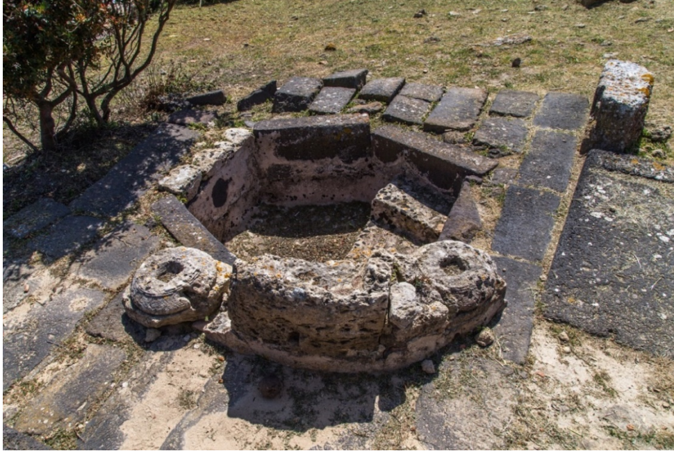
Fig. 4 - I resti del baldacchino del battistero

La vasca doveva essere coperta da un baldacchino, come mostrano le imposte di due colonne sul lato settentrionale (fig. 4).