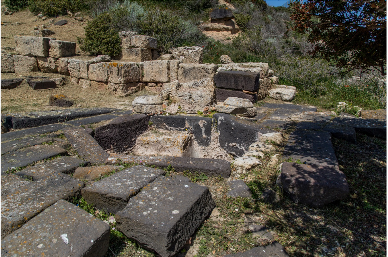
Fig. 6 - Dettaglio della pavimentazione del vano battesimale

La pavimentazione della piccola aula battesimale e la struttura della vasca sono edificate con lastre di basalto assai simili a quelle del lastricato stradale, e, con ogni evidenza, provengono dallo spoglio di un tratto di strada non più in uso (fig. 6).