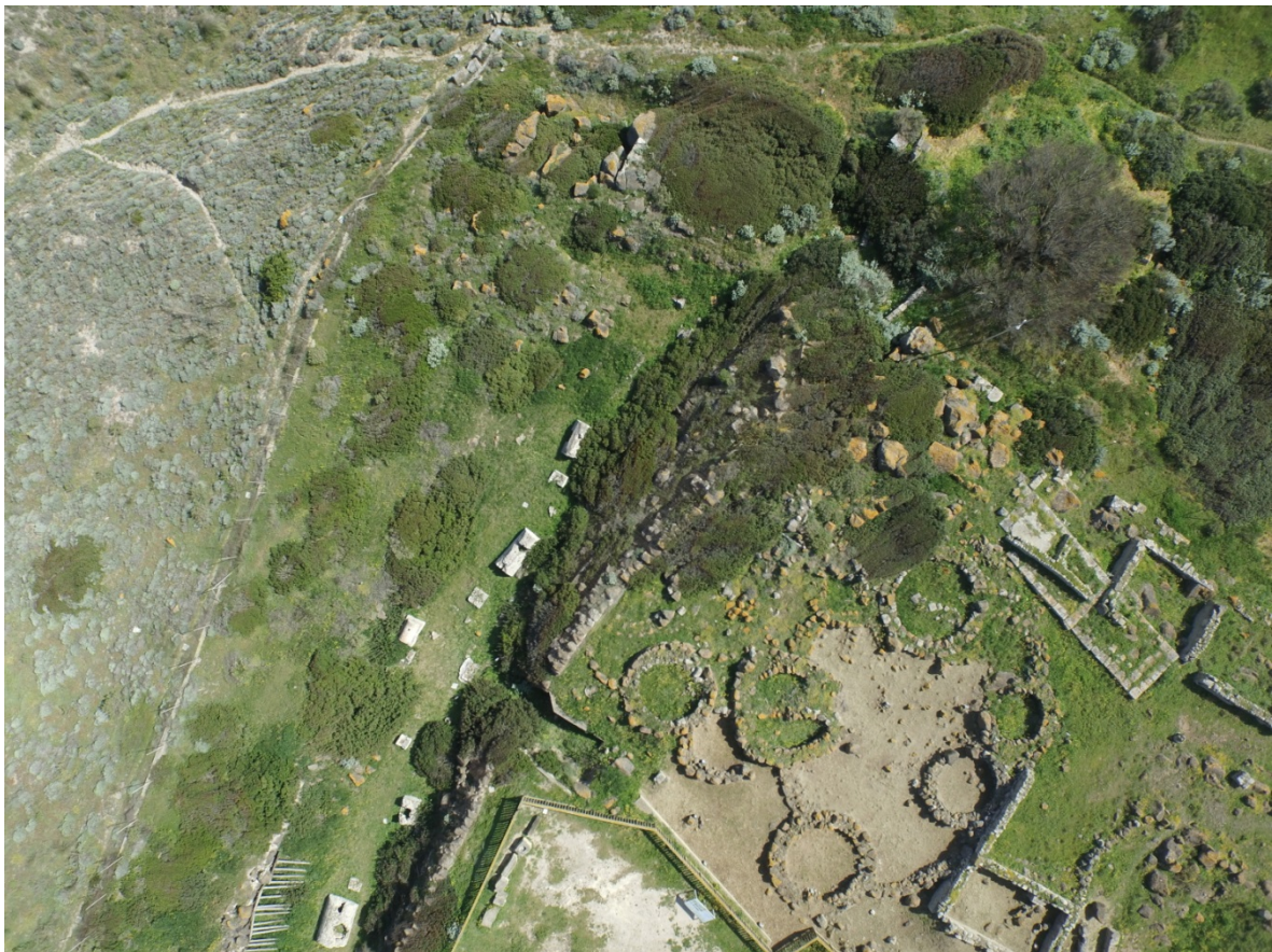
Fig. 1 - La necropoli nel fossato di Su Muru Mannu

All'interno del fossato parzialmente colmato verso il 50 a.C., sul colle di Su Muru Mannu, prese posto una piccola necropoli di prima età imperiale (fig. 1).