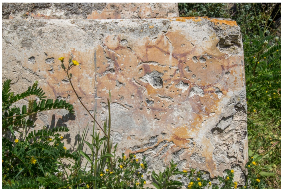
Fig. 7 - La decorazione dipinta a crusta marmorea

Talvolta queste tombe erano decorate con una pittura che imitava le crustae marmoree (fig. 7); in taluni casi di fronte alla tomba si trova la mensa dove veniva tenuto un simbolico pasto sacro in onore del defunto (fig. 8).