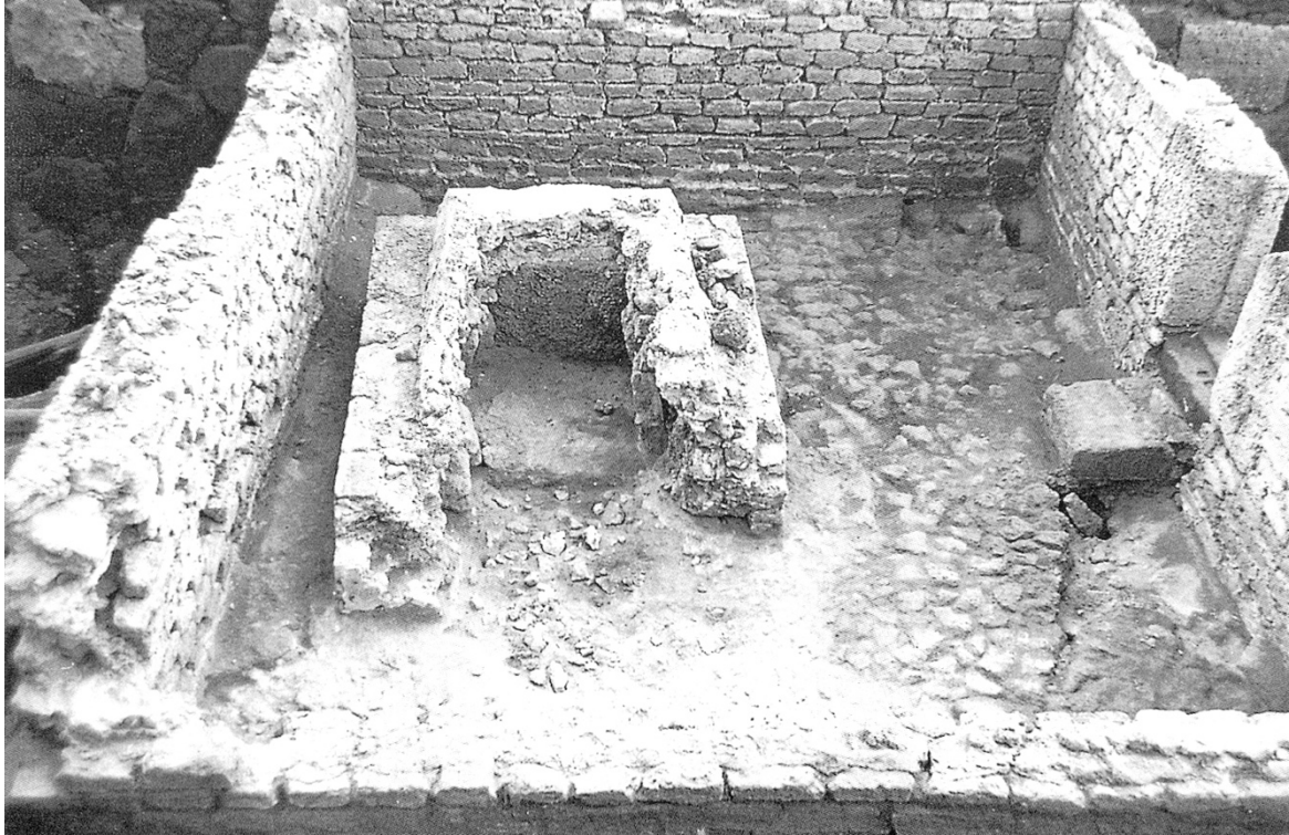
Fig. 2 - Il piccolo mausoleo nel fossato

L'elemento maggiormente vistoso di questa area cimiteriale era un piccolo mausoleo composto da un recinto in blocchetti e pavimentato in pietre non lavorate, nel quale si trovava una tomba a cupa già violata, che sovrastava un modesto sarcofago in pietra. Il piccolo monumento si data nei decenni finali del I sec. d.C. (figg. 2-3).