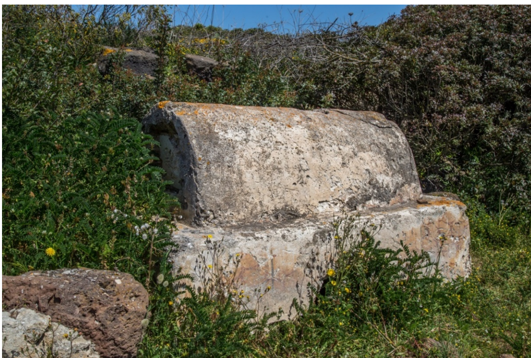
Fig. 6 - Tomba a cupa del fossato di Tharros

Talvolta queste tombe erano decorate con una pittura che imitava le crustae marmoree (fig. 7); in taluni casi di fronte alla tomba si trova la mensa dove veniva tenuto un simbolico pasto sacro in onore del defunto (fig. 8).