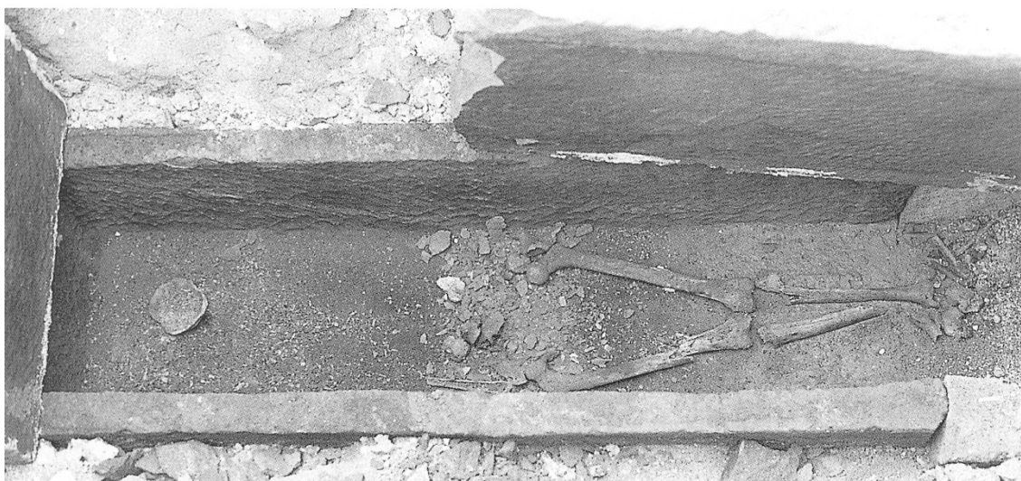
Fig. 3 - Il sarcofago con i resti del defunto