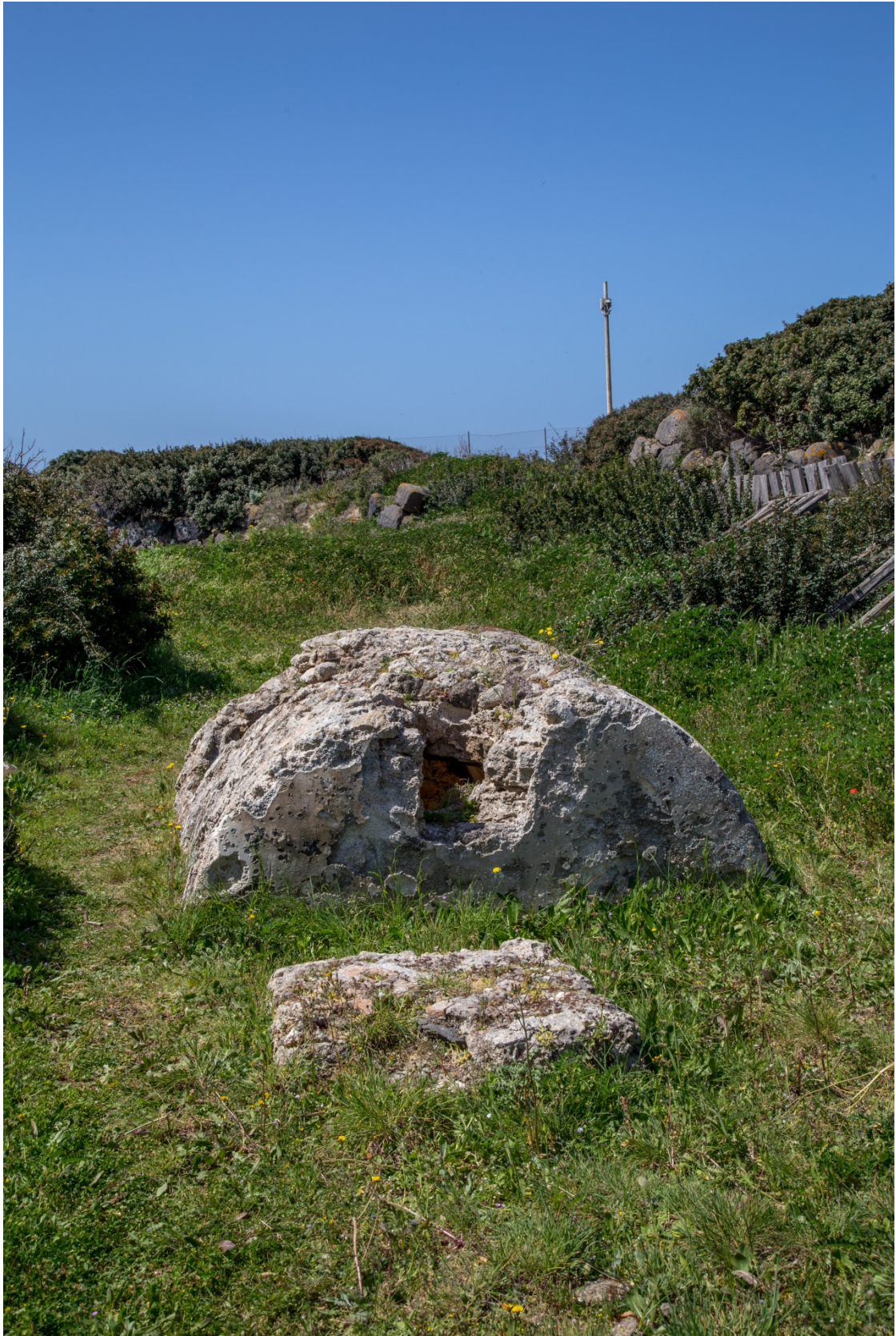
Fig. 8 - Tomba a cupa con di fronte la mensa