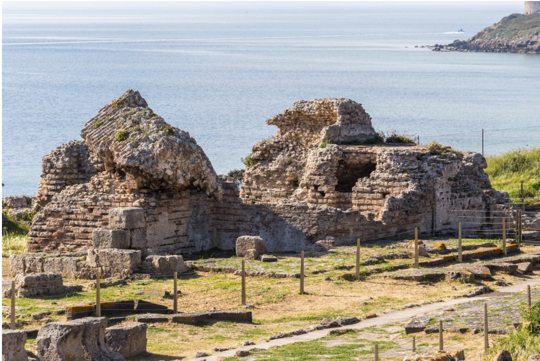
Fig. 3 - Le Terme di Convento Vecchio