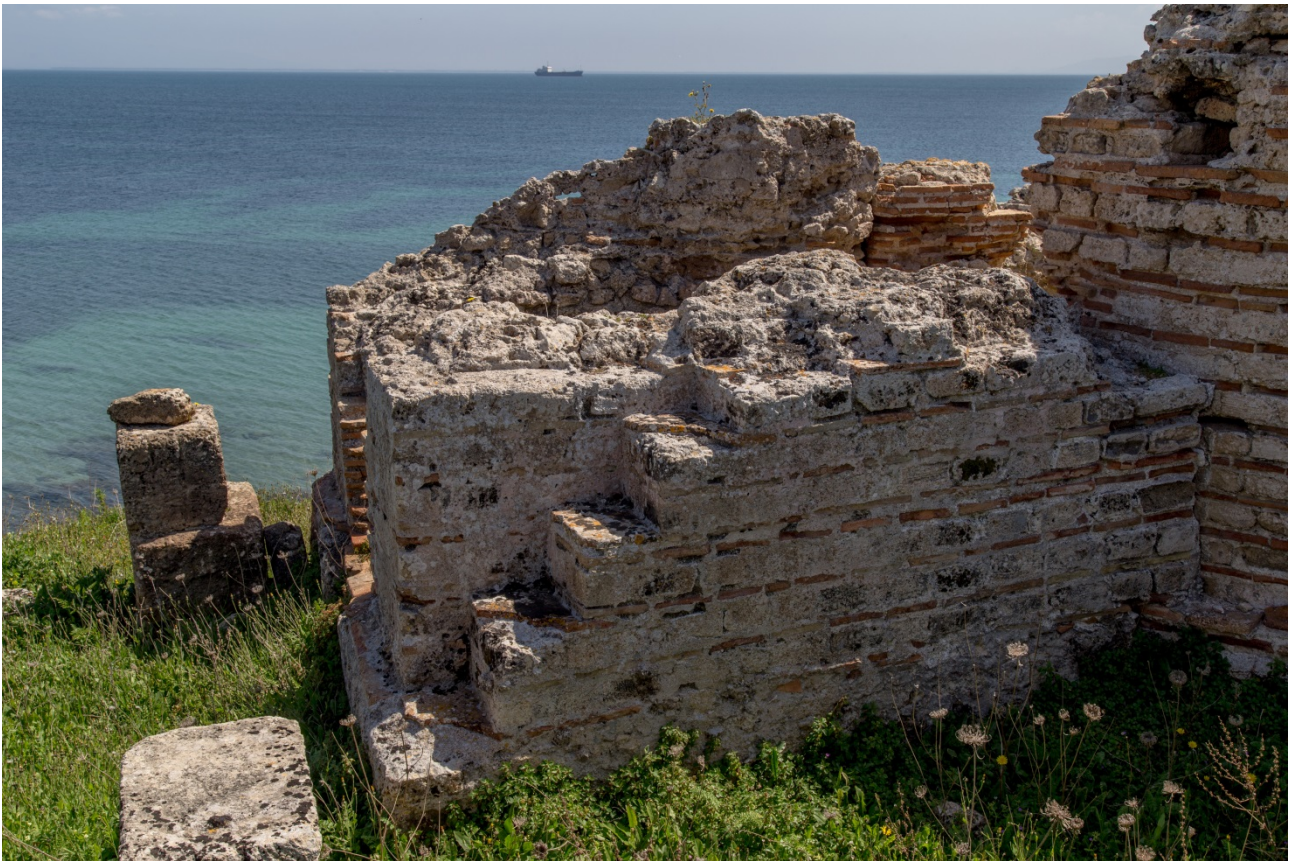
Fig. 9 - Parte esterna di un vano riscaldato, con la scaletta di servizio per accedere alle cisterne sopra la copertura dell'edificio

Da questo si accede poi agli ambienti riscaldati, posti sul lato orientale dell'edificio. Purtroppo l'azione erosiva del mare ha provocato il degrado del terreno su cui poggiava questa parte dell'edificio, e quindi al successivo crollo, per cui la ricostruzione non può essere dettagliata. E' sicura la presenza di tre ambienti adiacenti, uno dei quali conserva ancora il praefurnium (figg. 9-10).