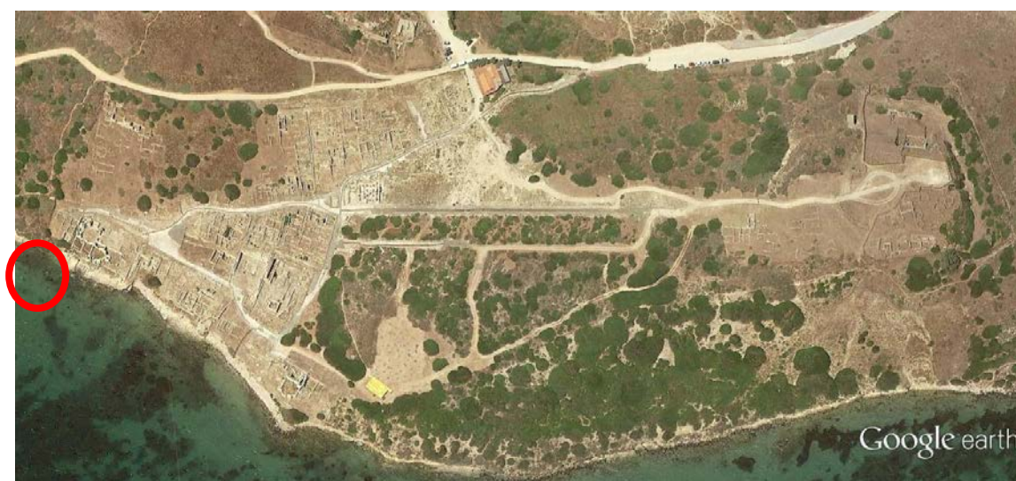
Fig. 1 - Localizzazione delle Terme di Convento Vecchio (da Google Earth. Rielaborazione di C. Tronchetti)

Le Terme di Convento Vecchio, situate sulla sponda orientale verso il Golfo di Oristano (figg. 1-3), prendono il nome, assai verosimilmente, all'utilizzo in età tardo-antica delle strutture come sede di un piccolo Convento di monaci, la cui unica testimonianza potrebbe essere una tomba di età bizantina rinvenuta nell' apodyterium dell'edificio (fig. 4).