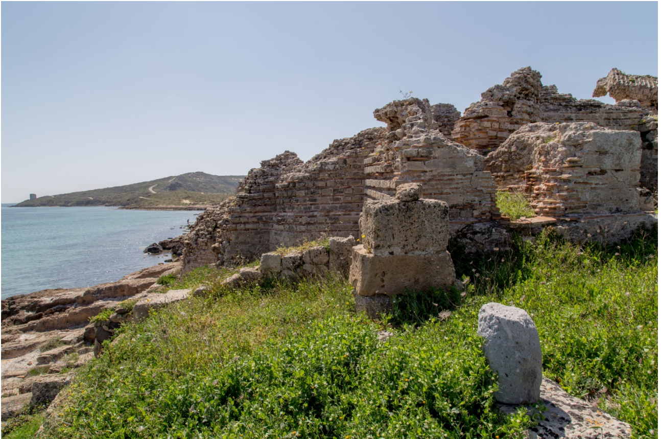
Fig. 10 - Praefurnium di un ambiente riscaldato

Da questo ambiente, attraverso un piccolo vano di passaggio, si rientra nel frigidarium . Una grande cisterna per l'acqua si trovava nella parte sud-occidentale del frigidarium , ma ne rimane solo la base che poggiava sulla copertura dell'ambiente.