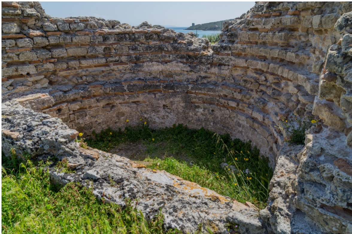
Fig. 8 – Vasca semicircolare del frigidarium