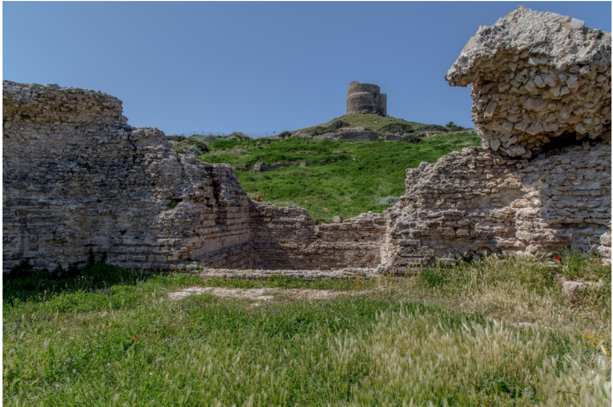
Fig. 7 - Vasca rettangolare del frigidarium