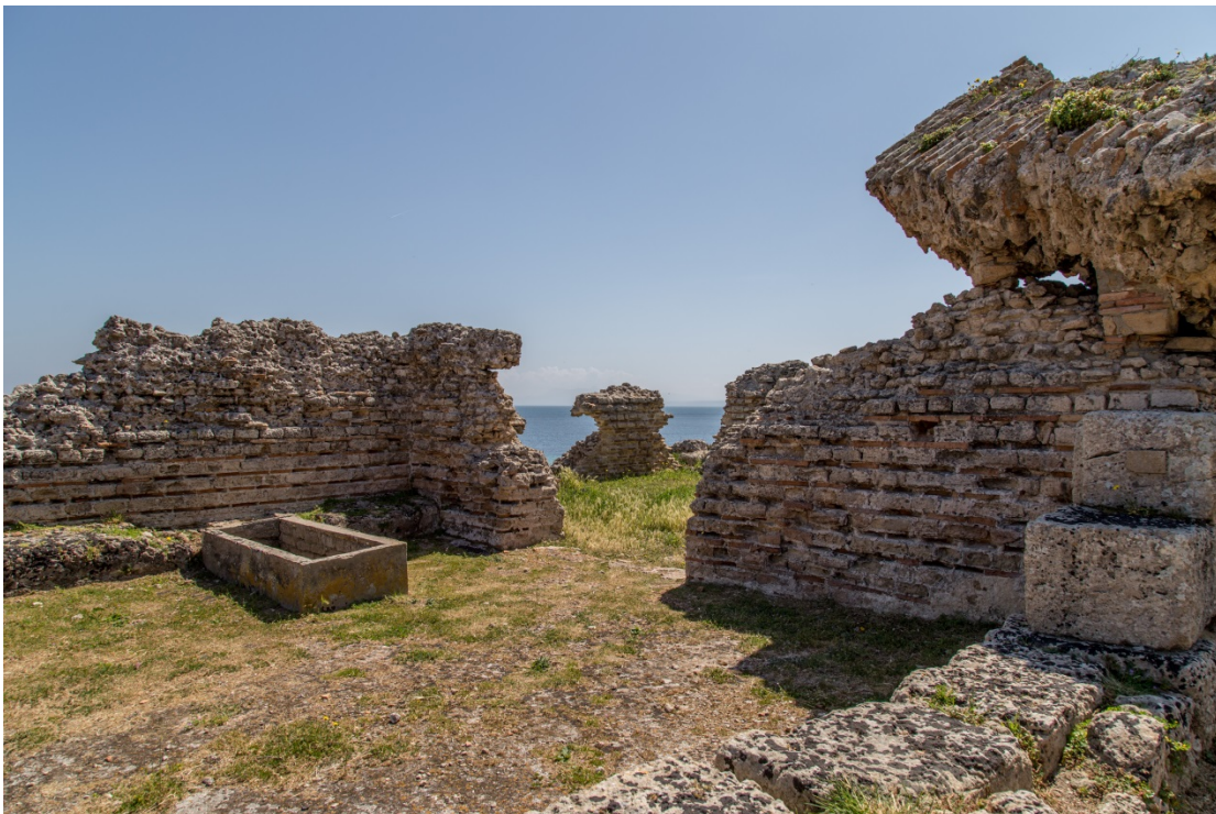
Fig. 4 - La tomba bizantina, inglobata in una struttura moderna di cemento, all'interno dell' apodyterium delle terme

Le Terme hanno il percorso interno organizzato in modo canonico (fig. 5).