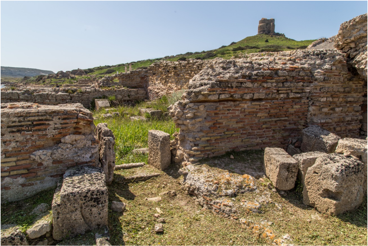
Fig. 7 - Ingresso del calidarium settentrionale aperto in epoca vandala