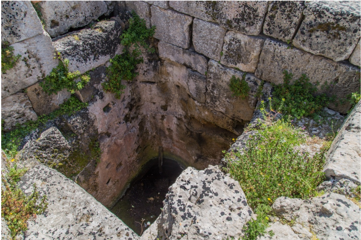
Fig. 5 - Cisternone delle Terme n. 1