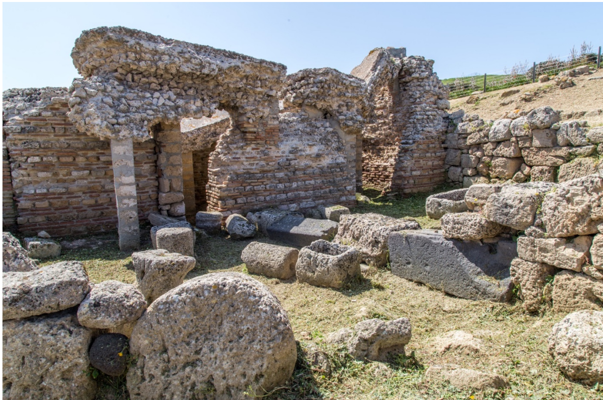
Fig. 6 - Il calidarium settentrionale trasformato in cimitero