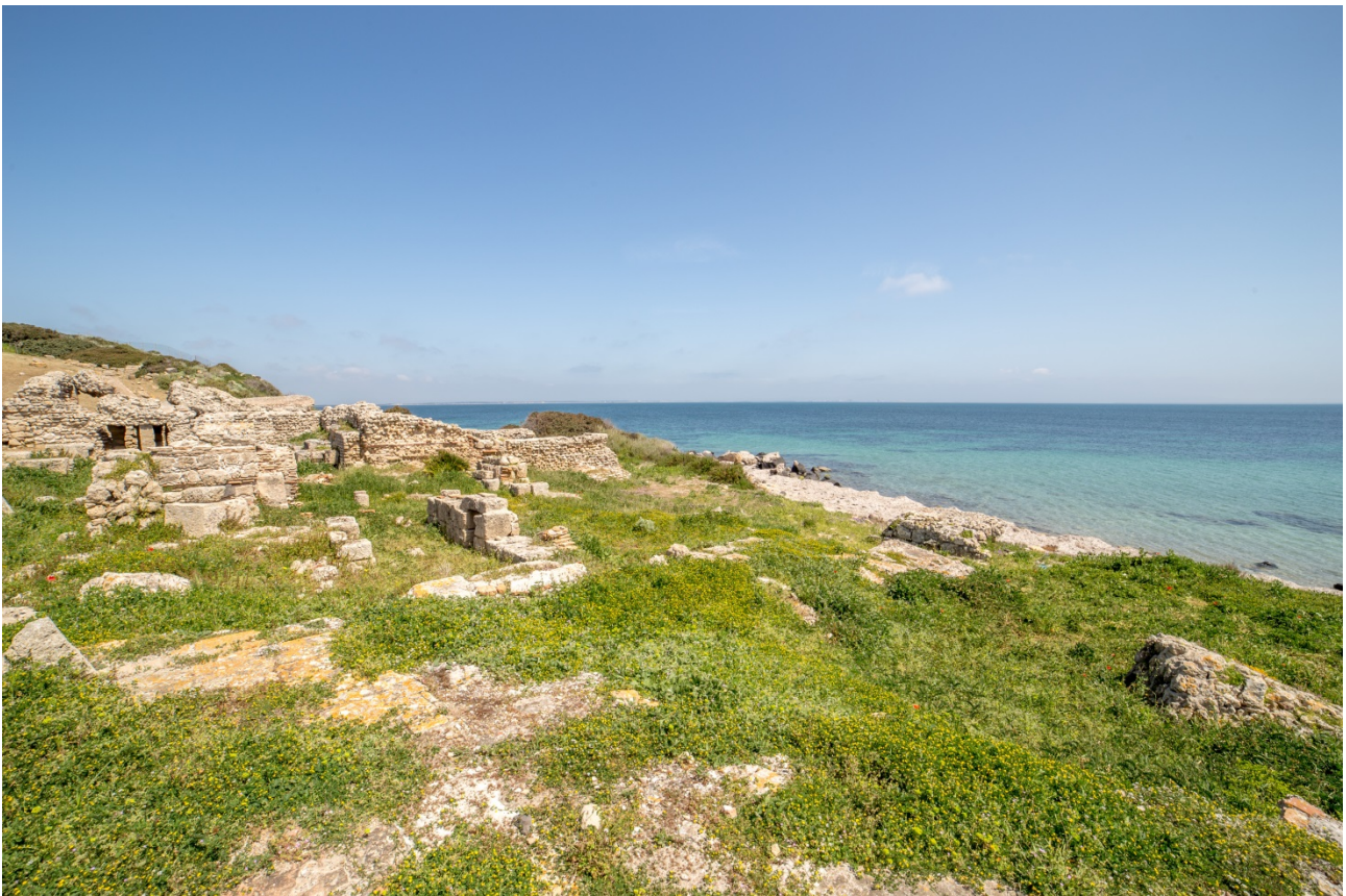
Fig. 4 - Le Terme n. 1 vista da Sud

La data di costruzione delle Terme n. 1 si pone genericamente nel corso del II sec. d.C. (figg. 4-8).