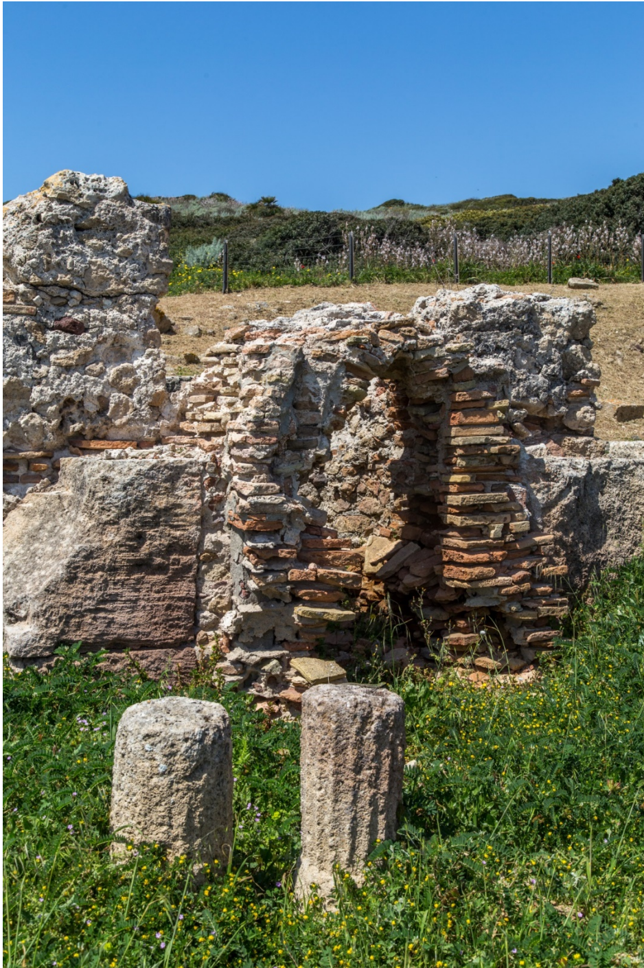
Fig. 8 - Resti di un praefurnium

In epoca tarda l'edificio fu smembrato e riadattato per altre esigenze. L'ambiente 3 e le sue adiacenze furono trasformate in parte in un cimitero e in parte forse collegate ad un edificio di culto paleocristiano sorto immediatamente a settentrione. Le datazioni ricavate dai pochi oggetti di corredo delle sepolture indicano una frequentazione in età vandala e bizantina.