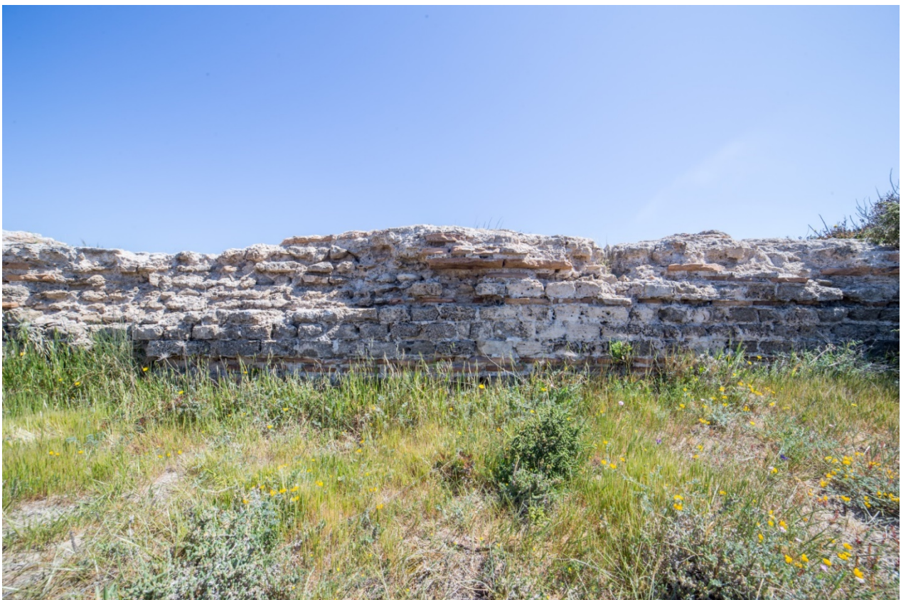
Fig. 4 - La struttura edilizia dell'acquedotto