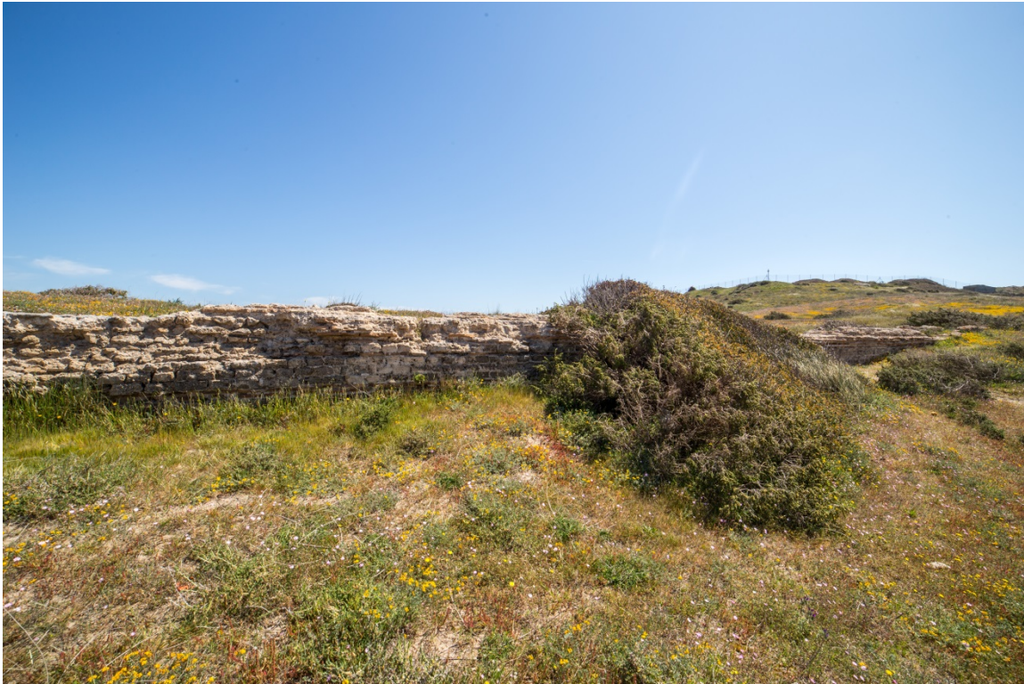
Fig. 3 - Tratto dell'acquedotto