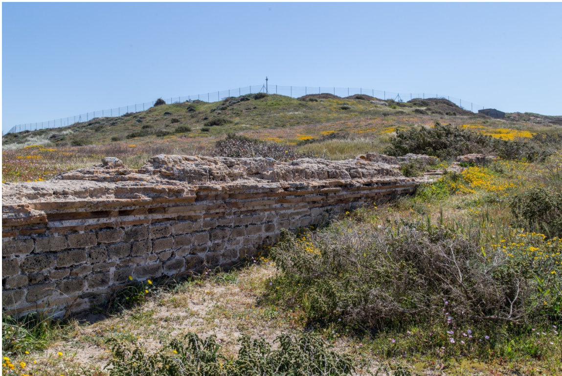
Fig. 2 - L'acquedotto; sullo sfondo il colle di Su Muru Mannu

Nella parte iniziale erano sicuramente presenti arcate, per poter superare il dislivello del colle, ma non sono rimasti resti dell'elevato e conosciamo solo l'interasse dei piloni di sostegno, che varia dai 3 ai 2,50 metri.