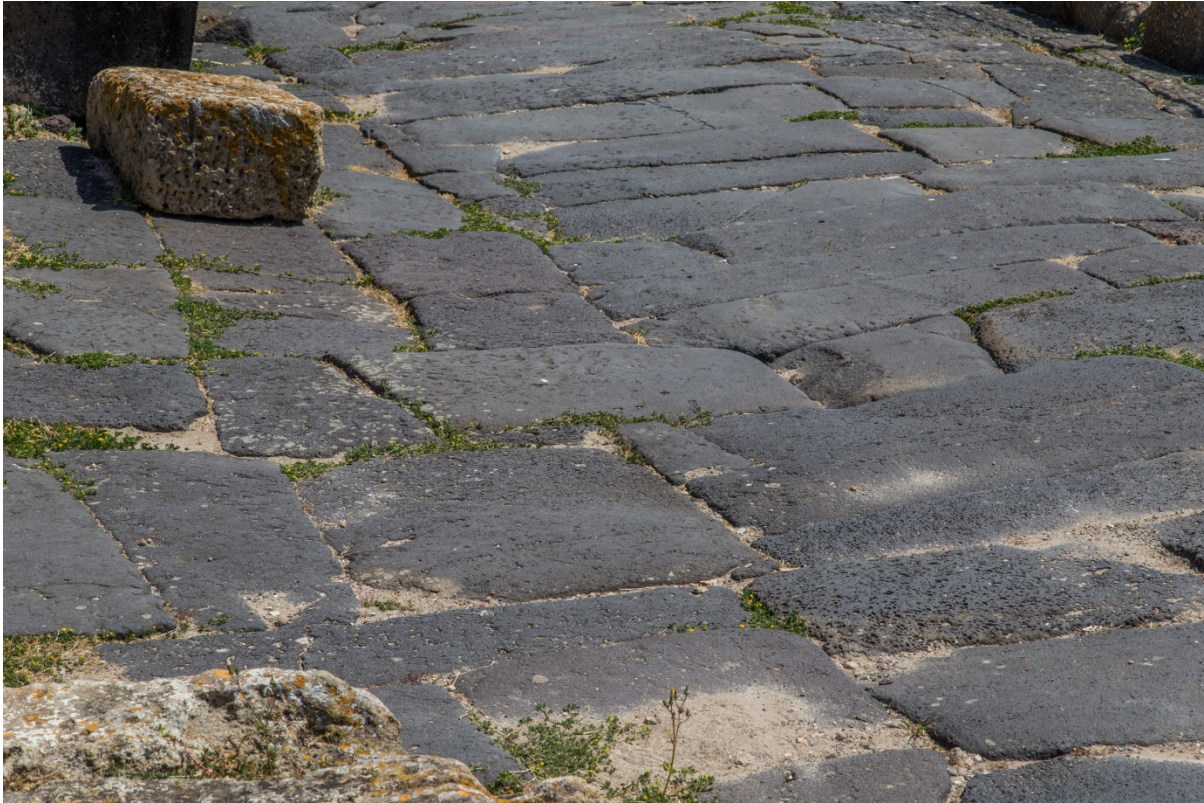
Fig. 5 - Lastricatura di una strada

La lastricatura delle strade (fig. 5) sembra essere dovuta ad un intervento unitario di sistemazione del centro urbano, che non siamo in grado di datare, ma che, sulla base di un analogo fenomeno riscontrato a Nora, si può ipotizzare avvenuto fra il II ed il III sec. d.C..