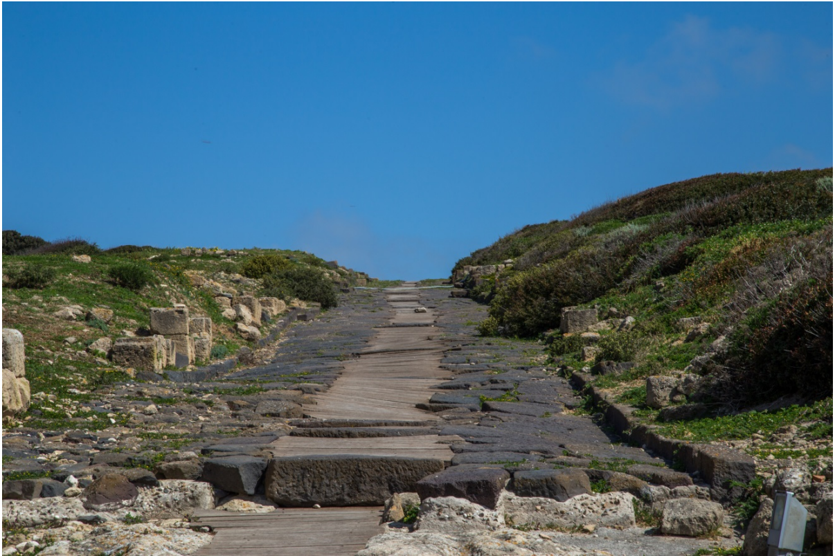
Fig. 3 - Grande strada con andamento N-S; al centro il tracciato della fogna romana, coperto attualmente in legno per motivi di sicurezza