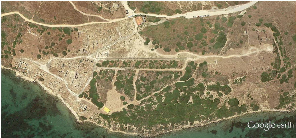
Fig. 1 - Tharros: si individuano chiaramente le due grandi strade che portano dal centro alla sommità del colle di Su Muru Mannu (a destra), e la ripartizione in quartieri data dalle maggiori vie urbane

In età imperiale romana la città venne dotata di un apparato viario costituito da strade accuratamente lastricate in spesse lastre di basalto che coprivano un efficiente sistema fognario scavato nella roccia sottostante (figg. 1-4).