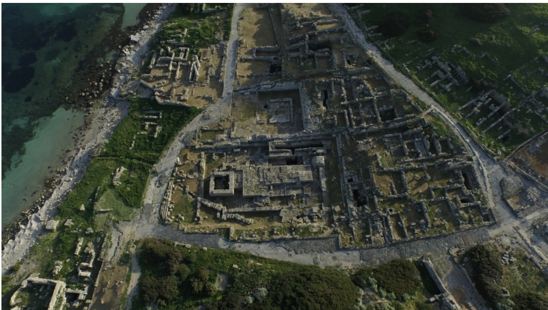
Fig. 2 - Le vie che definiscono il quartiere centrale di Tharros