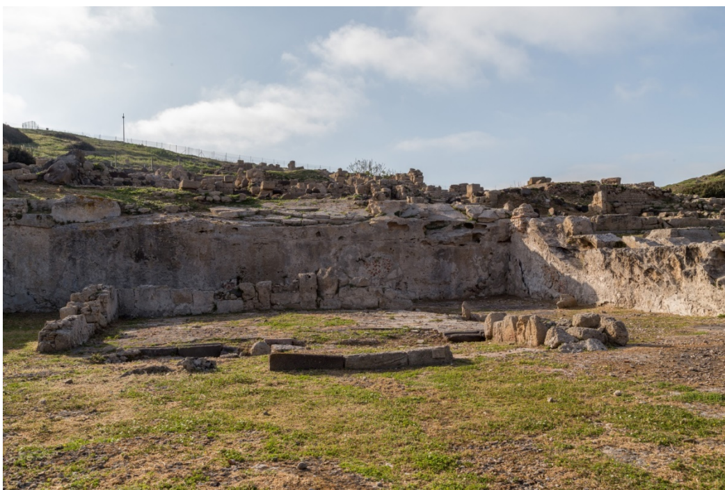
Fig. 16 - Il tempio a pianta di tipo semitico

Sul lato orientale della strada si trovano due edifici termali, le Terme n. 1 e le Terme di Convento Vecchio, tra le quali si trovava un edificio di incerta funzione, forse culturale, dotato di un colonnato di cui sono state ricostruite due colonne (fig. 17).