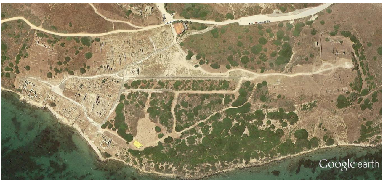
Fig. 7 - Veduta aerea dell'area di Tharros, dal colle di Su Muru Mannu (a destra), sino al termine dell'area indagata (a sinistra)

L'abitato vero e proprio si stendeva sulle pendici meridionali di Su Muru Mannu e su quelle orientali del Colle di San Giovanni, dominato dalla torre omonima, sino a giungere alla sponda del mare prospiciente il Golfo di Oristano (fig. 7).