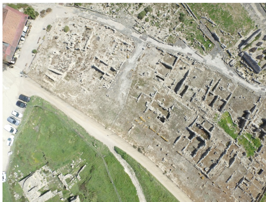
Fig. 9 - Il quartiere sulle pendici del colle di San Giovanni