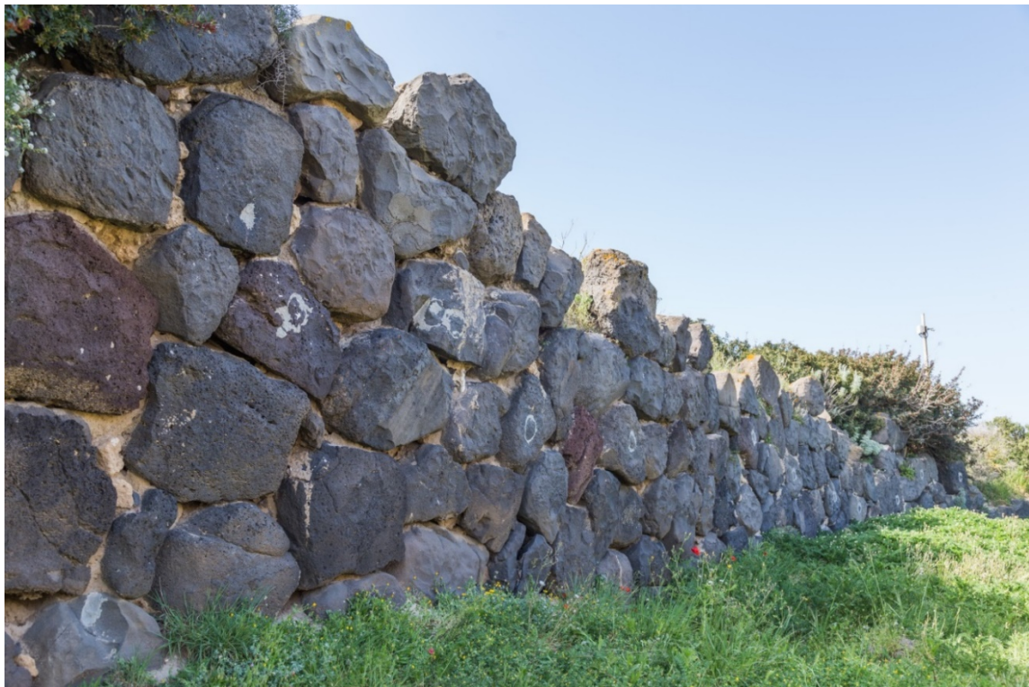
Fig. 3 - Muro di controscarpa delle fortificazioni