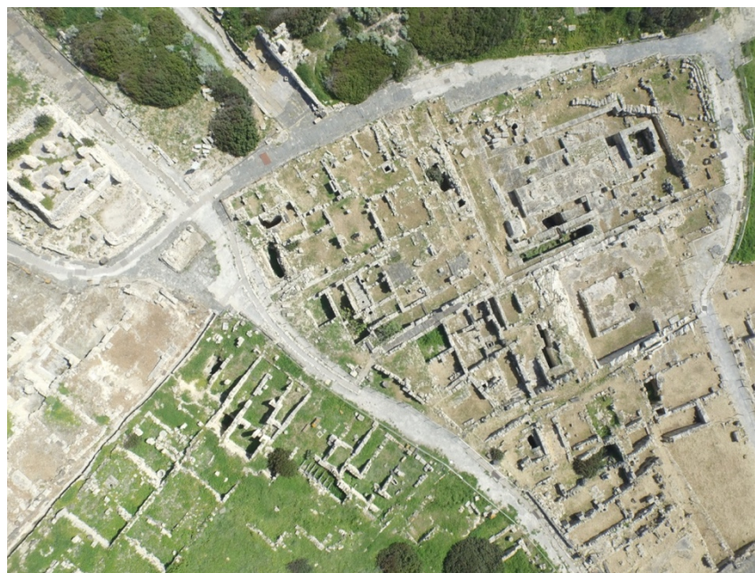
Fig. 8 - Il quartiere centrale

Il versante del colle di Su Muru Mannu è scandito da due grandi strade lastricate in basalto, che individuano tre grandi isolati, ancora da indagare. Il settore meridionale dell'abitato è diviso in quartieri da grandi strade basolate e, a loro volta, questi sono attraversati da piccole e strette viuzze, anch'esse pavimentate e dotate di fognature (figg. 8-12).