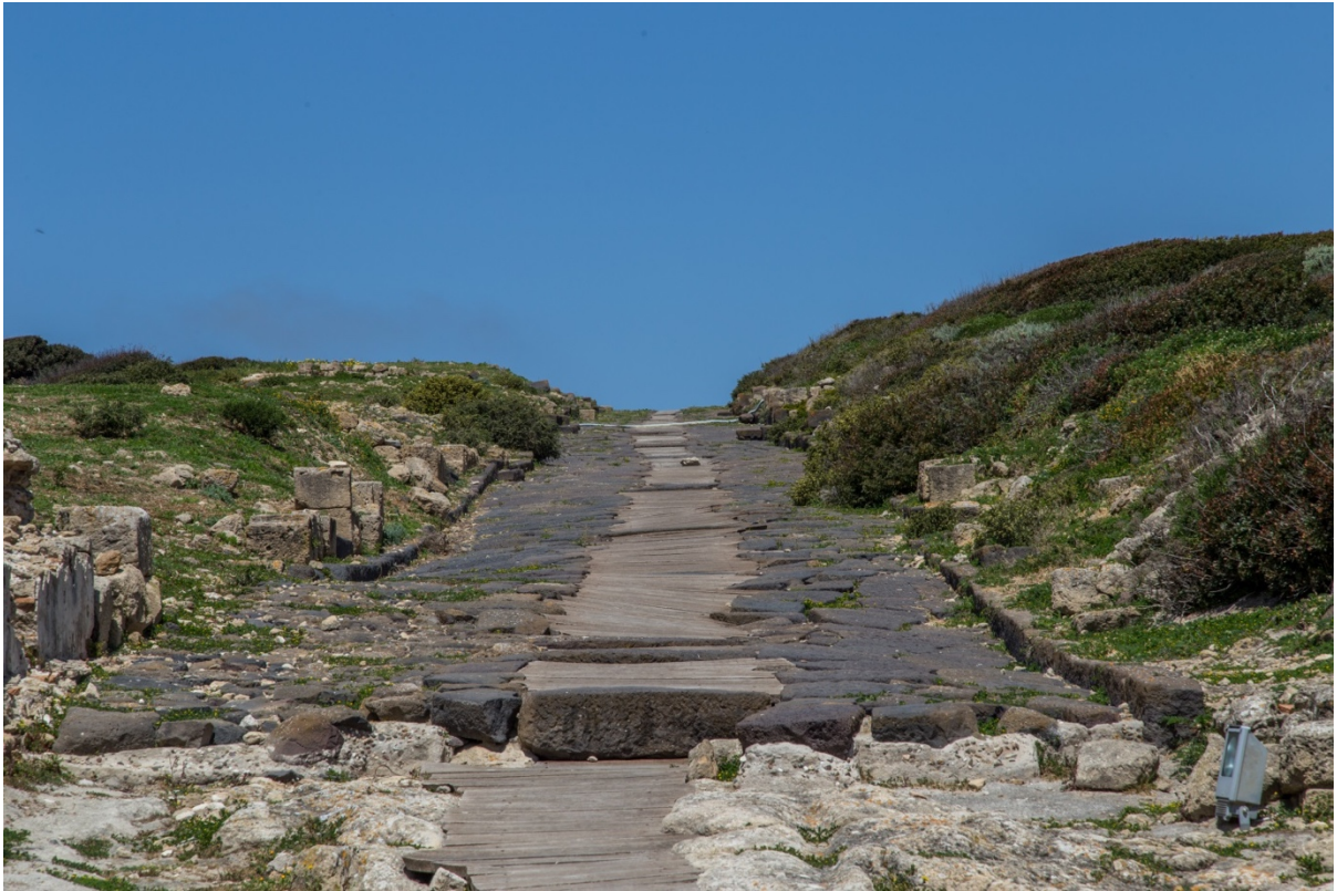
Fig. 10 - Grande strada N-S sul colle di Su Muru Mannu