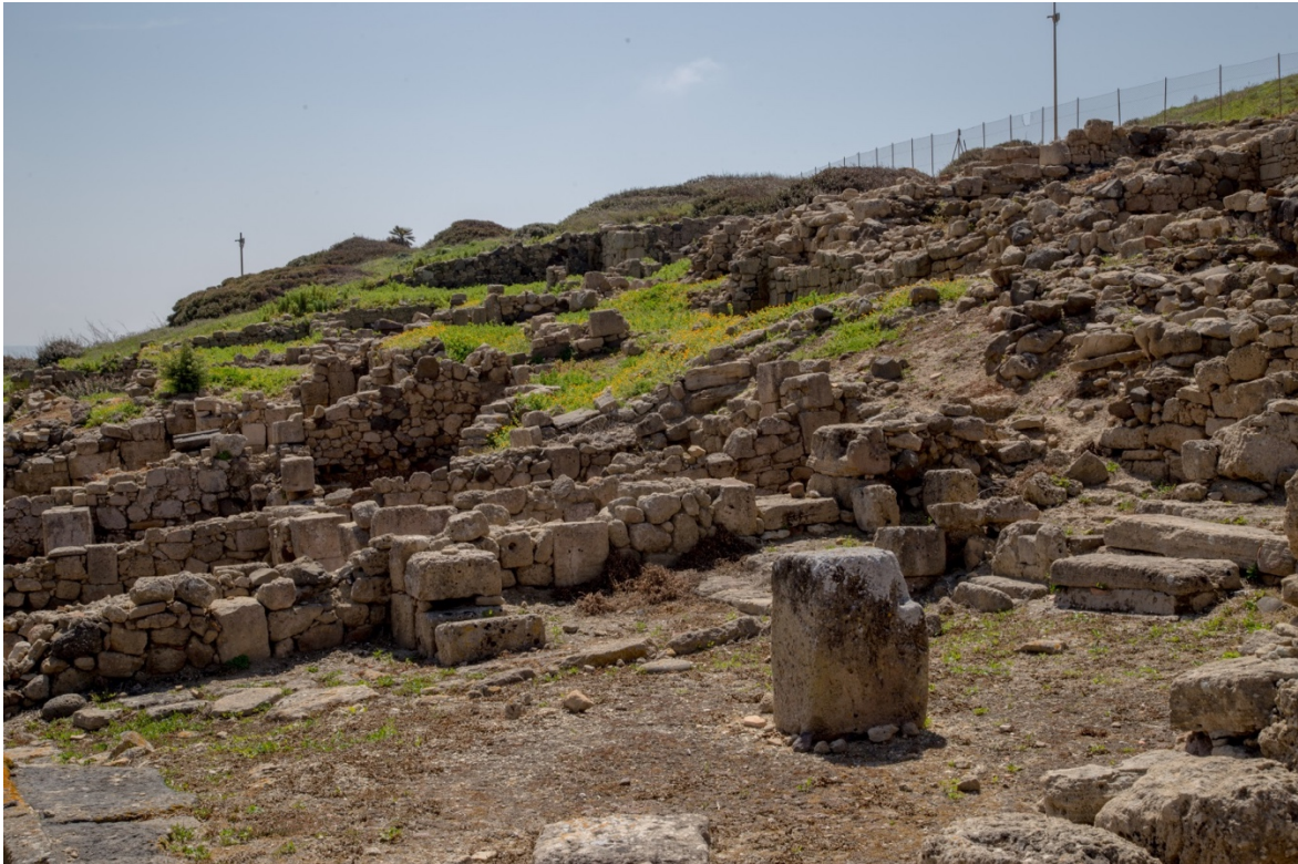
Fig. 18 - Il quartiere di abitazioni sul colle di San Giovanni

La restante area urbana è per la maggior parte destinata all'abitato, costruito terrazzando il terreno in forte pendio. Piccole case di uno o due vani, spesso con un soppalco, si accostano senza avere una precisa definizione di tecnica e pianta, accomunate solo dall'essere disposte lungo un pendio e doversi affacciare verso le stradine che le servivano (figg. 18-19).