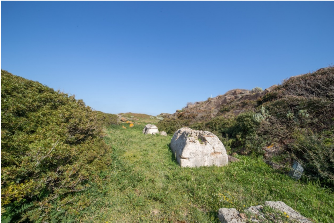
Fig. 4 - La necropoli romana di prima età imperiale sorta nel fossato defunzionalizzato (foto di Unicity S.p.A.)

Siamo evidentemente in una zona marginale rispetto all'abitato vero e proprio e questo è confermato dalla costruzione in età medio-imperiale di un anfiteatro circolare edificato su aggere (figg. 5-6).