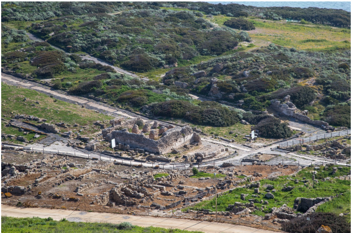
Fig. 14 - La piazza centrale ed il castellum aquae