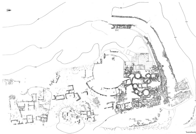
Fig. 5 - La sommità del colle di Su Muru Mannu con al centro i resti dell'anfiteatro

Siamo evidentemente in una zona marginale rispetto all'abitato vero e proprio e questo è confermato dalla costruzione in età medio-imperiale di un anfiteatro circolare edificato su aggere (figg. 5-6).