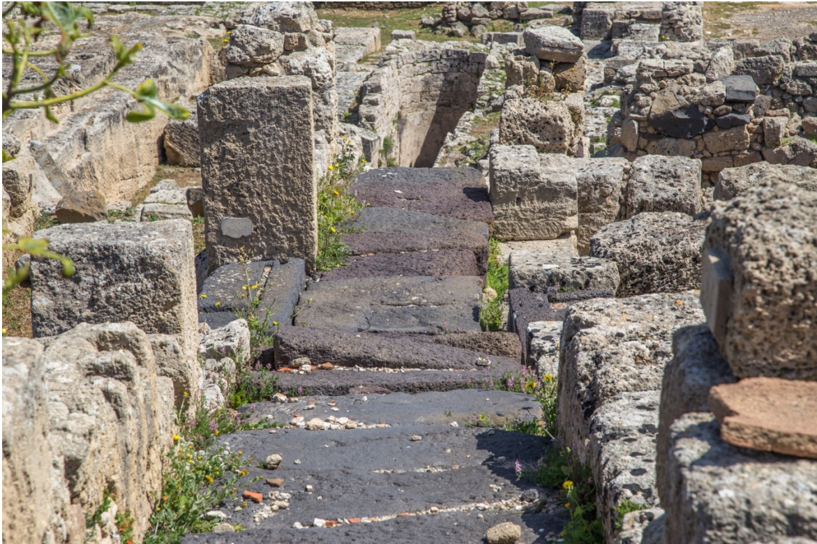
Fig. 19 - La soglia di un'abitazione che si apre su un ambitus

La Tharros romana era uno dei centri più importanti della Sardegna. Nodo dei traffici dalla penisola iberica verso Ostia, il porto di Roma, abbiamo testimonianza di questo ruolo nei relitti individuati presso le sue coste occidentali. In particolare uno di questi recava un ingente carico di piombo proveniente da miniere spagnole e diretto a Roma.