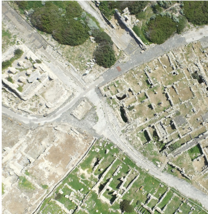
Fig. 13 - La piazza all'incrocio di quattro strade