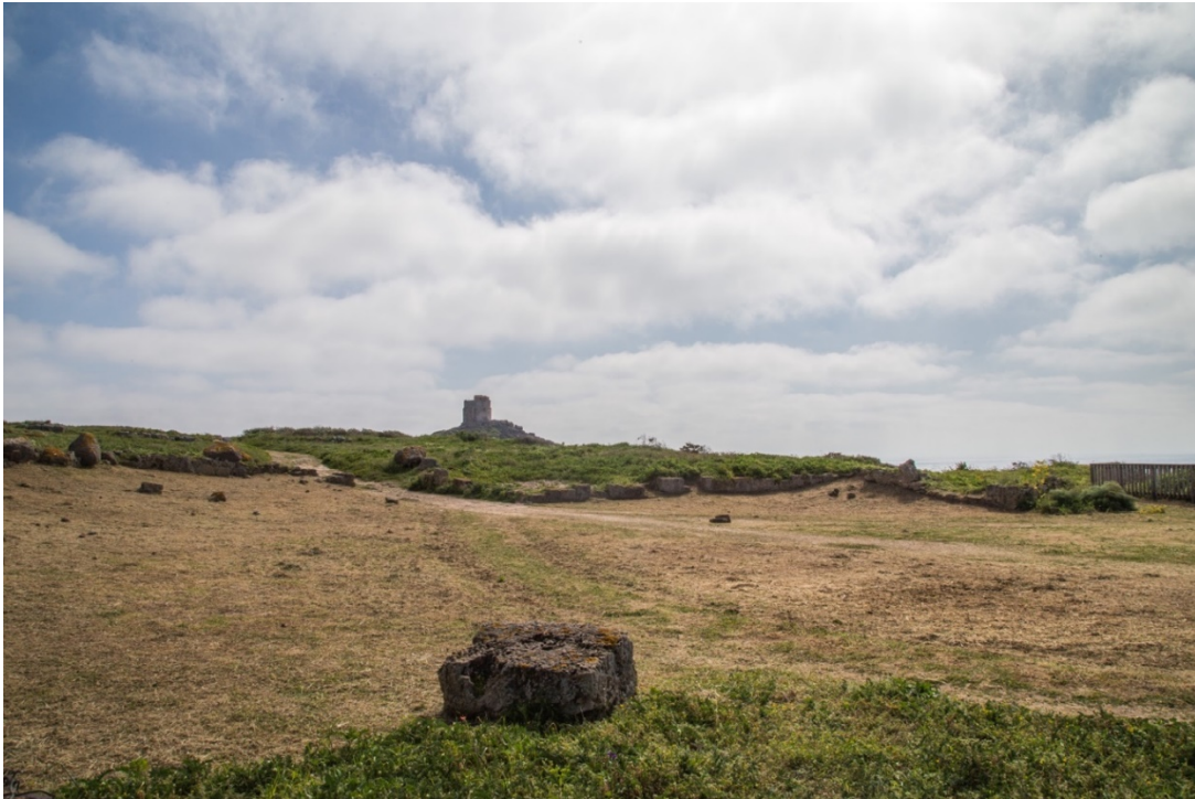
Fig. 6 - Lo spiazzo dove sorgeva l'anfiteatro

L'abitato vero e proprio si stendeva sulle pendici meridionali di Su Muru Mannu e su quelle orientali del Colle di San Giovanni, dominato dalla torre omonima, sino a giungere alla sponda del mare prospiciente il Golfo di Oristano (fig. 7).