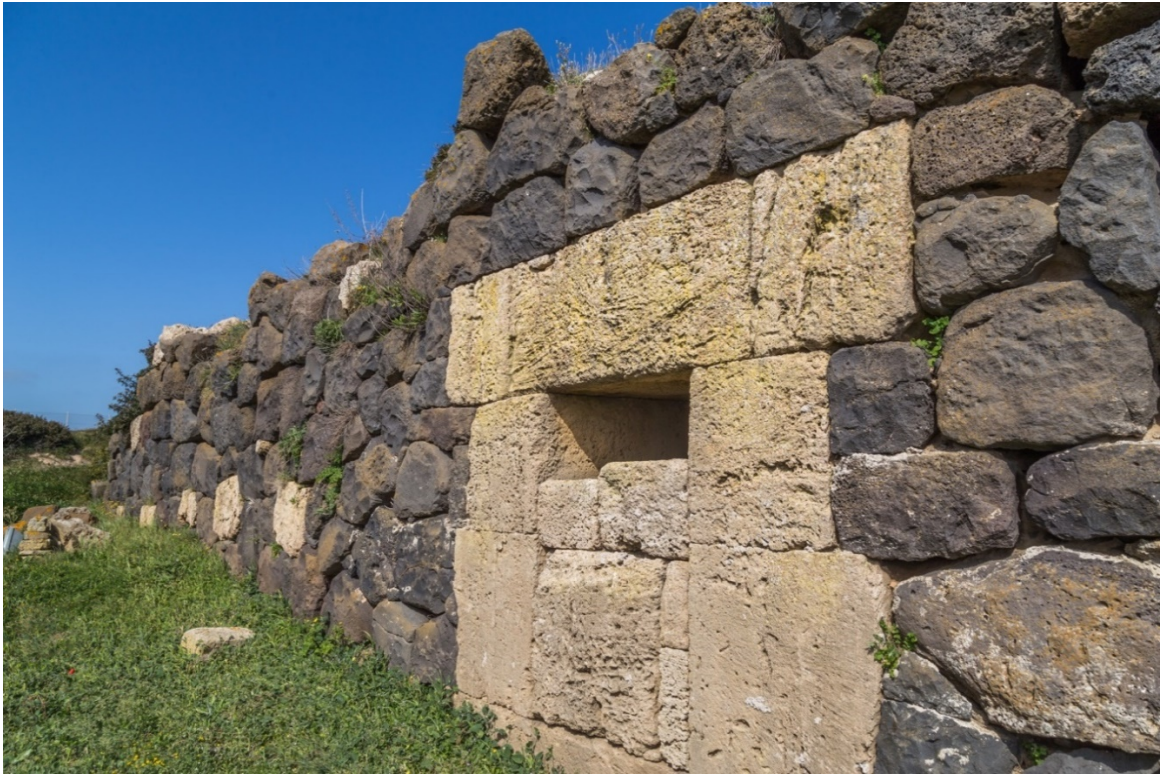
Fig. 2 - Muro di cinta delle fortificazioni, con una postierla occlusa in età posteriore