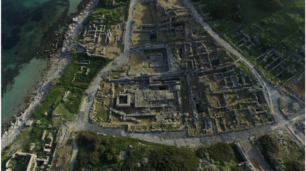
Fig. 15 - La zona pubblica della città romana

La zona pubblica della città si stende nel settore urbano prospiciente il Golfo di Oristano, percorso da una strada longitudinale (fig. 15).