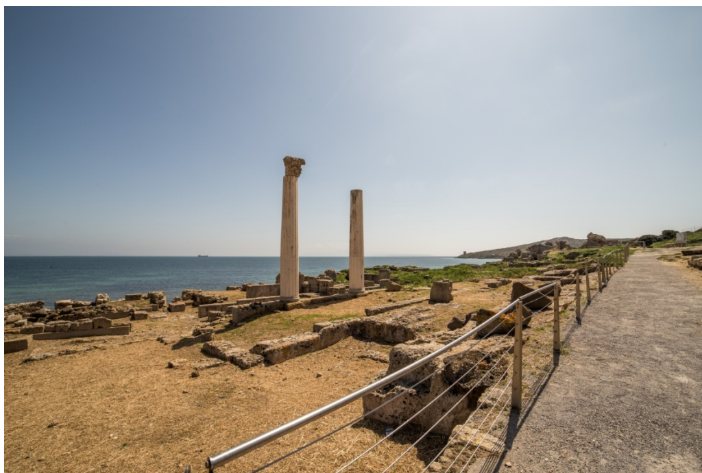
Fig. 17 . L'edificio con colonnato.

Sul lato orientale della strada si trovano due edifici termali, le Terme n. 1 e le Terme di Convento Vecchio, tra le quali si trovava un edificio di incerta funzione, forse culturale, dotato di un colonnato di cui sono state ricostruite due colonne (fig. 17).