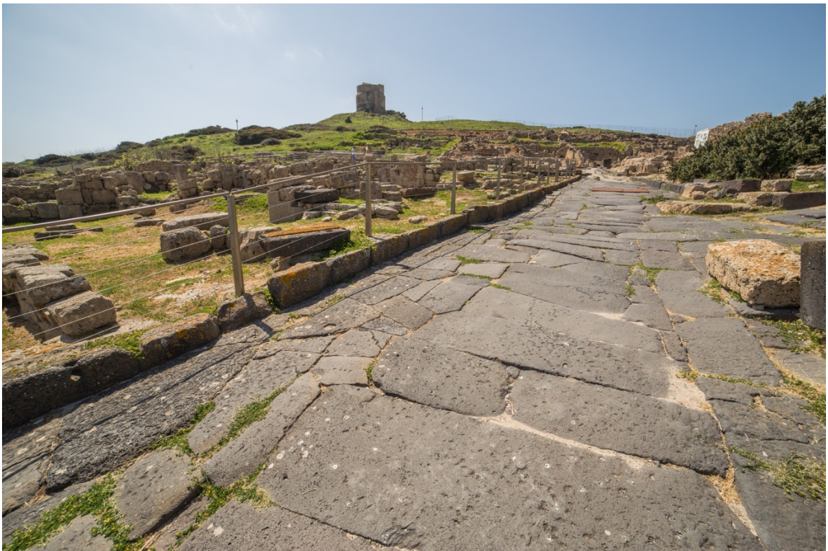
Fig. 11 - Grande strada che definisce a settentrione il quartiere centrale