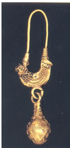
Fig. 4 - Orecchino aureo con ansa ellittica, un corpo a falce con protomi di uccello ed un pendente a globetto con peduncolo molto evidenziato (V sec. a.C.) (da AA.VV. 1990, fig. 4)