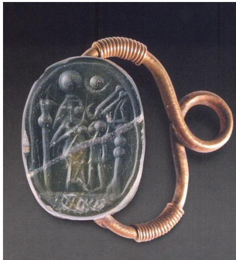
Fig. 1 - Scarabeo in diaspro verde montato in oro con la raffigurazione di Iside che nutre Horus (IV sec. a.C.) (da AA.VV. 2004, p. 73 )

Gli approfonditi studi sulla gioielleria punica hanno permesso di ipotizzare che la maggior parte di questi gioielli fossero fabbricati a Tharros stessa, a fronte di una quantità minore di importazioni. Il fatto che il diaspro verde in cui sono scolpiti gli scarabei (fig. 1) sia di origine sarda rafforza questa ipotesi, essendo più che verosimile che la montatura venisse realizzata sul posto su misura per l'amuleto.